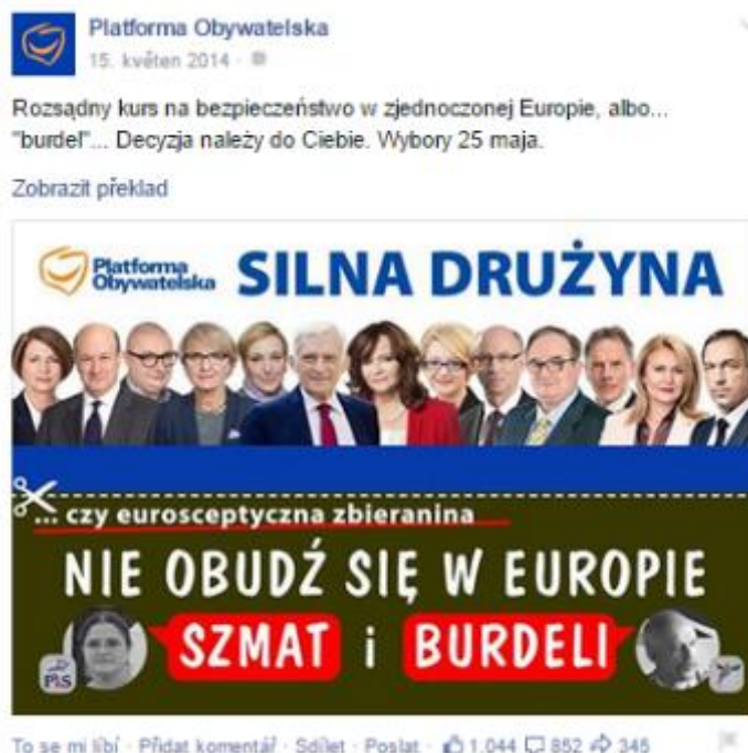
Obrázek 8: Nejúspěšnější příspěvek na profilu PO s tematikou týkající se EU.

PO zveřejňovala průměrně 2,4 příspěvku na den. Pouze 5 příspěvků informovalo o jakémkoli tématu v rámci jejich volebního programu. Nicméně PO se stejně jako TOP 09 zaměřila na mobilizaci voličů k tomu, aby přišli k evropským volbám. Tuto skutečnost lze hodnotit pozitivně u obou politických stran. Tímto taktéž vyjadřují svůj postoj, důležitost EU a EP jako takového. Nejúspěšnějším publikovaným příspěvkem obsahujícím téma spojené s EU se stal již zmíněný příspěvek z 15. května 2014, získal 1044 liků (viz obrázek č. 8).