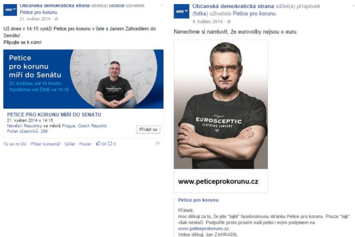
Obrázek 1: Petice pro korunu.

ODS na svém profilu ve vymezeném období prezentovala celkem 69 příspěvků. Do výzkumu bylo zařazeno celkem 68 příspěvků. Jeden byl vyřazen a to z toho důvodu, že neobsahoval žádný text ani v rámci grafického znázornění či odkazu, tudíž nebylo co zkoumat. Jejich facebooková kampaň byla zaměřena převážně na téma, se kterým je strana již dlouhodobě spojována a to odmítání eura. Z toho také vyplývá nejpoužívanější slovní spojení kampaně – „Petice pro korunu“. Dalšími dílčími tématy vycházejícími z jejich volebního programu, jimiž se strana na sociální síti zabývala, byly nesouhlas s přijetím evropských daní, reforma EU, pouze jedno sídlo evropského parlamentu a regulace nařízení. V tabulce č. 7 jsou všechna tato témata uvedena a také příklady příspěvků. Všechny příspěvky jsou označeny jako negativní, ani jeden totiž nevychází ze současných politik a nastavení EU (případně evropské integrace), spíše právě naopak. Z toho vychází i heslo pro evropské volby ODS: „Otáčíme EU správným směrem“. Mimo příspěvky, které jsou naznačeny v tabulce č. 7, se na profilu strany objevovaly kritiky vládní politiky a příspěvky věnující se problematice zahraniční politiky (situace na Ukrajině). (Facebook ODS)