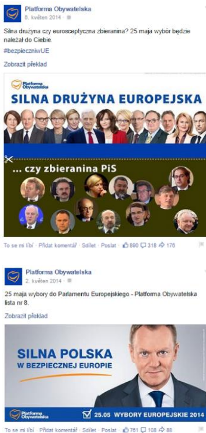
Obrázek 7: Silný evropský tým.