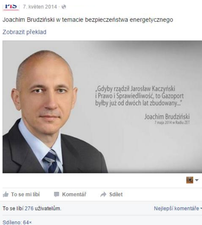
Obrázek 6: Nejúspěšnější příspěvek na profilu PiS s tematikou týkající se EU.