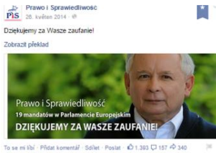
Obrázek 5: Poděkování voličům PiS za hlasování ve volbách.