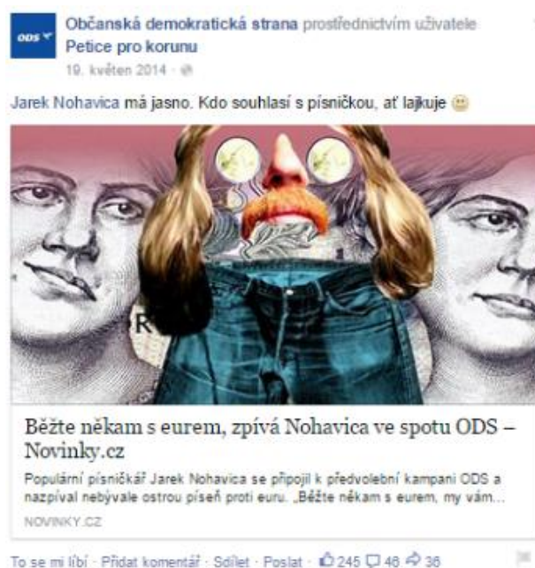
Obrázek 2: Nejúspěšnější příspěvek na profilu ODS s tematikou týkající se EU.