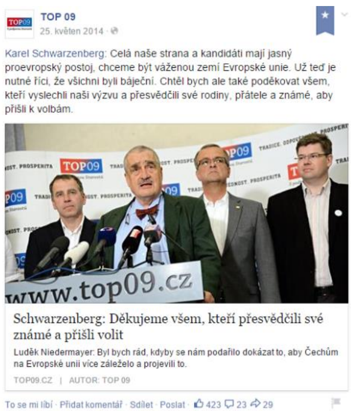
Obrázek 4: Nejúspěšnější příspěvek na profilu TOP 09 s tematikou týkající se EU.