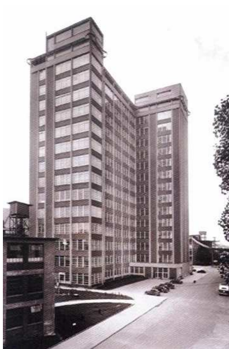
Obrázek 2 Zlínský mrakodrap – „21“

Zlínský mrakodrap, známý jako „jedenadvacítka“, byl dokončen v roce 1938 podle projektu architekta Vladimíra Karfíka. Tato 77,5 m vysoká budova byla před válkou nejvyšším objektem v Československu. Skutečnou technickou lahůdkou je výtah (kancelář šéfa firmy) o rozměrech 6 x 6 metrů s klimatizací a s umývadlem. Samozřejmostí je potrubní pošta či podlahové zásuvky elektrického proudu. Vrcholné Karfíkovo dílo je dnes národní kulturní památkou období funkcionalismu.