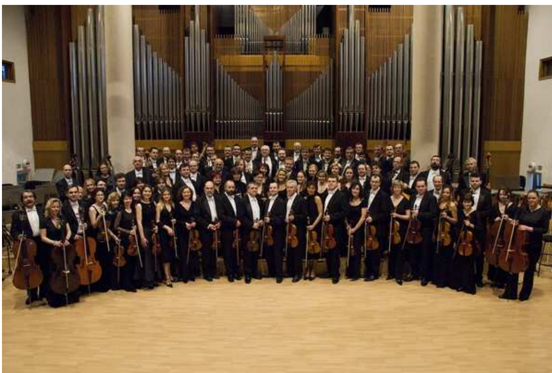
Příloha č. 28: Fotografie Kompletního orchestru Filharmonie Bohuslava Martinů