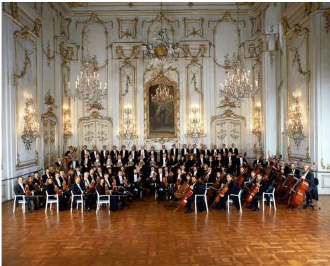
Příloha č. 11: Fotografie Filharmonie Bohuslava Martinů na zámku v Kroměříži