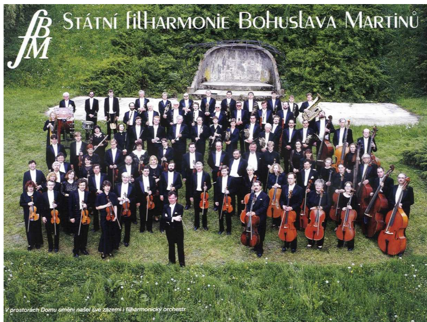
Obrázek 7 Filharmonie Bohuslava Martinů

Orchestr stále zažívá vrcholné okamžiky, které nesou Filharmonii Bohuslava Martinů na přední místa světového formátu.