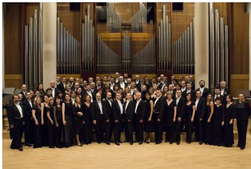
Příloha č. 10: Fotografie členů orchestru Filharmonie Bohuslava Martinů