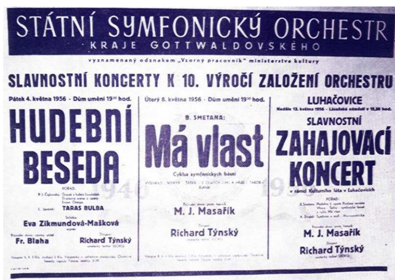
Obrázek 6 Vývěsný plakát k pozvání na koncert

SSOKG na konci tohoto období se pokládá za hudební těleso, které je schopno vyjádřit osobité stylové nároky hudby 20. století nejen u nás, ale i v zahraničí.