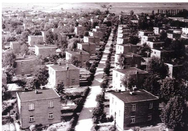
Obrázek 1 Baťovy domky – Obytná čtvrť Podvesná

Působením významných architektů (J. Kotěra, F. L. Gahura, V. Karfík, M. Lorenc) získal Zlín evropsky ojedinělý charakter funkcionalistického města, který nemá obdoby v celé Evropě. Charakteristikou většiny dominantních staveb ve městě jsou typické neomítnuté červené cihly, které jsou základním stavebním prvkem všech objektů, železobetonový skelet, rovná střecha a ocelová okna. Ve městě vyrostly i typické kolonie Baťových jednodomků, dvojdomků a čtvrtdomků určené pro ubytování dělníků. Postaveny tak byly celé městské čtvrti – Zálešná, Podvesná, Letná, Lesní čtvrť nebo Díly. Většina objektů je dnes součástí městské památkové zóny.