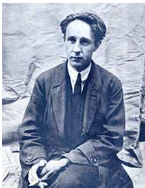
Obrázek 5 Bohuslav Martinů