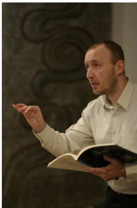
Obrázek 8 Současný šéfdirigent Stanislav Vavřínek

V letech 1999-2008 působil jako šéfdirigent Jihočeské komorní filharmonie České Budějovice, v září 2008 se stal šéfdirigentem Filharmonie B. Martinů. Od roku 2006 působí jako pedagog oboru dirigování na pražské AMU.