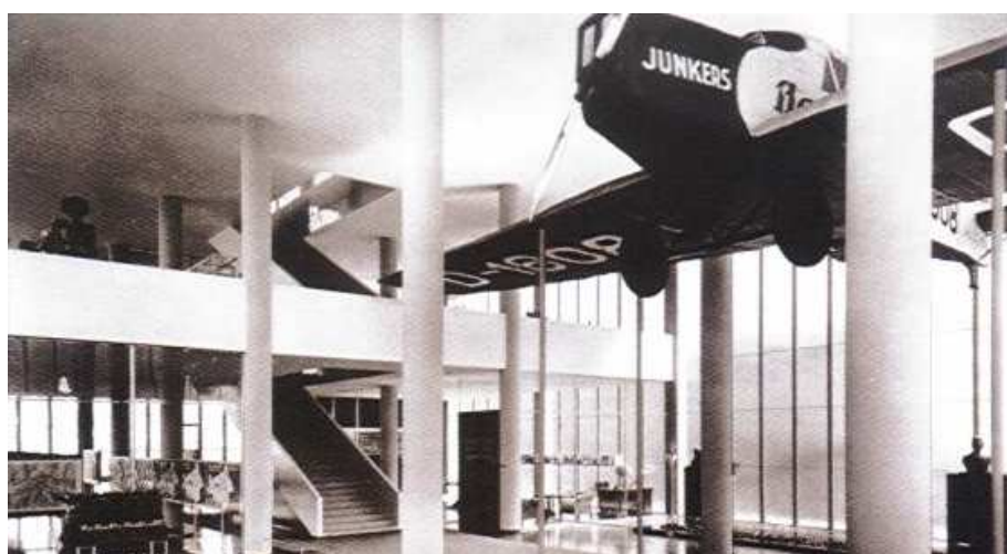
Obrázek 3 Letadlo JUNKERS, ve kterém T. Baťa zahynul (bývalá expozice Památníku Tomáše Bati vystavěného v roce 1933)

Neméně zajímavá byla i architektem Gahurou vytvořená vnitřní kompozice památníku. Jejím základním motivem bylo letadlo Junkers, místo posledních vteřin života T. Bati. Bylo zavěšeno v dominantním kontinuálním prostoru, vytvořeném přes dvě patra v západní části stavby (dnes je zde koncertní sál) na osu původních schodišť - venkovního před původním vstupem a jednoramenného vnitřního. Nad průnikem os se symbolicky vznášela kabina letounu. V hale byl vystaven i motor havarovaného letadla a bysty Bati a členů jeho rodiny.