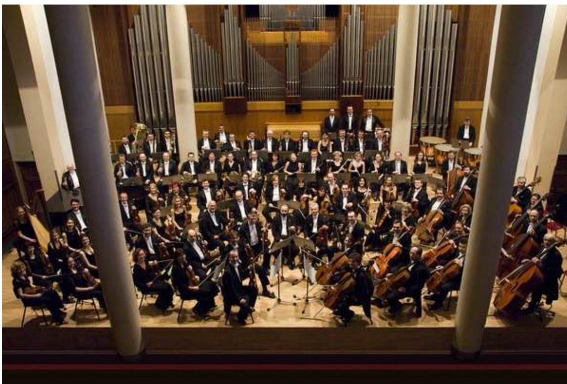
Příloha č. 27: Fotografie Koncertního sálu Filharmonie Bohuslava Martinů