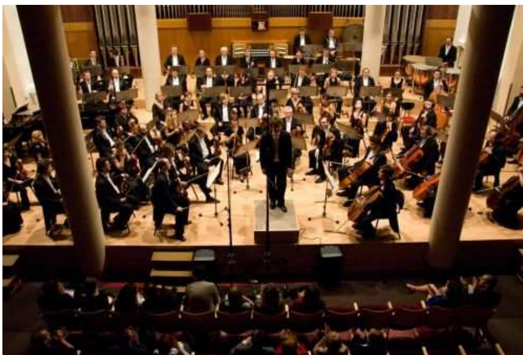
Příloha č. 12: Fotografie Koncertního sálu Domu umění