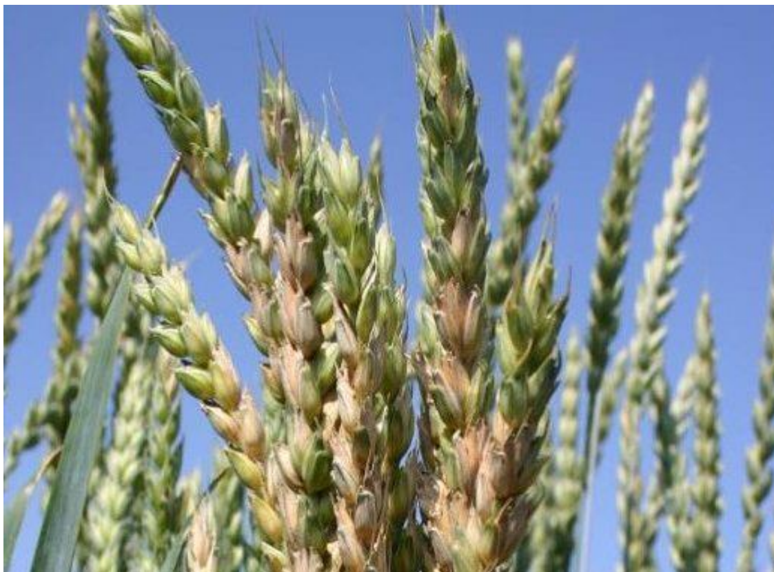
Obrázek 2: klasy pšenice postižené fusariózou (VÚRV 2020)

Výskyt fusariózy se v posledních několika letech zvýšil ve všech významných pěstitelských oblastech pšenice. Šlechtitelé proto hledají kultivary s rezistencí vůči fusariózám (Steiner et al. 2017), což je v boji proti této nemoci spolu s ošetřením fungicidy (Chrprová 2021) nejúčinnějším řešením. Důvodem nárůstu epidemií fusarióz je nejspíše částečný nebo úplný odklon od obdělávání půdy a frekventovanější užívání kukuřice při střídání plodin. K redukci epidemií nepřispívají ani vysoká vlhkost a teplé počasí během období kvetení pšenice (Steiner et al. 2017).