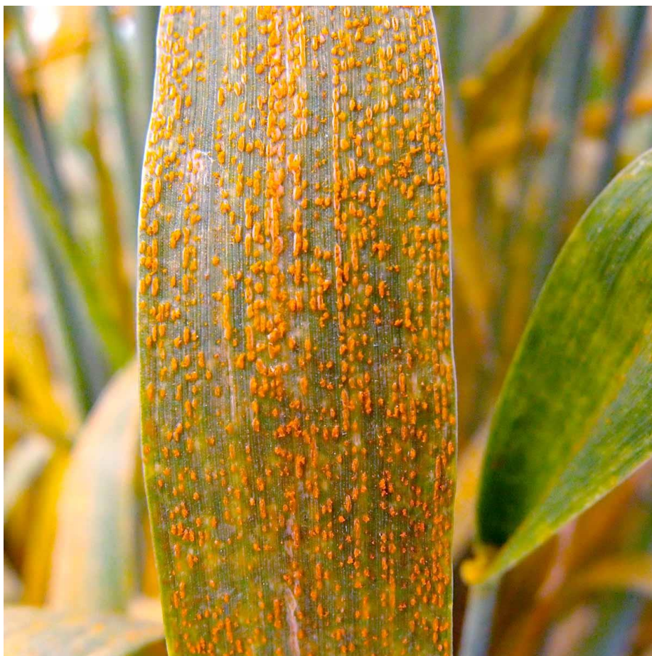
Obrázek 3: Projevy rzi pšeničné (Hanzalová 2018)

Pro získání odolné odrůdy mohou mít význam některé geny Lr . Geny Lr jsou obecně známé svou odolností k pšeničné rzi, bezmála polovina z nich je však cizího původu. Pro vliv na kvalitativní parametry pšenice byl zkoumán gen Lr47 . Introgresí Lr47 se snížil celkový výnos o 3,8 %, tato hodnota se však markantně lišila napříč genotypy a prostředími. Obsah bílkovin v pšeničném zrně i mouce byly zvýšeny, avšak výnos mouky naopak snížen. Množství popelovin mouky se zvýšilo. Tyto poznatky pomáhají šlechtitelům v pochopení vlivu genu Lr47 na kvalitu pšenice. Výsledky však musí být přezkoumány, aby bylo objasněno, zda má na některé kvalitativní parametry negativní vliv gen Lr47 , nebo je zapříčiněn propojením genů (Brevis et al. 2008).