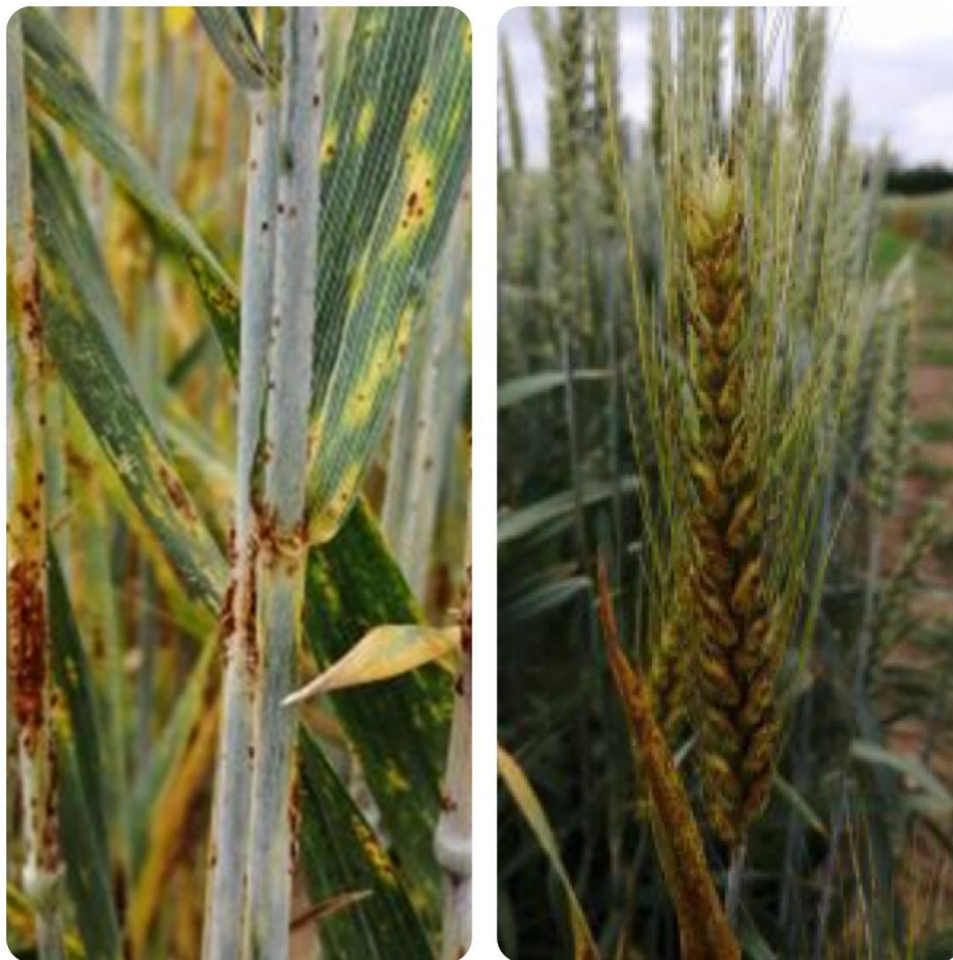
Obrázek 5: Příznaky travní rzi na stéblech a klasech (Hanzalová 2021b)

Jelikož se rez travní v České republice nevyskytuje pravidelně, odolné odrůdy nebyly pro registraci preferovány. V posledních několik letech se však výskyt rzi travní zvýšil napříč evropskými státy, Českou republiku nevyjímaje. Došlo k rozšíření nových ras Digalu a Clade V.–IV., což nejspíše povede ke škodám v příštích obdobích a získání pozornosti šlechtitelů (Hanzalová 2021a).