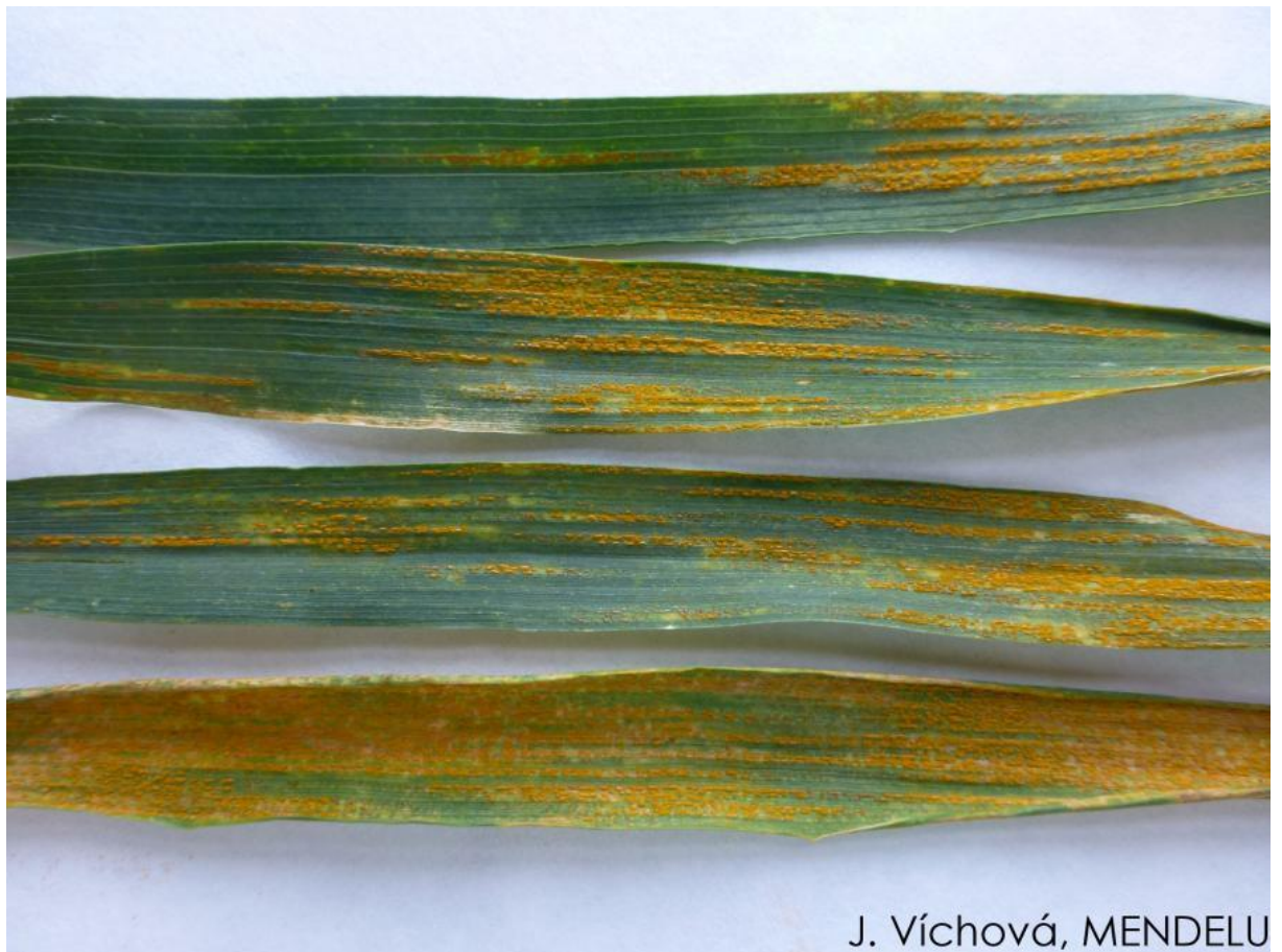
Obrázek 4: Napadení praporcového listu plevovou rzí (Víchová 2022)

V Puccinia striiformis rozeznáváme čtyři linie: Puccinia striiformis sensu stricto , Puccinia pseudostriformis , Puccinia striiformoides a Puccinia gansensis . V těchto liniích existuje mnoho různých ras rzi plevové. Na přelomu tohoto tisíciletí byly identifikovány tři nové agresivní rasy Warrior , Kranich a Triticale aggressive . Rasy jsou specifické kratší latentní periodou, prodlouženým klíčením spor a odolností k vyšším teplotám oproti rasám známým před rokem 2000 (Feodorova-Fedotova & Bankina 2018).