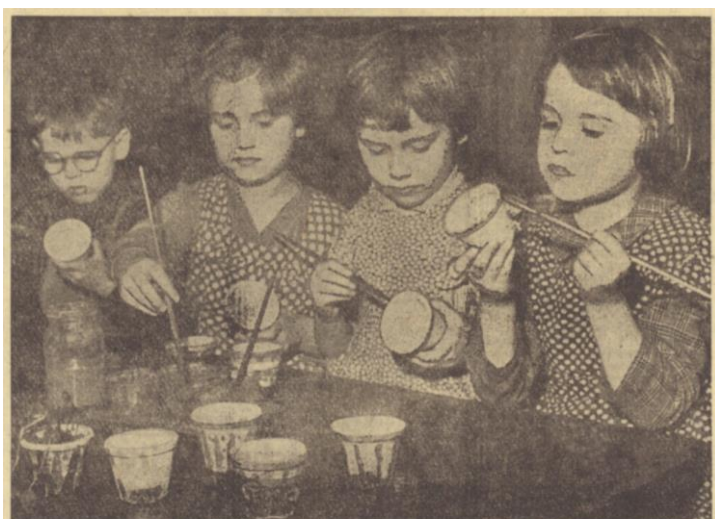
K Mezinárodnímu dni žen připravovaly děti v 21. mateřské škole v Karlíně pro své maminky malované květináče, které jim předají s květinami.