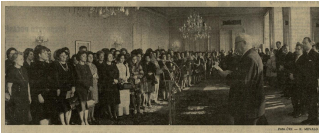
Příloha 15: Ženy u prezidenta L. Svobody na Pražském hradě na titulní straně; RP, 8. března 1972