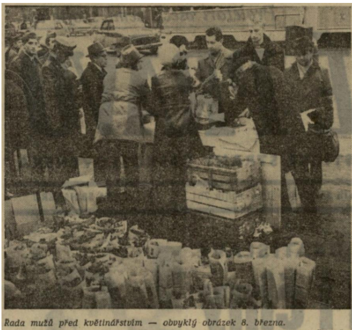
Rada mužů před květinářstvem — obvyklý obrázek 8. března.

Příloha 17: Muži kupující ženám kytku k MDŽ. Druhá strana Rudého práva; RP, 9. března 1972.