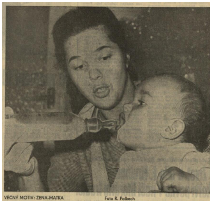
VEČNÝ MOTIV: ŽENA-MATKA