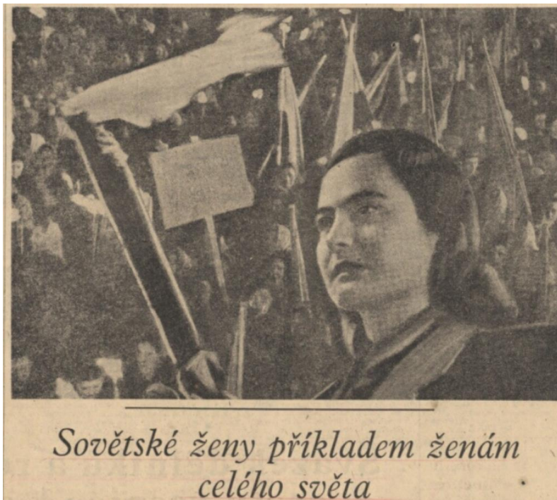
Příloha 2: Ženy – bojovnice na třetí straně Rudého práva; RP, 8. března 1950