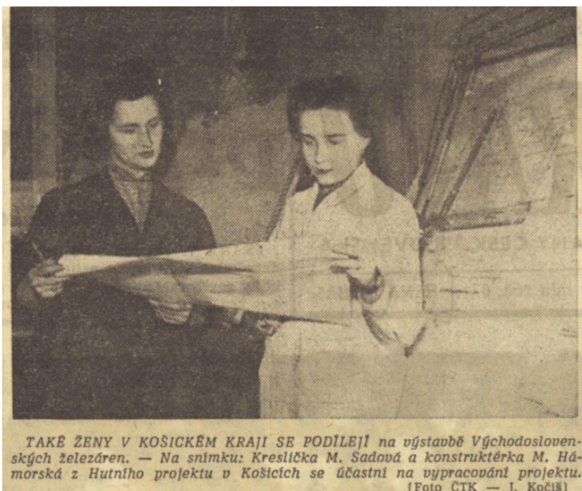
Příloha 10: Kreslička a konstruktérka výstavby železáren. Druhá strana Rudého práva; RP, 8. března 1960