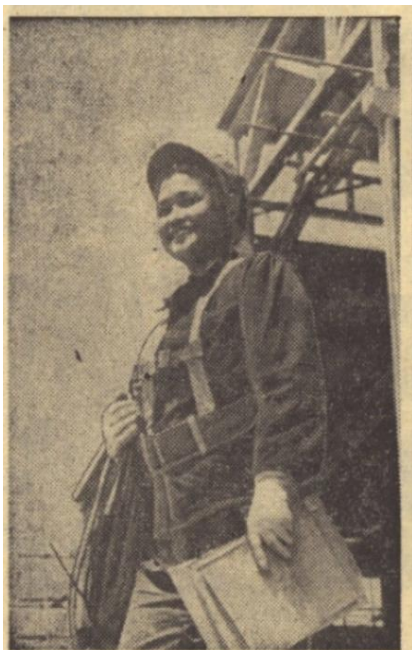
Stále více žen se zúčastňuje výstavby velkých čínských průmyslových středisek. Osmnáctiletá korejská dívka Pu Ču Čieh přišla na stavbu velké ocelárny v Paotichou z korejské autonomní oblasti Jen-pien v provincii Ti-lin. Rychle si osvojila znalosti elektro-instalatérské a dnes pracuje jako vynikající montérka.