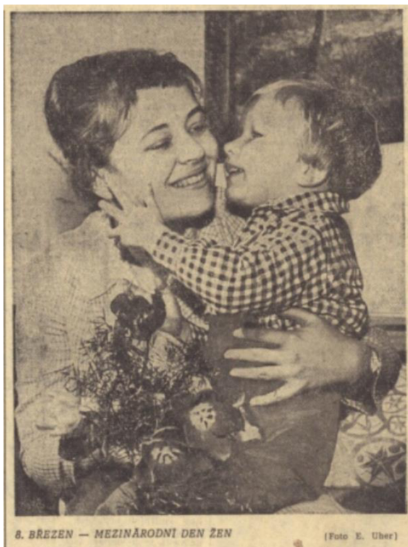
8. BŘEZEN — MEZINÁRODNÍ DEN ŽEN