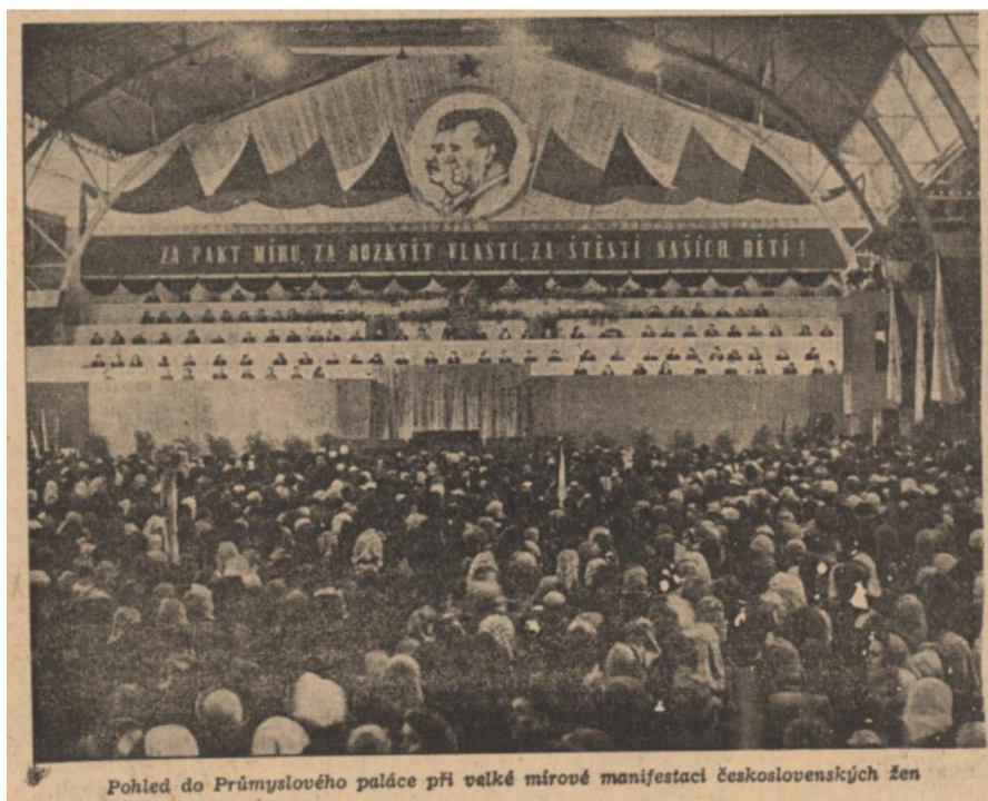
Příloha 5: Manifestace československých žen. Druhá strana Rudého práva; RP 8. března 1952