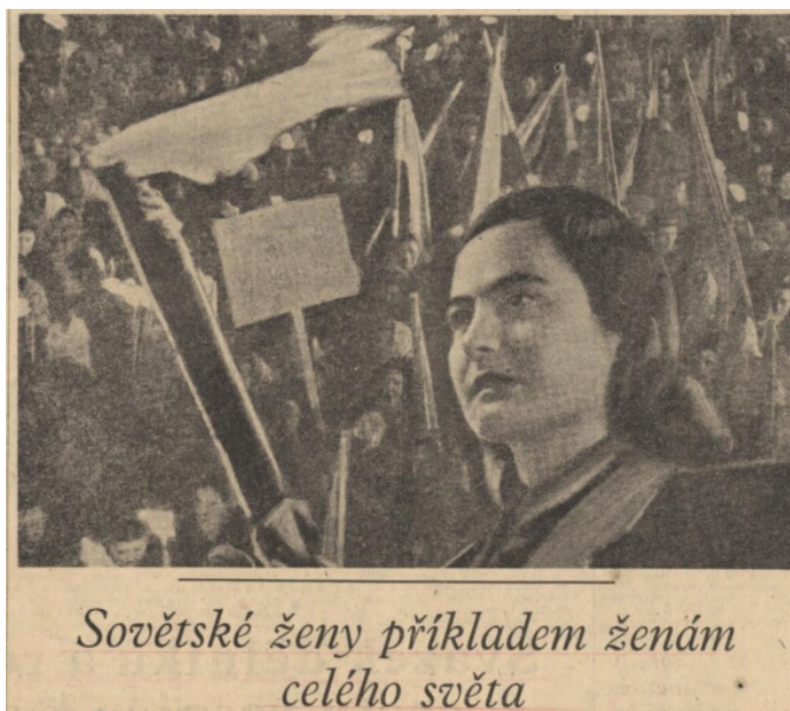
Příloha 2: Ženy – bojovnice na třetí straně Rudého práva; RP, 8. března 1950