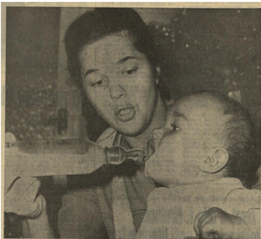
VEČNÝ MOTIV: ŽENA-MATKA