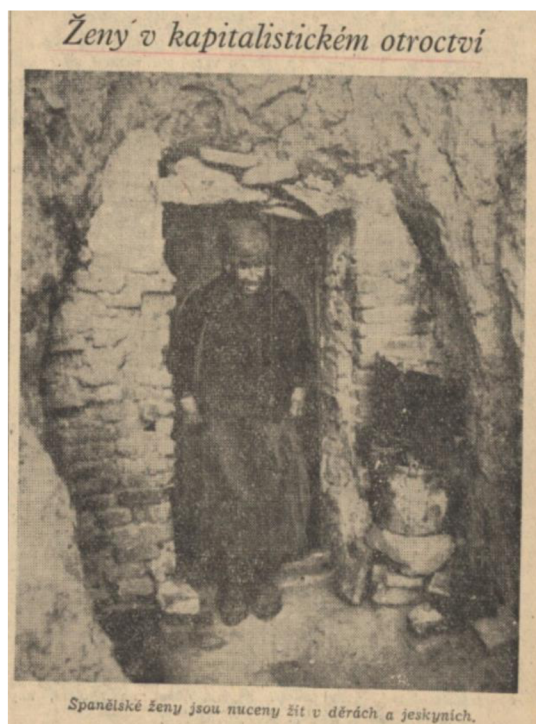
Příloha 3: Ženy v kapitalistickém otroctví. Třetí strana Rudého práva; RP, 8. března 1950.