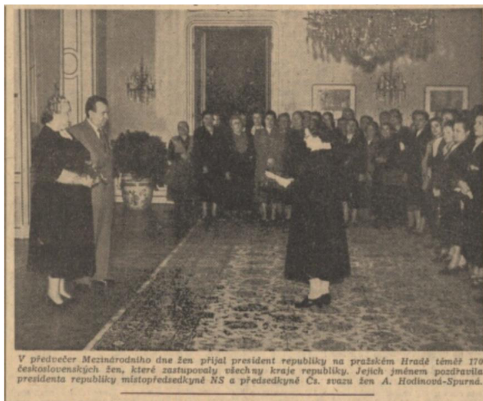
Příloha 4: Vybrané ženy na návštěvě u prezidenta na Pražském hradě na titulní straně; RP, 8. března 1951