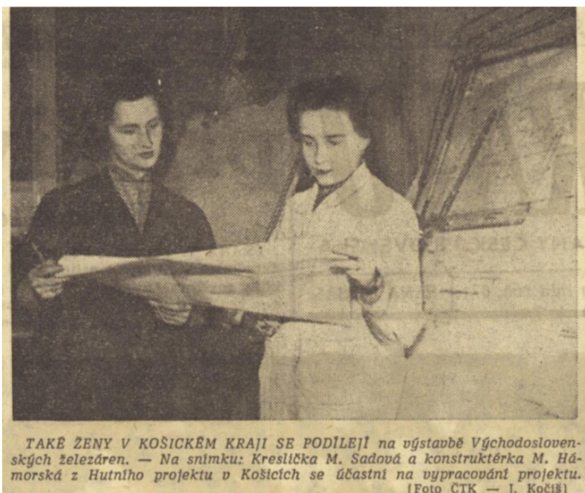
Příloha 10: Kreslička a konstruktérka výstavby železáren. Druhá strana Rudého práva; RP, 8. března 1960