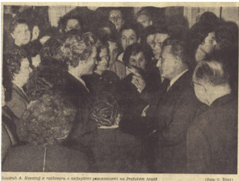
Příloha 9: Vybrané ženy u prezidenta A. Novotného na Pražském hradě na titulní straně Rudého práva; RP, 8. března 1960