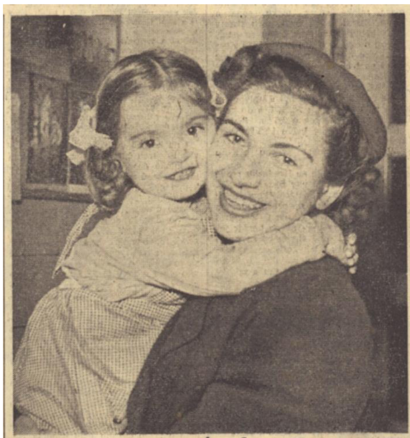
Příloha 6: Žena – matka na titulní straně; RP, 8. března 1958