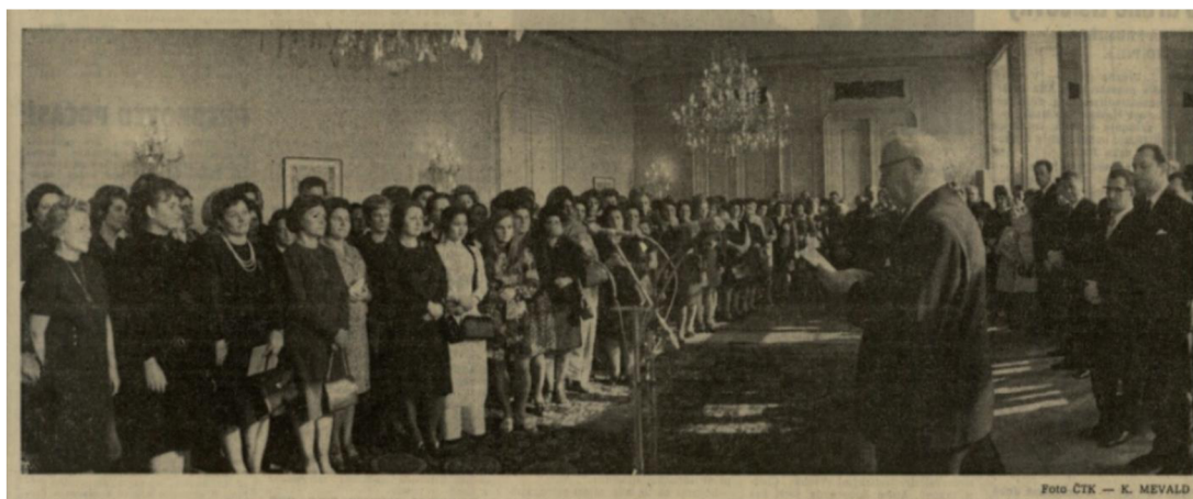
Příloha 15: Ženy u prezidenta L. Svobody na Pražském hradě na titulní straně; RP, 8. března 1972