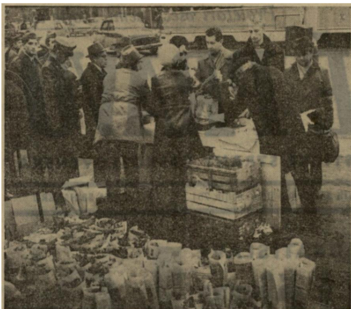
Rada mužů před květinářstvem — obvyklý obrázek 8. března.

Příloha 17: Muži kupující ženám kytku k MDŽ. Druhá strana Rudého práva; RP, 9. března 1972.