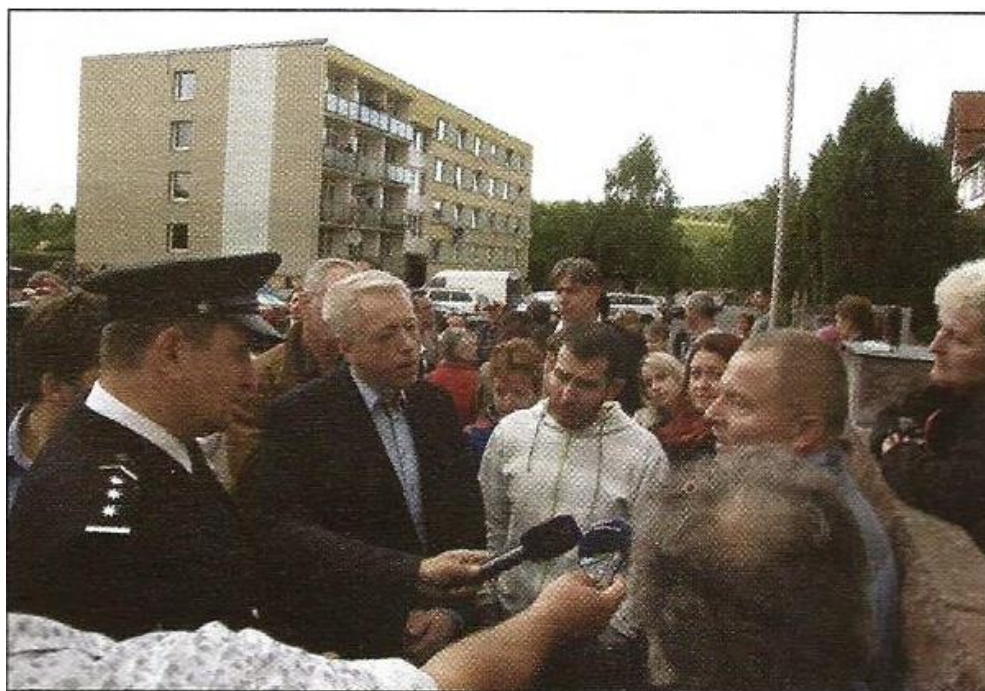
Foto: HAVLÍČEK, M. Tři ministři na severu. Bude to co platné? Hlas severu, 2014, č. 11, s. 1, 3.