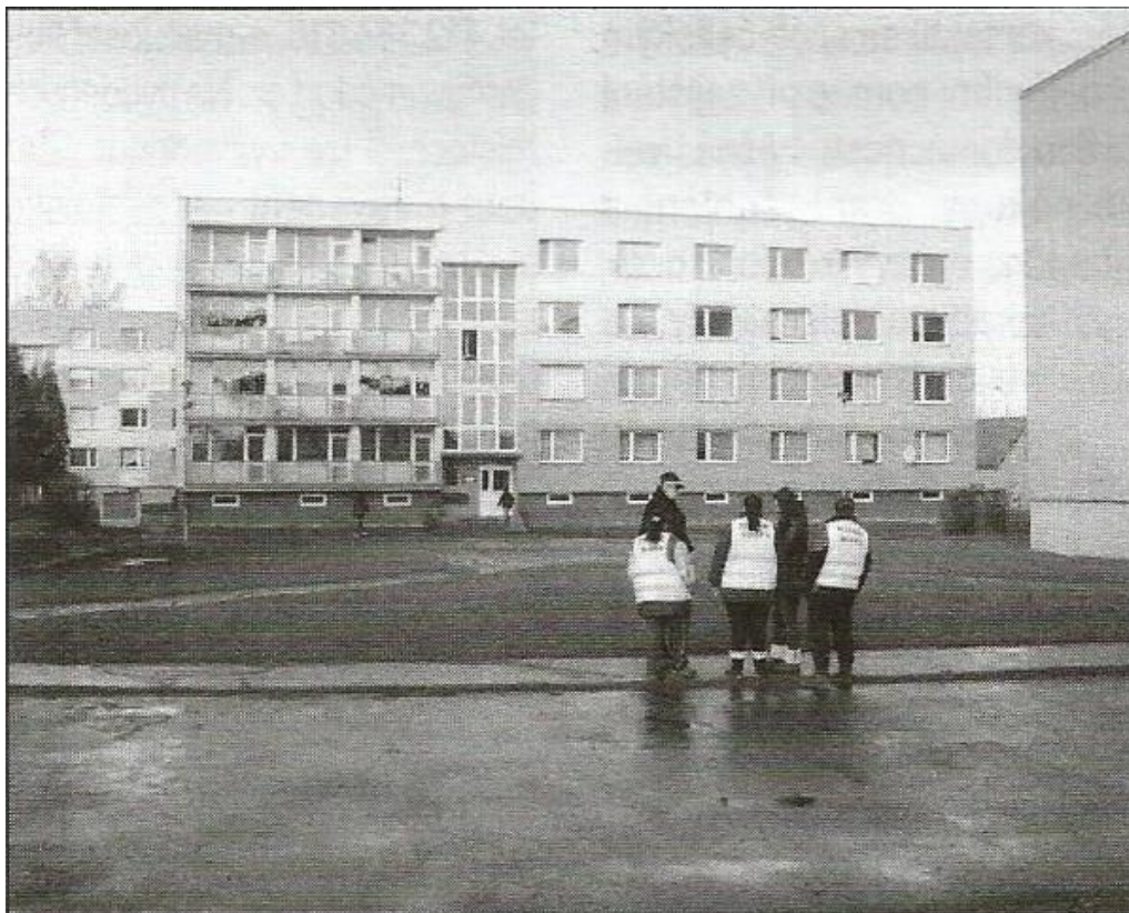
Foto: HALLER, M. Čtyři paneláky v Kovářské a Žitavské jsou pod kamerami. Hlas severu, 2015, č. 8, s. 4.