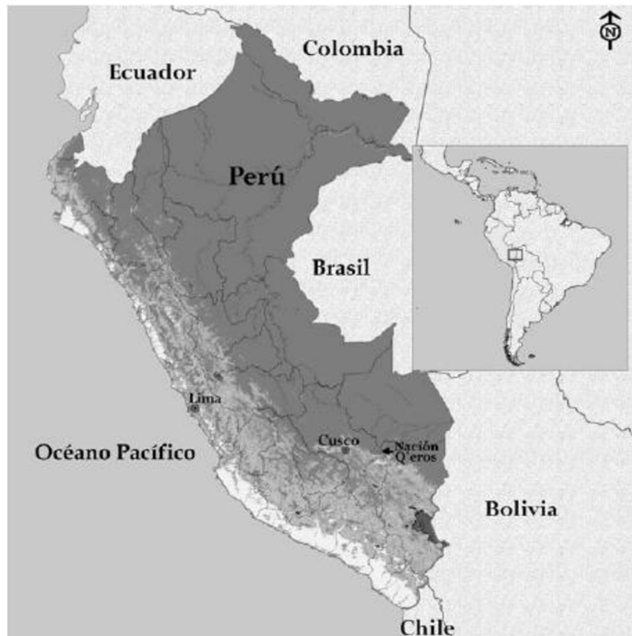
Imagen 1: “Ubicación de la Nación Q'eros” 15

Los Q'eros ponen énfasis en honrar las tradiciones, sobre todo en cuanto a los acuerdos mutuos que son basados en la reciprocidad y constituyen un apoyo esencial para el funcionamiento de un pueblo. Ellos mismos explican este concepto con el dicho, “dar para recibir, ayudar para ser ayudado”. 14 Este valor garantiza que, idealmente, todos vivan en las mismas condiciones y que nadie deba elevarse por encima del otro. Así evitan cualquier litigio y mantienen buenas relaciones y respeto.