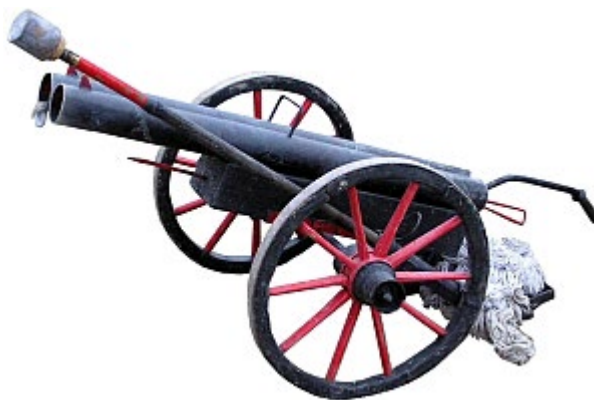
Dělo doulebských dělostřelců