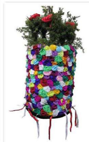
Klobouk mládenecké koledy