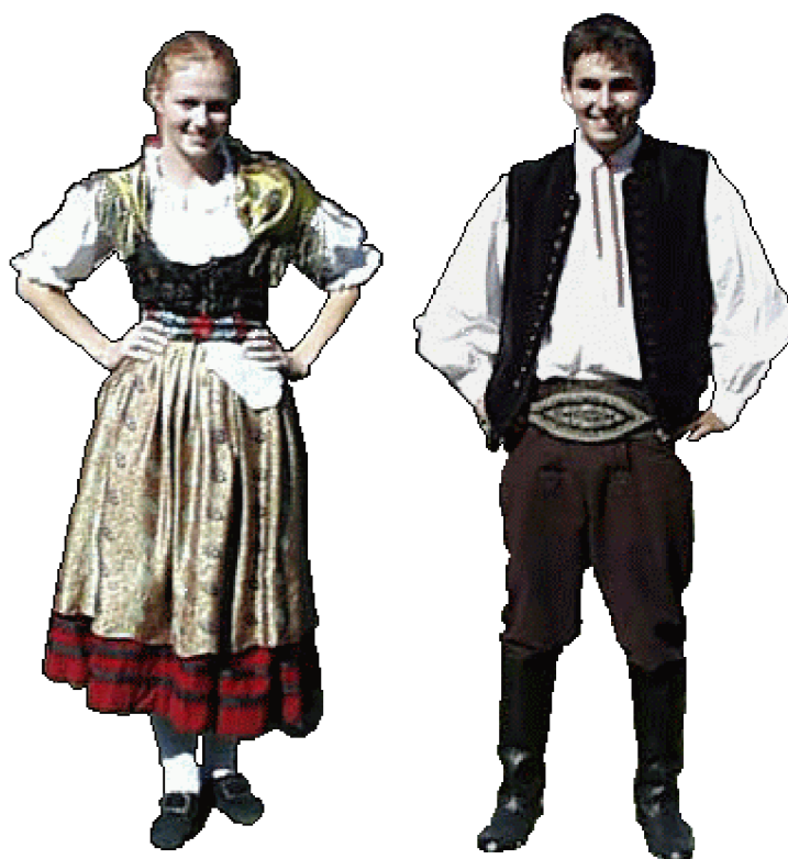
Ženský doudlebský kroj, který nosily mladé dívky v letních měsících a mužský doudlebský kroj nošený v letním období