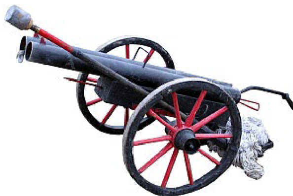
Dělo doulebských dělostřelců