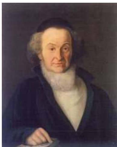
Obrázek 7: Mordechaj Maisel