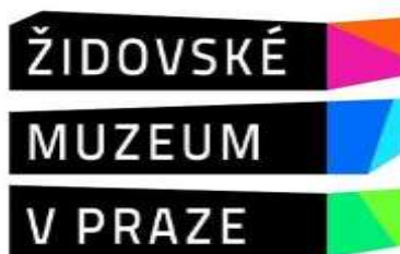
Obrázek 5: Logo židovského muzea v Praze

Další obsahově bohatou stránkou je Jewishmuseum.cz, stránka Židovského muzea v Praze. Kromě základních informací o muzeu a knihovně se návštěvníci mohou dočíst o stálých expozicích, které se nacházejí v Židovském muzeu v Praze. V současné době jsou vystaveny tyto stálé expozice – Židé v českých zemích od 10.-18. století, Dějiny židů v Čechách a na Moravě od 19.-20. století, Stříbro českých synagog, Židovské tradice a zvyky I, Židovské tradice a zvyky II, Památník českých a moravských obětí šoa a Dětské kresby z Terezína 1942-1944. Velmi rozsáhle jsou popsány židovské památky, kde se pořádají prohlídky pro návštěvníky. Nyní je možné navštívit Maiselovu synagogu, která byla dlouho uzavřena z důvodu rekonstrukce. Dále Španělskou synagogu, Klausovu synagogu, Obřadní síň, Pinkasovu synagogu na Starém židovském hřbitově a galerii Roberta Guttmanna, kde se pořádají prezentace uměleckých a muzejních sbírek. Na stránkách je k dispozici online židovský slovník, kde si každý návštěvník může vyhledat vysvětlení toho či ono pojmu.