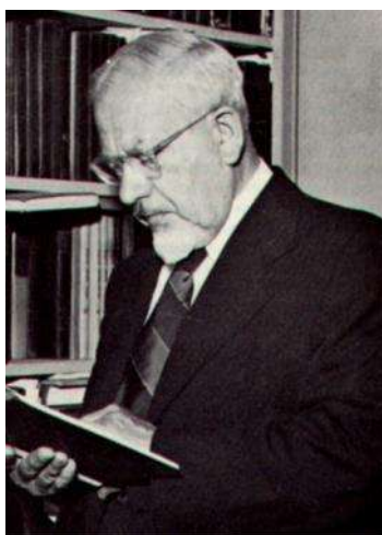
Obrázek 1: Mordechaj Menach Kaplan

Rekonstrukcionalismus vznikl ve 20. letech minulého století v USA a založil jej rabín Mordechaj Kaplan, který ačkoliv pocházel z ortodoxní rodiny, měl vizi judaismu spjatou víc s kulturou než s věroukou a židovskými praktikami. Kaplan odsuzoval představu vševědoucího Boha, který skrze Abrahama uzavřel s Židy smlouvu a dal svému lidu věčné zákony Tóry. 18