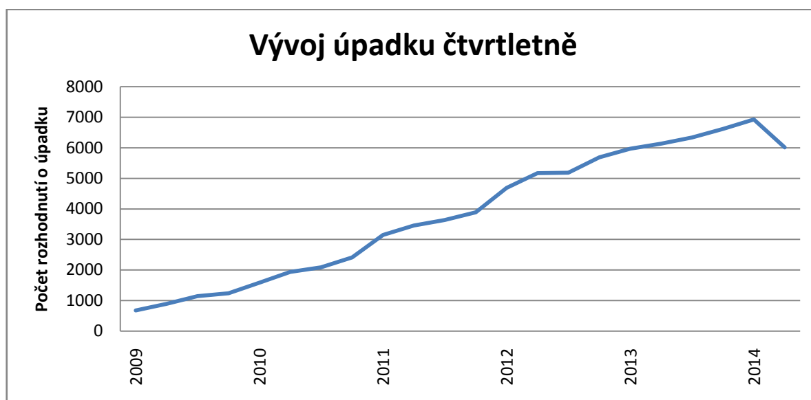
Graf 3: Vývoj úpadku čtvrtletně