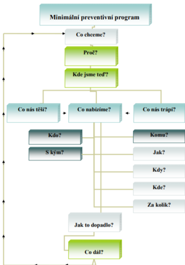
Obrázek č. 1: Pomůcka k tvorbě minimálního preventivního programu.

Při tvorbě MPP se informace čerpají z dostupných vnitřních a vnějších zdrojů školy. Celková logická struktura tvorby MPP, z níž je zřejmý postup s dílčími otázkami, na které bychom měli být schopni v určitých fázích odpovědět, to vše je znázorněno na uvedeném obrázku níže (Miovský a kol.,2012).