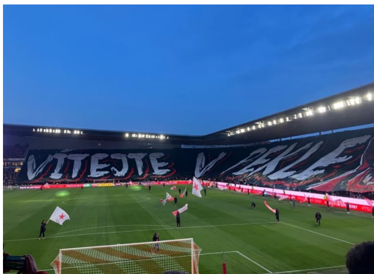
Obrázek 3 - Transparent přes Tribunu Sever a Tribunu Východ

tělesnosti byli na rozdíl od těchto dvou zmíněných opakujícími se rituály. Jednalo se o tleskání a zpívání chórů, skákání a hvízdání.