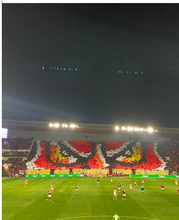
Obrázek 2 - Zobrazení tygra na Tribuně Sever