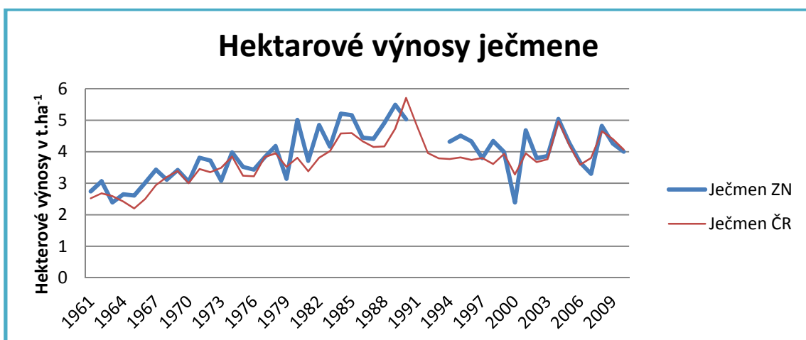
Obrázek č. 2 Vývoj hektarových výnosů ječmene t.ha -1