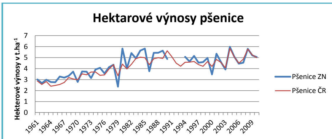
Obrázek č. 1 Vývoj hektarových výnosů pšenice t.ha -1