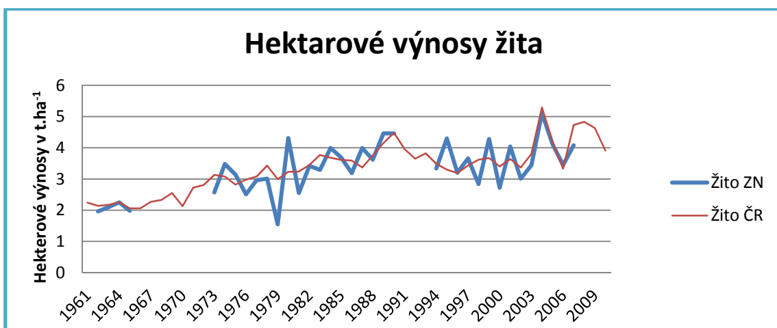
Obrázek č. 3 Vývoj hektarových výnosů žita t.ha -1