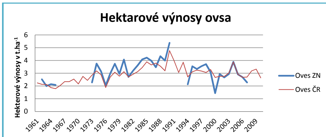
Obrázek č. 4 Vývoj hektarových výnosů ovsa t.ha -1