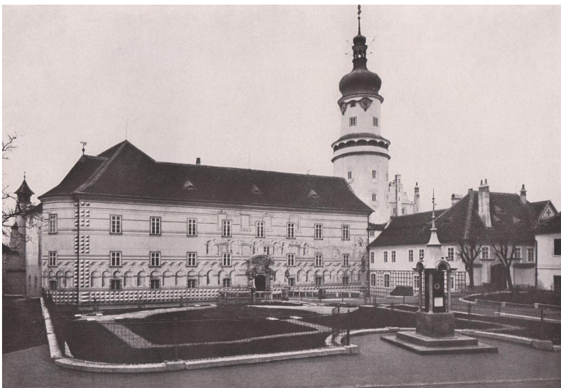
Zámek v Novém Městě nad Metují po Jurkovičově přestavbě (okolo roku 1913) 602