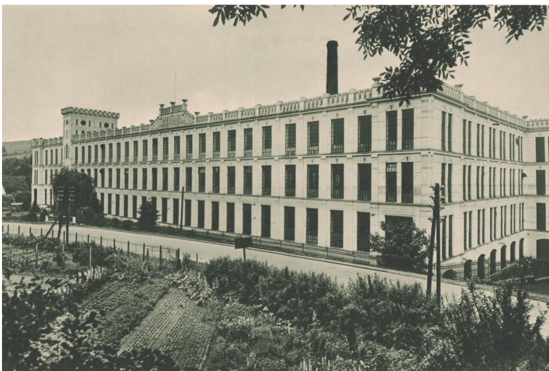
Přádelna firmy Josef Bartoň a synové v Náchodě – Starém Městě nad Metují (nedatováno, 20.–30. léta) 601