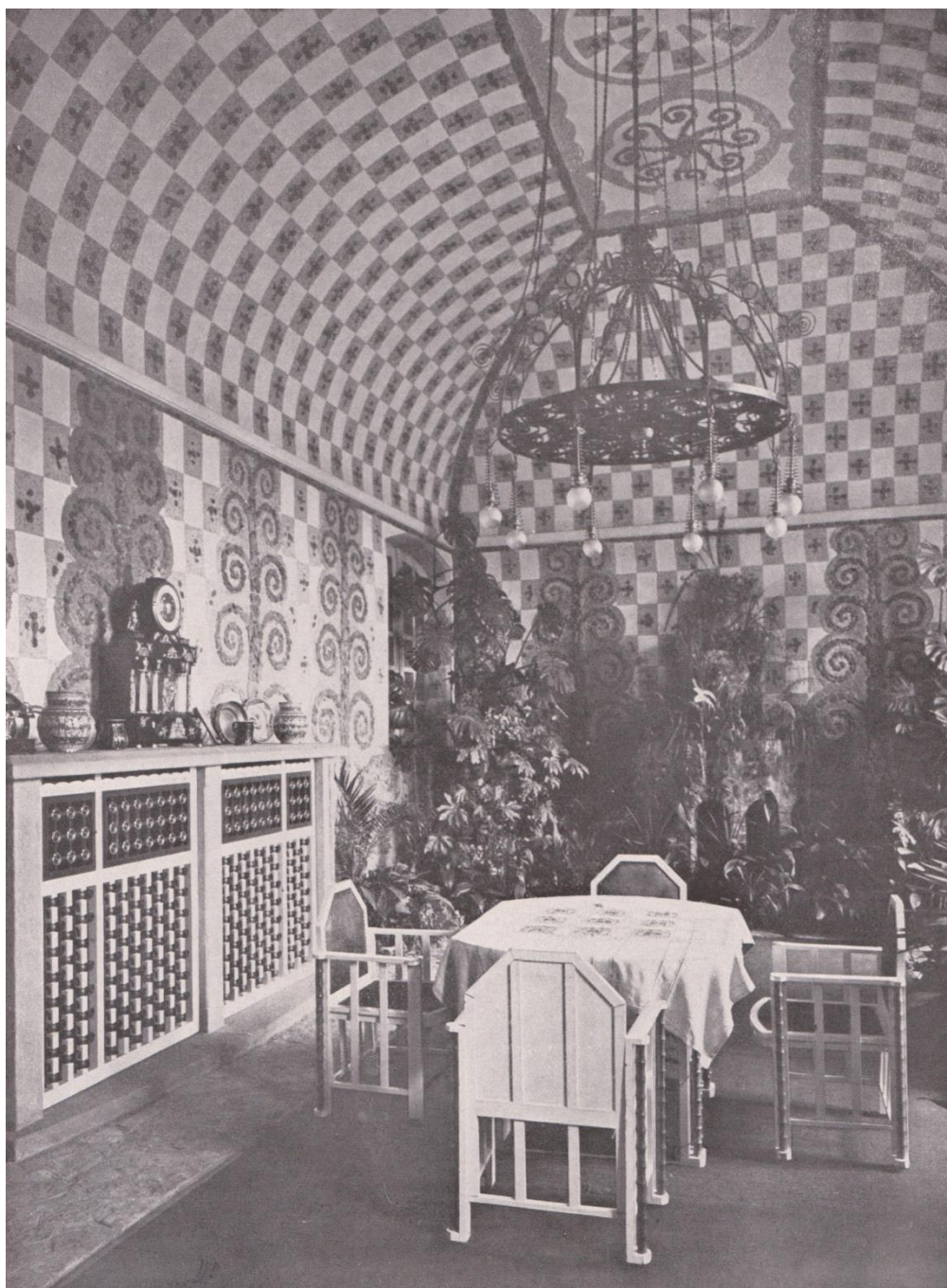
Zimní zahrada zámku v Novém Městě nad Metují (1909) 603