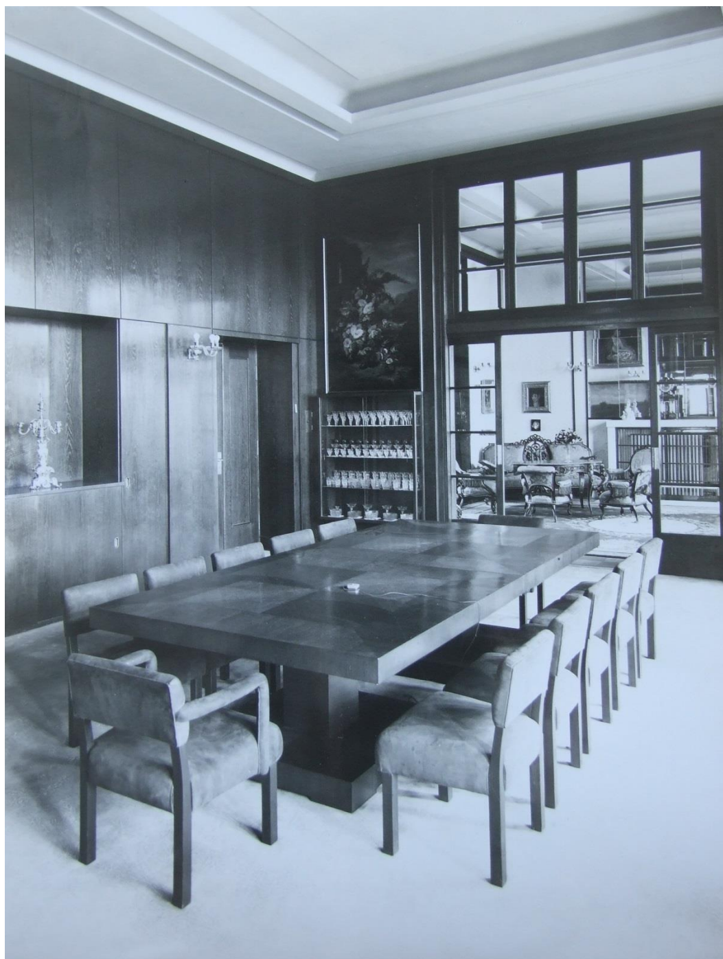
Jídlna se salonem ve vile Petrův dvůr (30. léta) 606