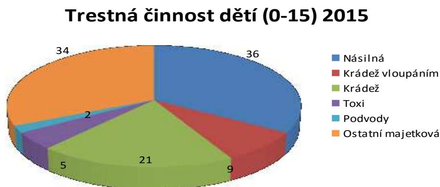
Graf číslo 1 - Grafické zpracování statistických údajů vybrané kriminality dětí. (byly použity údaje z elektronického vnitřního informačního systému Policie České republiky)