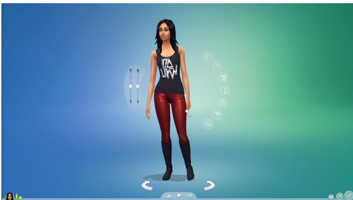
The Sims4, 2014, Vydavatelé: Electronic Arts, Vývojáři: Maxis, Screenshot ze hry (17.04.2023).