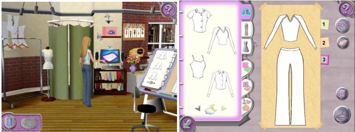
Barbie Fashion Show, 2004, Vydavatelé: Vivendi Universal, Vývojáři: Vivendi Universal, Screenshot ze hry (17.04.2023).

"The Charlton's Fashion Academy" je videohra o módě, která vyšla v roce 2007. Ve hře hráči jsou studenty módní akademie. Hráči si mohou navrhnout oblečení pomocí nástrojů ve hře. Vybírají látky, barvy, vzory a styly. Jsou posuzováni podle toho, jak dobře oblečení navrhnu, protože je to součástí vzdělávání postavy. Příběh a oblečení spolu tematicky nesouvisí, ale navzájem jsou propojené hodnotícím systémem.