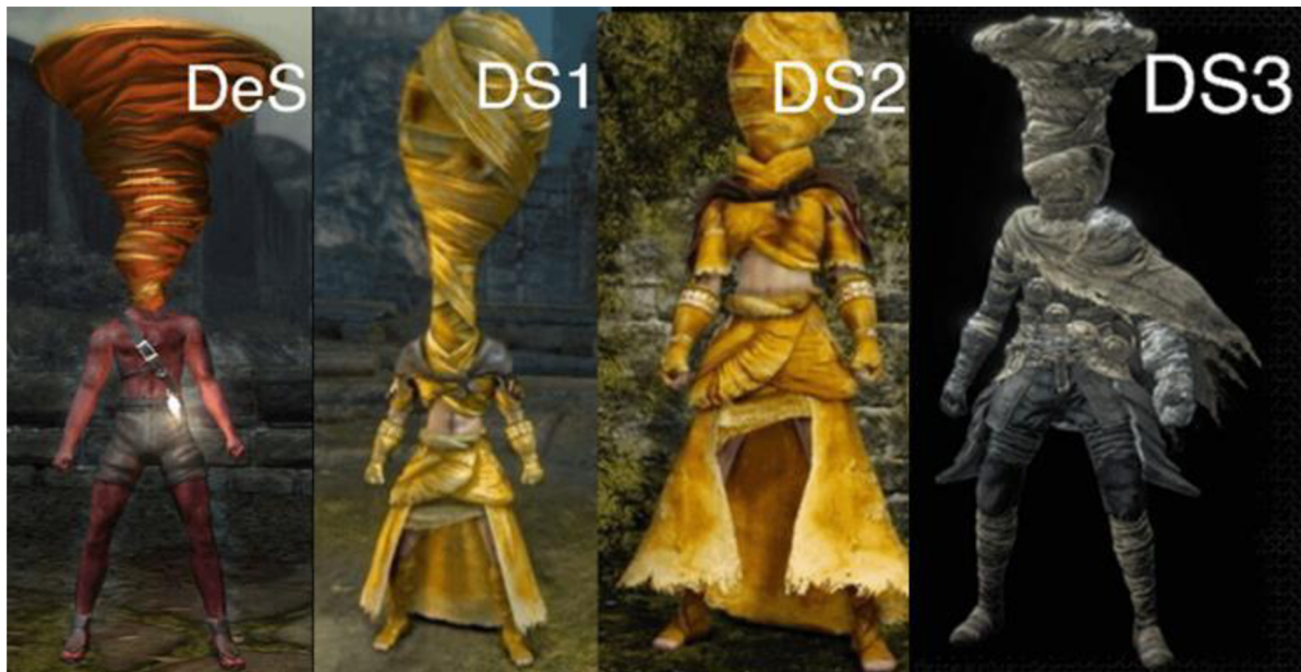
Porovnání oblečení postavy v různých hrách sérii: Demon Souls, Dark Souls1, Dark Souls2, Dark Souls3.