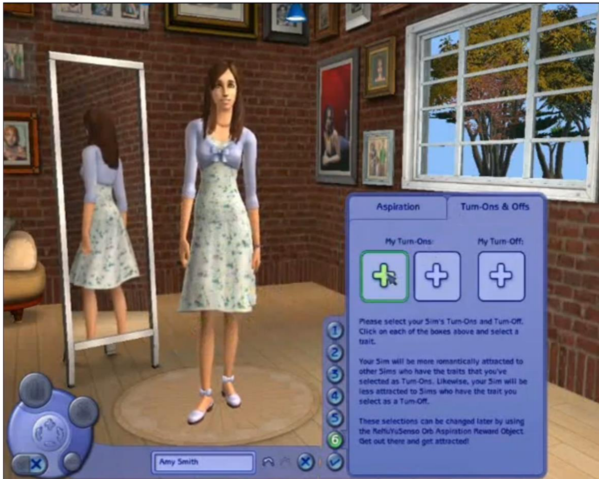
The Sims2, 2004, Vydavatelé: Electronic Arts, Vývojáři: Maxis Emeryville, Screenshot ze hry (17.04.2023).

Je důležité, aby možnosti oblečení ve hře měly smysluplný dopad i na hru. Některé oblečení může poskytovat bonusy nebo postihy za dovednosti, ovlivňovat náladu nebo sociální interakce. Kromě toho může oblečení ovlivnit osobnost nebo jejich profesní dráhu spolu s pracovním výkonem.