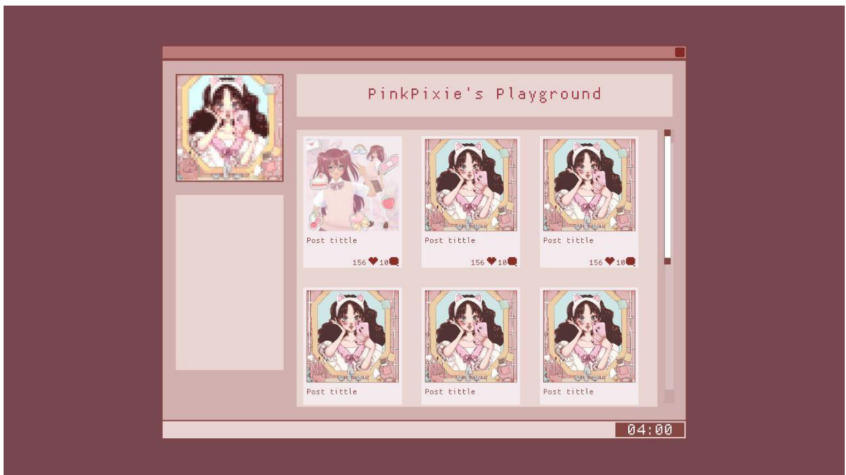
Základní interface prototypu: Blog je fiktivním rozhraním sociálních sítí. screenshot, 2024