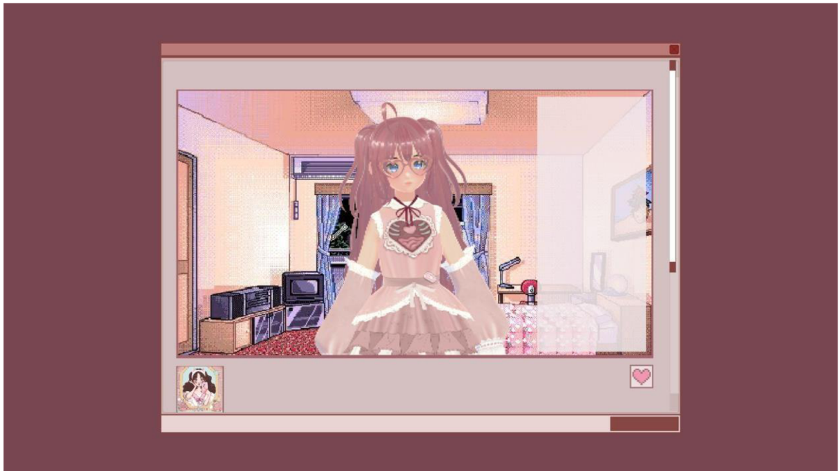
Základní interface prototypu: stream je fiktivním rozhraním streamovací platformy. screenshot, 2024