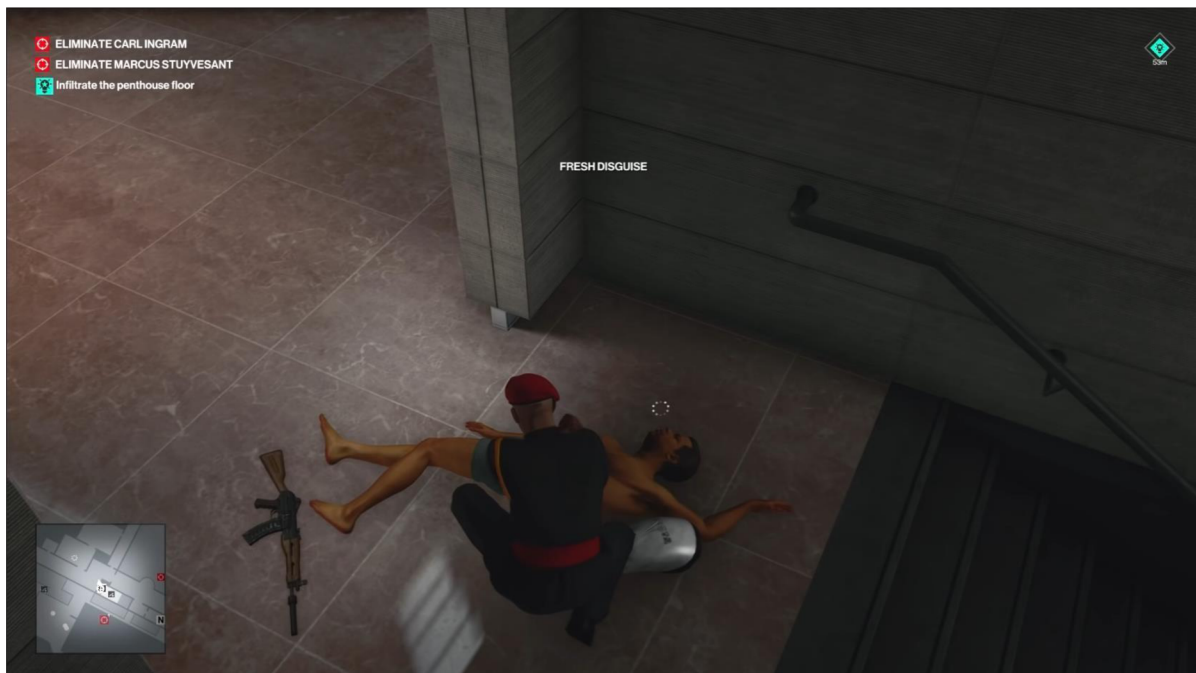
Hitman 3, 2021, Vydavatelé: IO Interactive, Vývojáři: IO Interactive, Screenshot ze hry (17.04.2023).

V Hitmanovi může agent 47 změnit svůj vzhled tím, že bude nosit oblečení jiných postav, které si podrobil nebo odstranil. Různé části hry mohou mít omezené oblasti, do kterých mohou vstoupit pouze někteří lidé, například zaměstnanci, bezpečnostní služba nebo VIP. Díky správnému přestrojení může agent 47 vstoupit do těchto oblastí, aniž by vyvolal podezření. Převleky obvykle fungují pouze ve specifických oblastech a s určitými postavami. Některé postavy jsou ostražitější než jiné, a proto je riskantnější nosit kolem sebe určité převleky. Výběr správného oblečení je důležitou součástí hry. Hráči si musí pečlivě naplánovat svůj přístup a efektivně používat převleky, aby splnili své cíle, aniž by byli chyceni.