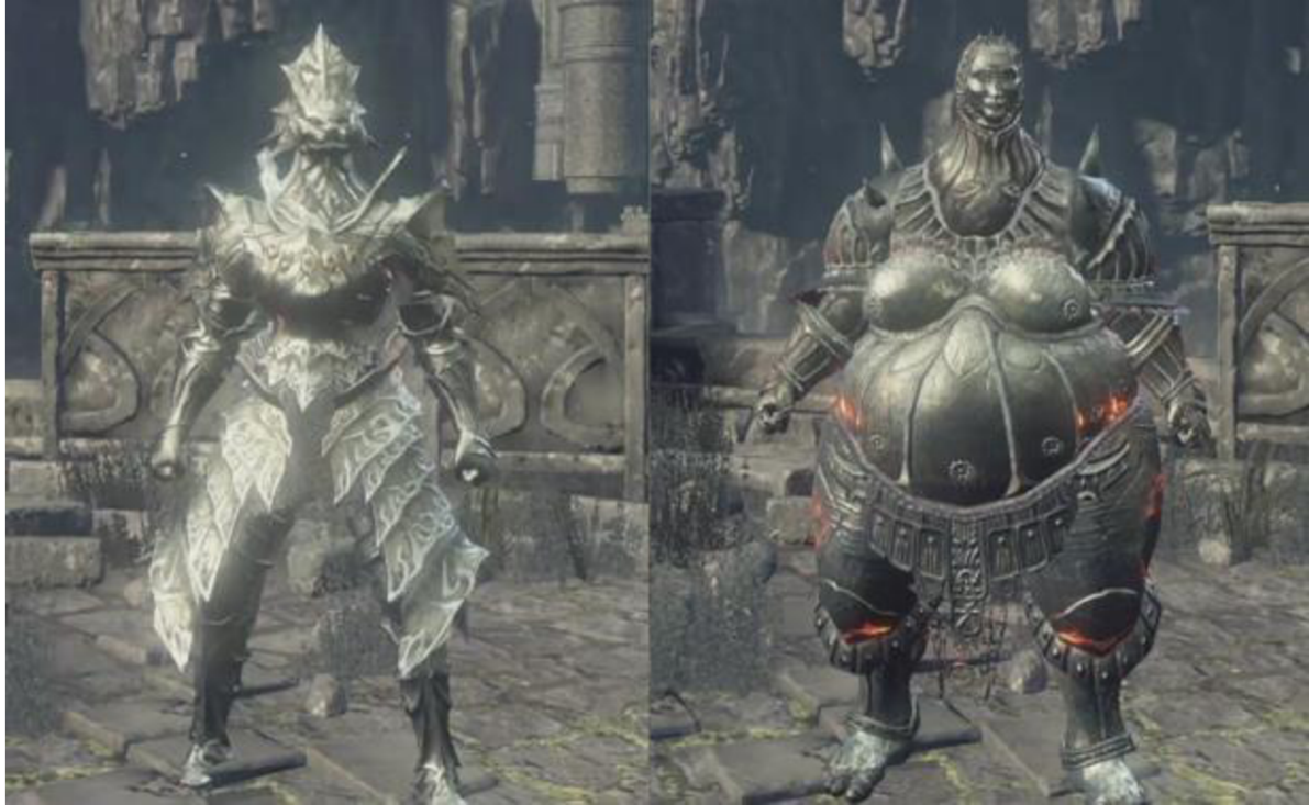
Dark Souls III, 2016, Vydavatelé: FromSoftware, Bandai Namco Entertainment, Vývojáři: From Software, Screenshot ze hry (17.04.2023).

nyní v troskách. Případně mohou představovat aroganci nebo marnivost určitých postav, které lpí na pozůstatcích bohatství a postavení tváří v tvář blížící se zkáze. Celkově řečeno, módní aspekty v těchto hrách přinášejí hloubku a bohatství do herního světa a dávají hráčům vhled do jeho rozmanité historie a kultury.