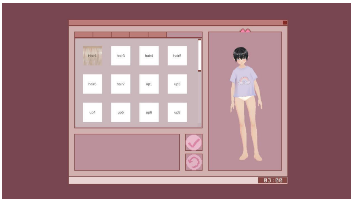
Základní interface prototypu: V šatníku budou hráči mít možnost vybírat mezi různými kusy oblečení pro svou postavu. screenshot, 2024