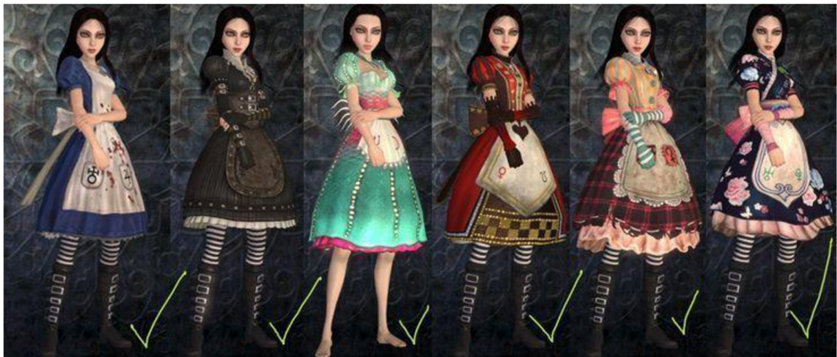
Alice: Madness Returns, 2011, Vydavatelé: Electronic Arts, Vývojáři: Spicy Horse, Screenshot ze hry (17.04.2023).

Oblečení taky umožňuje hráčům přizpůsobit vzhled Alice. Během New game+ si mohou vybrat z různých šatů. Každé šaty poskytují Alici specifické schopnosti užitečné v boji nebo průzkumu. Strategický výběr správných šatů je zásadní, protože může pomoci při efektivním překonávání překážek nebo nepřátel.