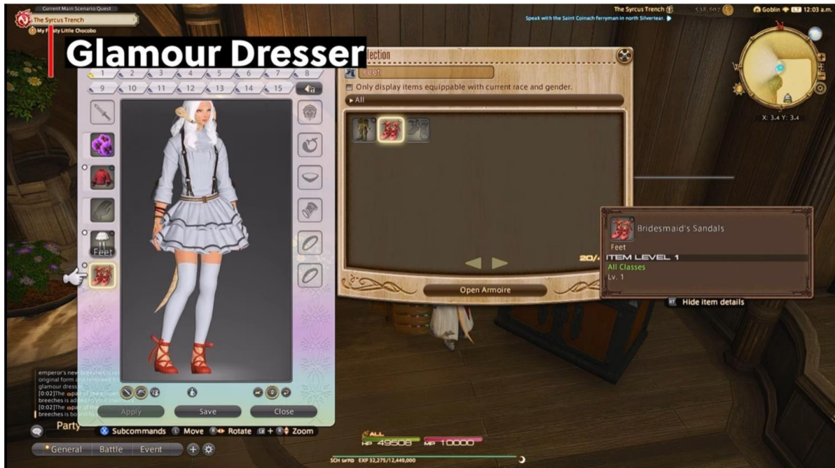
Final Fantasy XIV: A Realm Reborn, 2010, Vydavatelé: Square Enix, Vývojáři: Square Enix, Screenshot ze hry (17.04.2023).

svého vybavení tak, aby vyhovoval jejich preferencím. Ve hře probíhají speciální svatební ceremonie. Aby mohli hráči uspořádat svatbu, musí si koupit balíček „Ceremony of Eternal Bonding“ z interního obchodu. Tento balíček obsahuje svatební oblečení pro nevěstu a ženicha, které je formální a elegantní. Zatímco hosté nemusí mít na sobě konkrétní oblečení, formální oblékání je pro tuto příležitost obvyklé. I když hra nabízí široké možnosti pro úpravu vzhledu postav, chybí mechanismy, které by propojily estetiku s herními mechanikami.