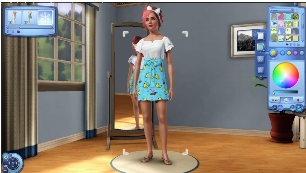
The Sims3, 2009, Vydavatelé: Electronic Arts, Vývojáři: Maxis, Screenshot ze hry (17.04.2023).