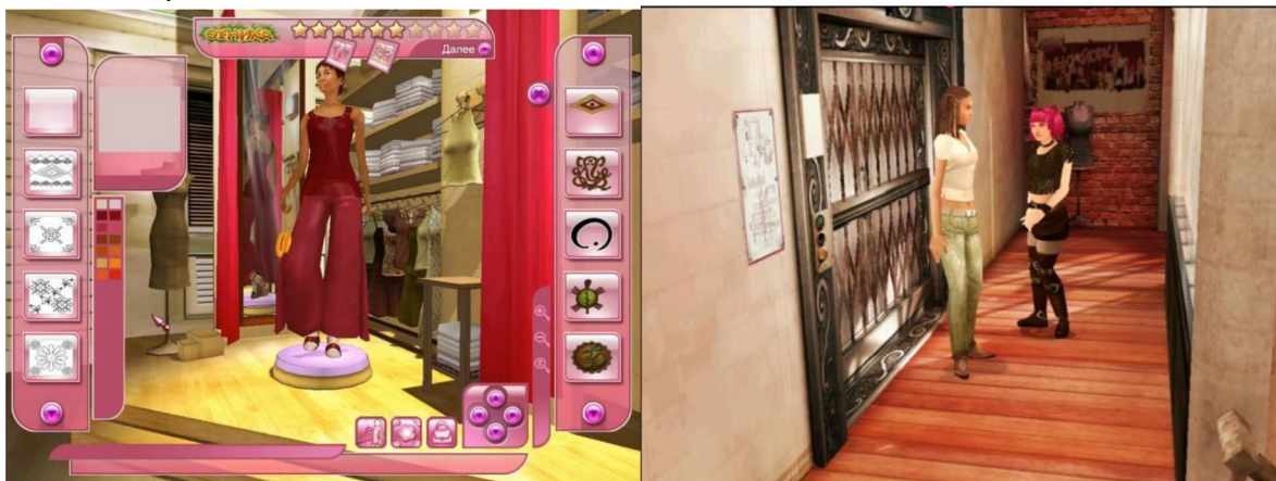
The Charlton's Fashion Academy, 2010, Vydavatelé: UBISOFT, Vývojáři: Mindscape, Screenshot ze hry (17.04.2023).

"The Charlton's Fashion Academy" je videohra o módě, která vyšla v roce 2007. Ve hře hráči jsou studenty módní akademie. Hráči si mohou navrhnout oblečení pomocí nástrojů ve hře. Vybírají látky, barvy, vzory a styly. Jsou posuzováni podle toho, jak dobře oblečení navrhnu, protože je to součástí vzdělávání postavy. Příběh a oblečení spolu tematicky nesouvisí, ale navzájem jsou propojené hodnotícím systémem.