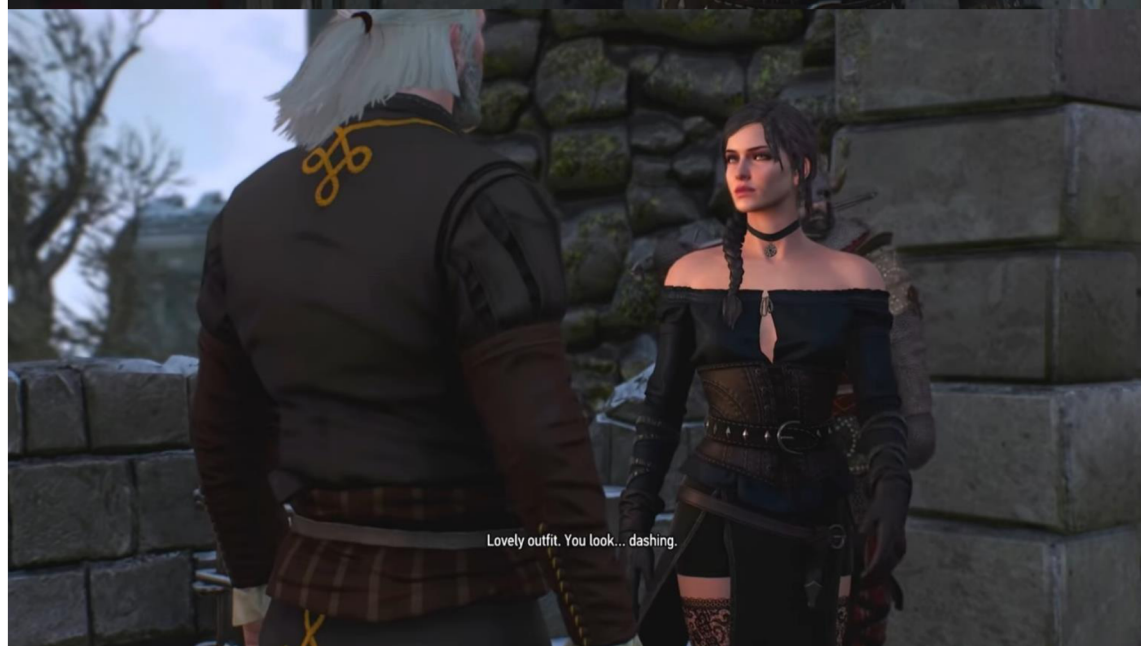
The Witcher 3: Wild Hunt, 2015, Vydavatelé: CD PROJEKT RED, Vývojáři: CD PROJEKT RED, Screenshot ze hry (17.04.2023).