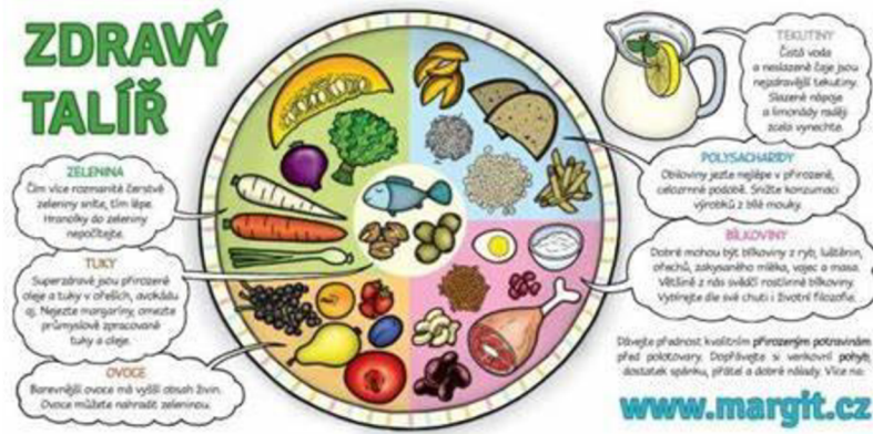
Obrázek 3 Zdravý talíř (Slimáková, 2012)