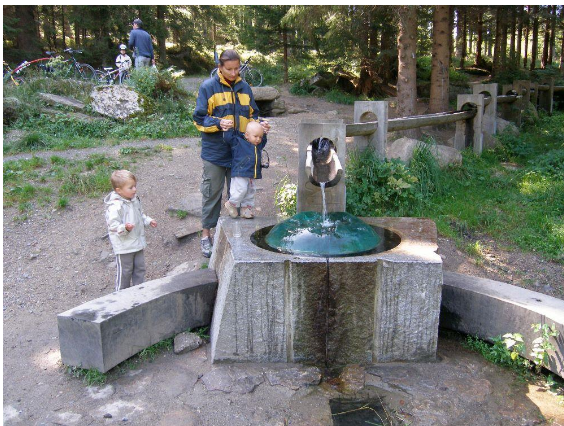
Obrázek 7: Pramen u Hauswaldské kaple – rodina na cyklistickém výletu

Používaný materiál této umělkyně navazuje na slavnou tradici sklářství v tomto kraji. O Hauswaldské kapli, jejíž první stavba pochází z roku 1820, se ve své povídce Prázdniny na Šumavě zmiňuje i nejznámější šumavský spisovatel Karel Klostermann (1848 – 1923). Poslední třetí stavba Hauswaldské kaple byla odstřelena v roce 1957.