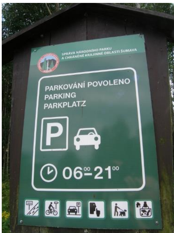
Obrázek 3: Parkoviště „Zaparkuj a jdi dál“ pro návštěvníky Chalupské slati