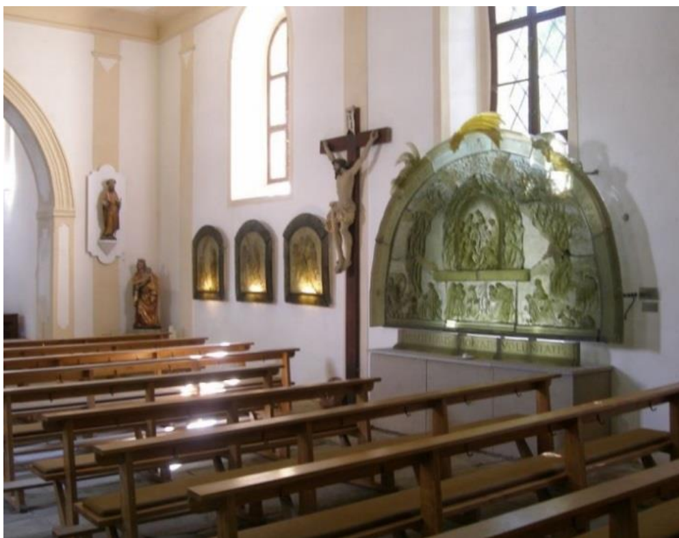
Obrázek 6: Dobrá Voda, interiér kostela sv. Vintíře