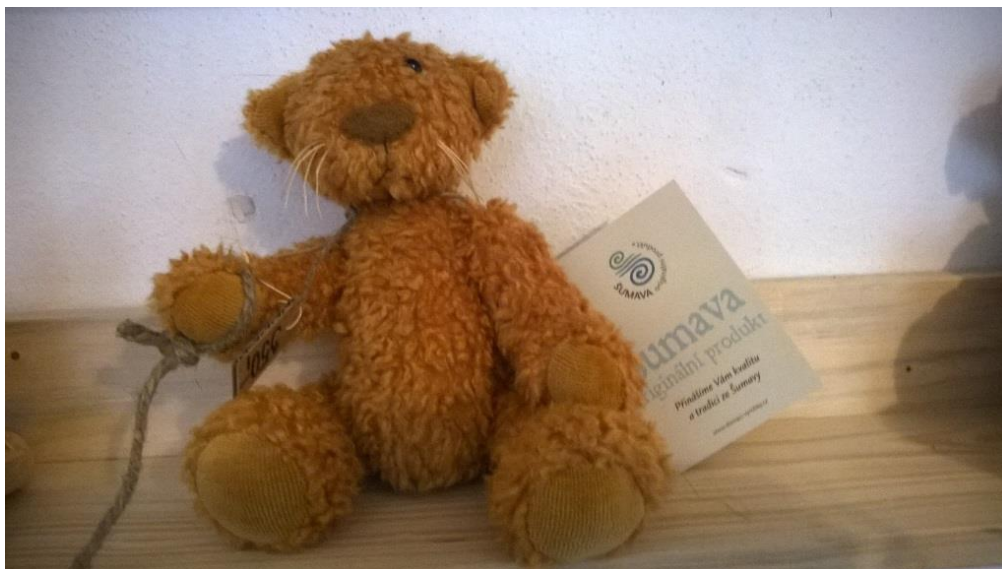
Obrázek 5: Ruční výrobek s certifikátem originální produkt z výstavy v Srní (3. 8. 2014)