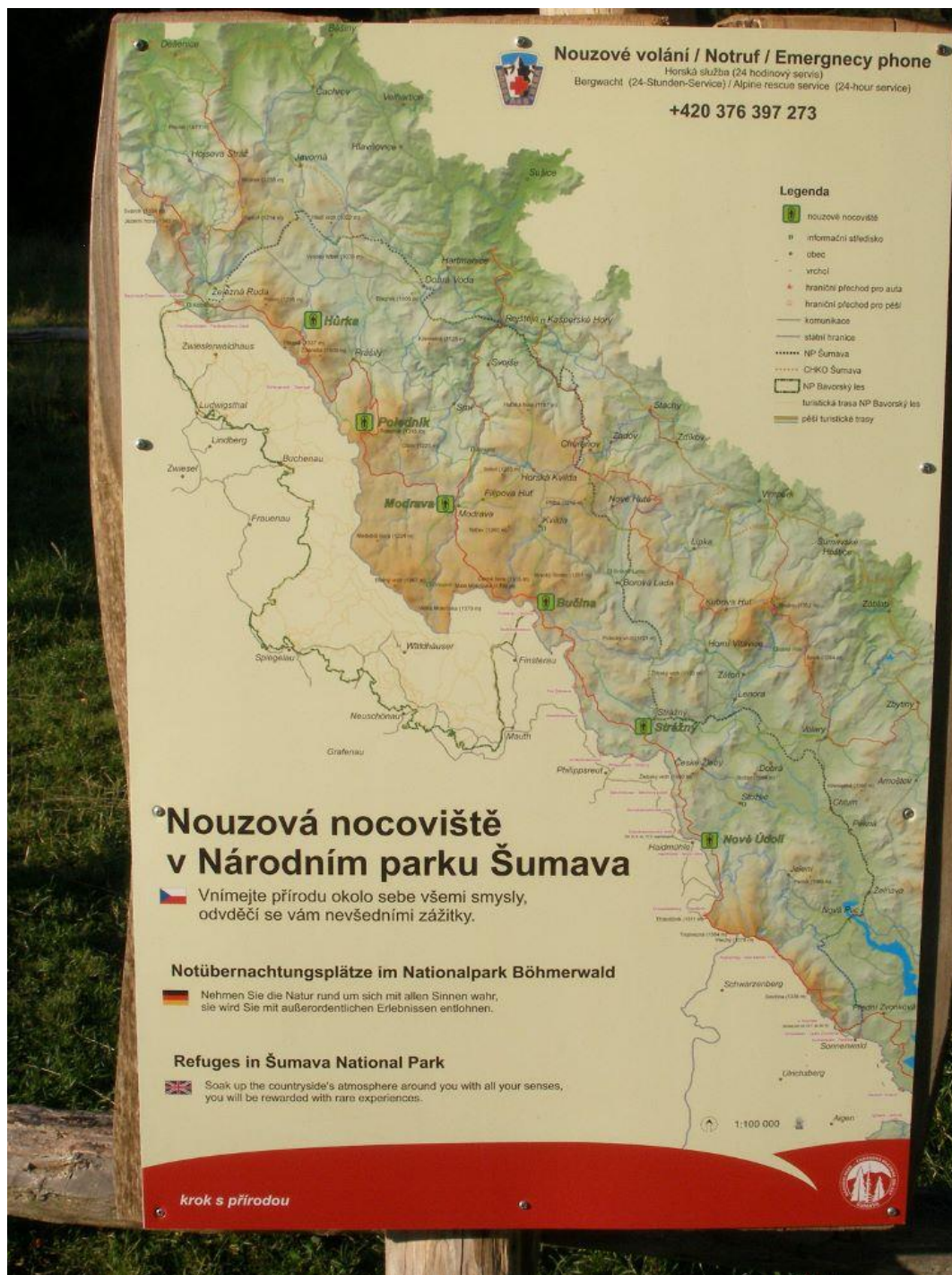
Obrázek 4: Informační tabule nouzového nocoviště Bučina

rozdělávat oheň, svoje odpadky by si měli návštěvníci odnést s sebou, v blízkosti bývá občas zdroj pitné vody a jsou zde i mobilní WC. 71