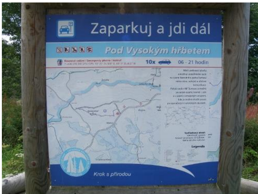
Obrázek. 2: Příklad informační tabule u parkoviště „Zaparkuj a jdi dál“ Pod Vysokým hřbetem

jednodenní výlet. Příklad označení parkoviště „Zaparkuj a jdi dál“ je na následujících obrázcích.