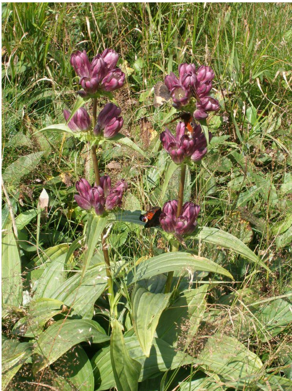
Obrázek 1: Hořec šumavský ( Gentiana pannonica ) ve Filipově Huti