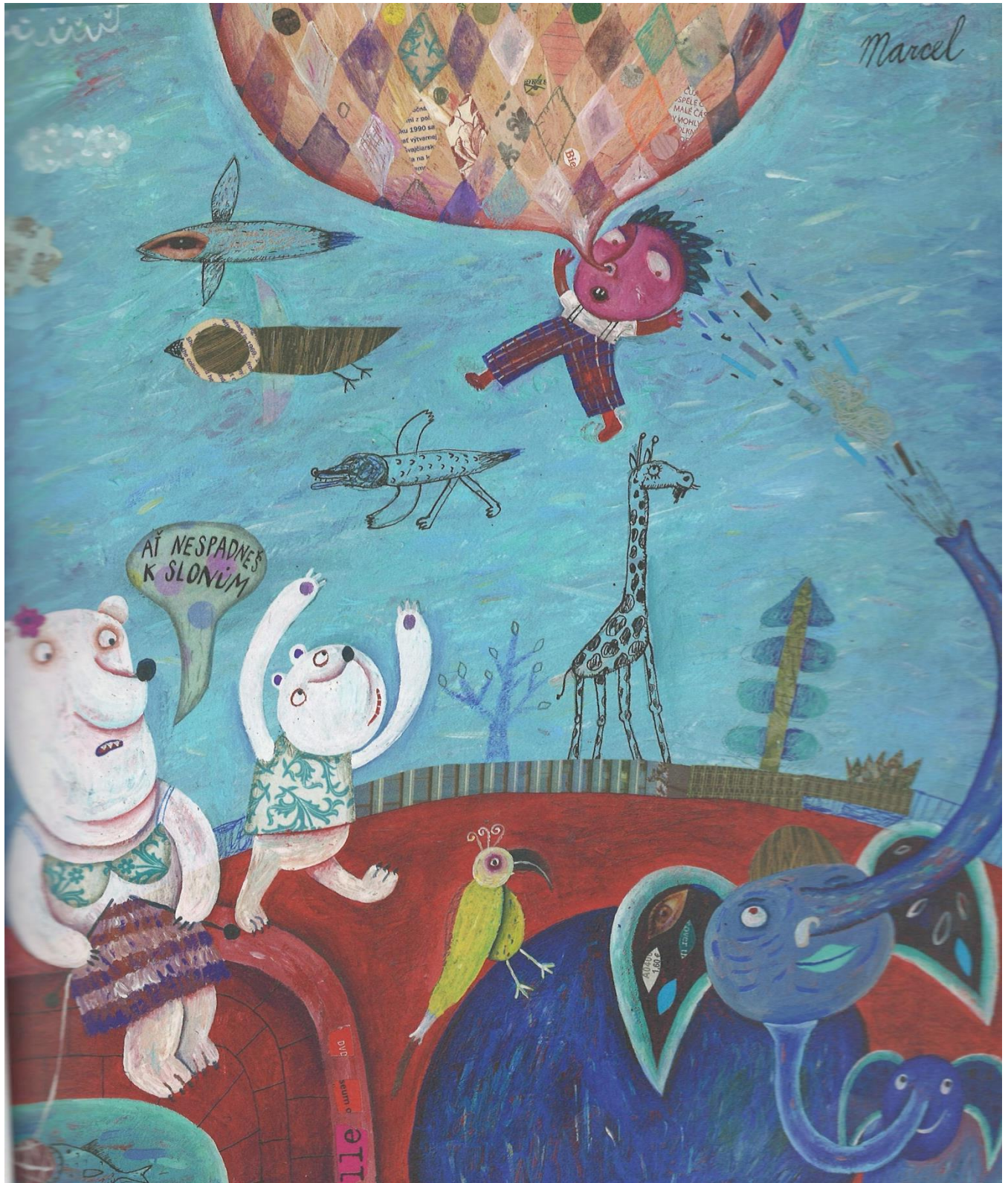
(Stará, 2020, s. 21)