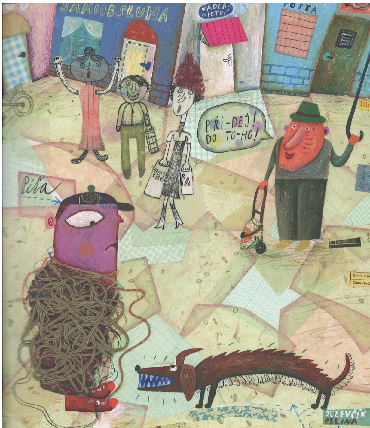
(Stará, 2020, s. 17)

skutečné předpisové kličky. A čtvrtý den? Čtvrtý den si pořídil boty na suchý zip. (Stará, 2020, s. 16-18)