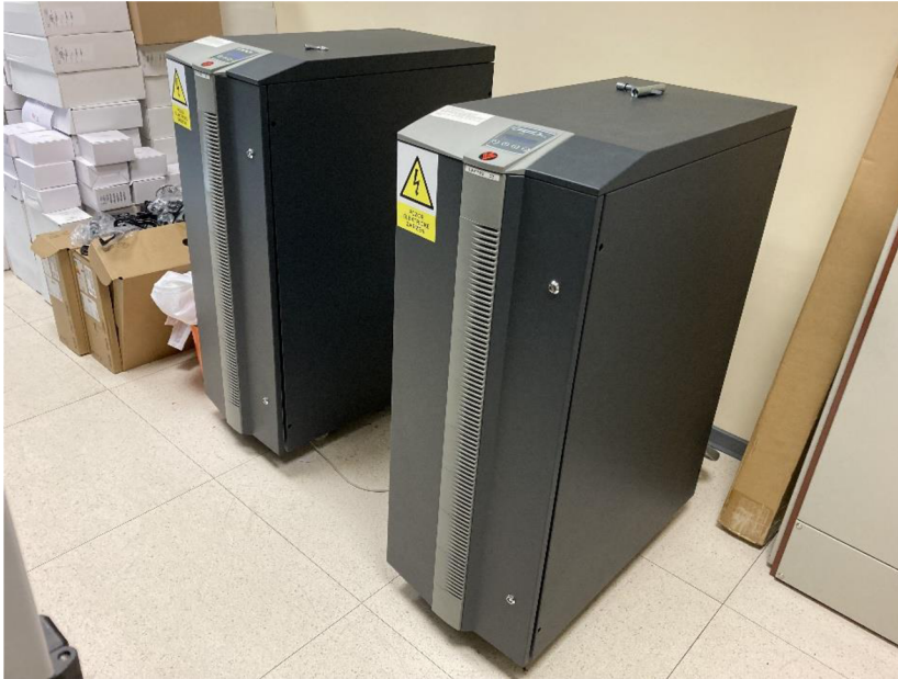
Obrázek 5 UPS ZZS PK