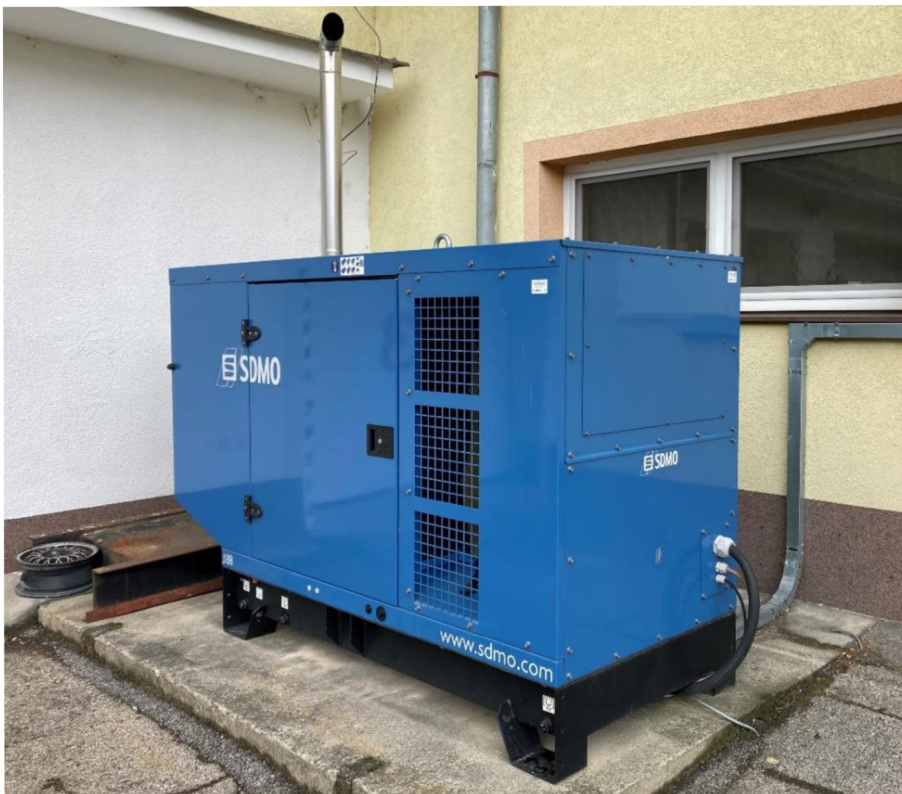
Obrázek 9 dieselagregát pro zásobování ZOS ZZS JČK