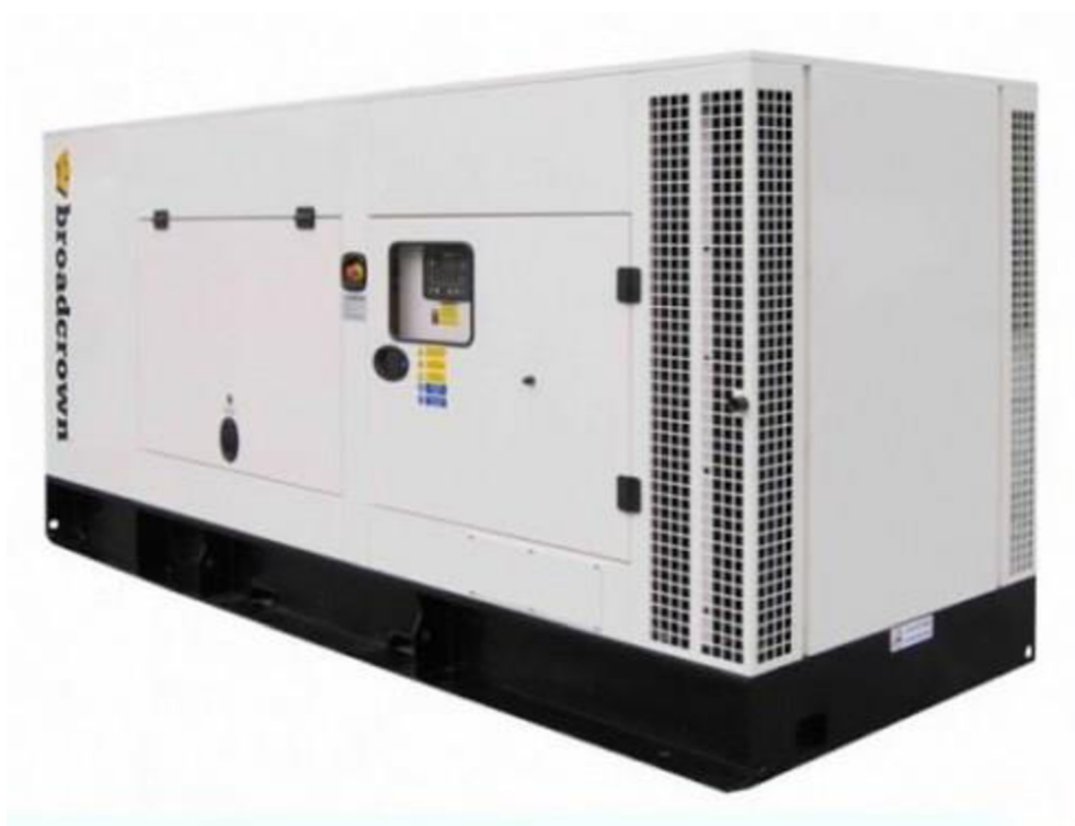
Obrázek 10 dieselagregát pro vybraná pracoviště ZZS JČK