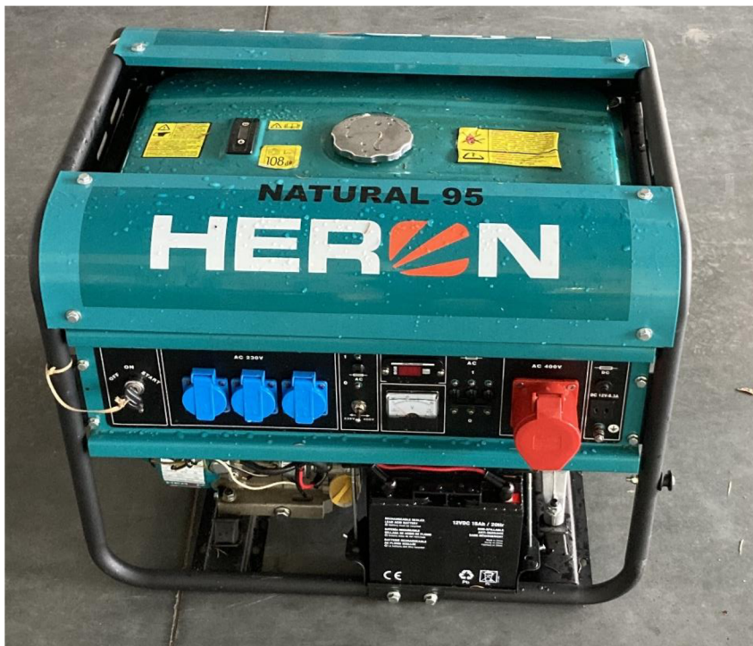
Obrázek 6 benzinový agregát ZZS PK