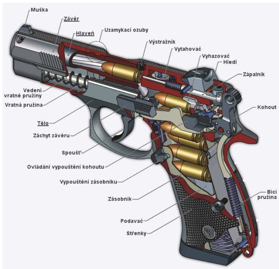
Obrázek 1: Pistole CZ 75

Zdroj: zbraně kvalitně, online, cit. 15.1.2017 33