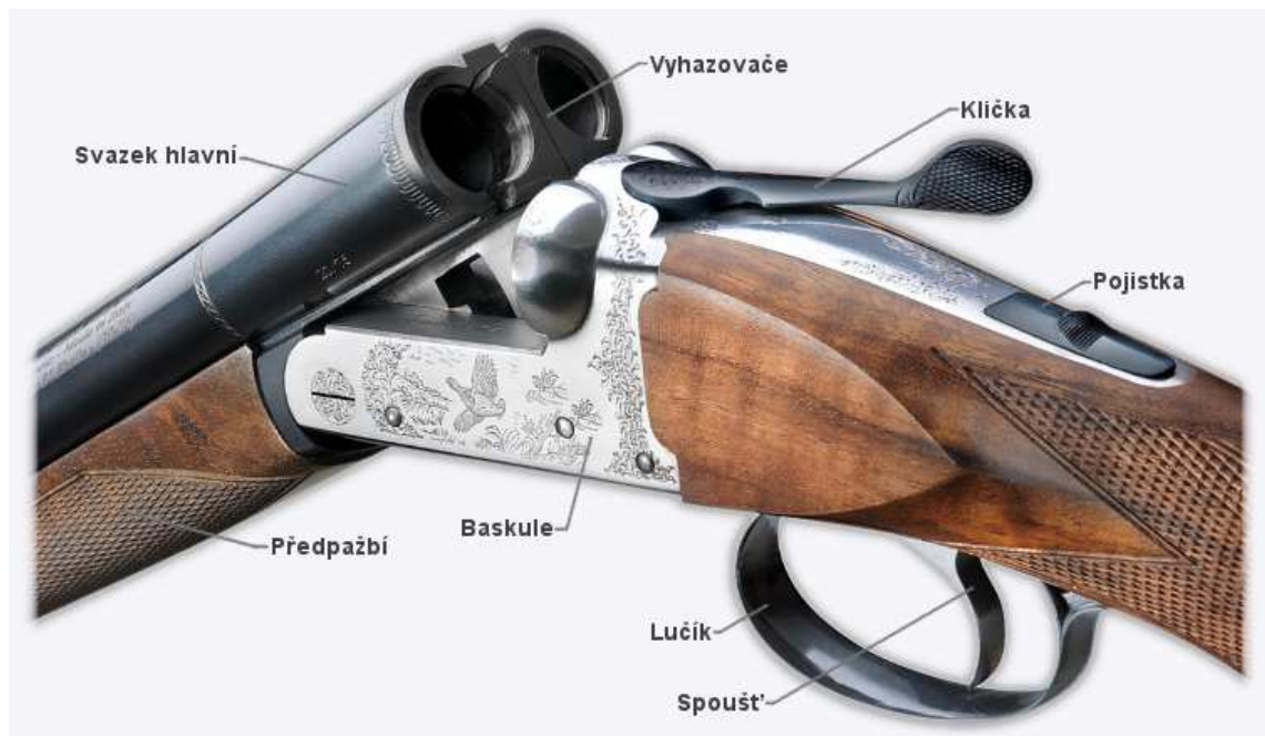
Obrázek 4: Brokovnice dvojka

Zdroj: zbraně kvalitně, online, cit. 15.1.2017 40