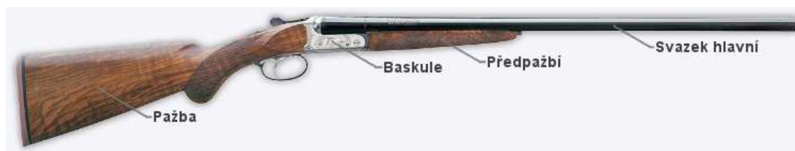
Obrázek 3: Brokovnice dvojka

39