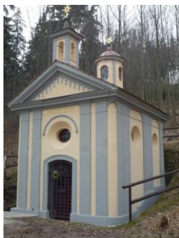
Obrázek č. 10: Interiérová kaplička