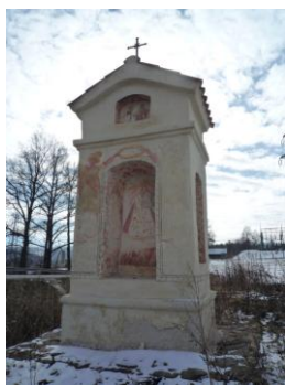
Obrázek č. 7: Pilířová boží muka s potlačenou funkcí vrcholové kaplice

funkci nosnou a byli nástrojem k posunutí kaplice blíže k Bohu. U pilířových božích muk s potlačenou funkcí vrcholové kaplice tato kaplice