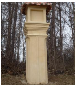
Obrázek č. 3: Zděná pilířová muka s vysazenými kaplicemi