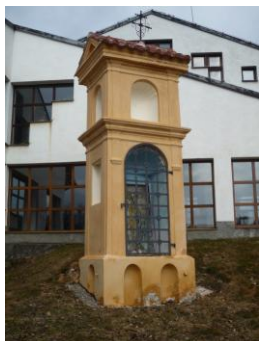
Obrázek č. 8: Boží muka přechodného typu