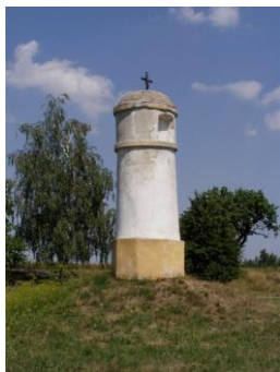
Obrázek č. 2: Zděná sloupková boží muka

Zděná sloupková boží muka jsou oproti pilířovým zděným božím mukům v jižních Čechách v menšině. Jsou však mimořádně výtvarně provedeny a jejich začlenění do krajiny je nenásilné a harmonické. Časové zařazení a historická posloupnost je velmi zkomplikována tím, že neexistují písemné zprávy a jejich tvarová různorodost znemožňuje porovnání s jinými, avšak datovanými, stavbami. 9