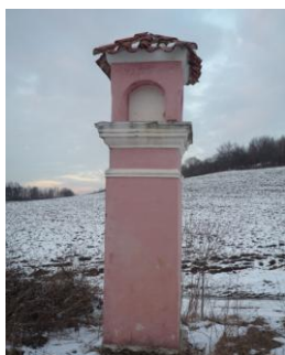
Obrázek č. 4: Boží muka s hmotně shodnými kaplicemi zakončenými jehlancovou stříškou