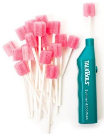
Obrázek 7: Logopedický vibrátor T Vibe s nástavcem Toothette

sekund skousnutý mezi stoličkami bez jakýchkoliv nežádoucích pohybů. Následně udržet od 4 do 15 sekund tah s bloky bez pohybu hlavy. Postupně se střídá pravá i levá strana úst. Následuje použití logopedického vibrátoru T Vibe se špátlí Toothette. Logopedický vibrátor se zaměřuje na senzitivitu těla – nejprve začínají vibrací na ruce a postupně přes nohy, paže, rameno a tváře se dostávají ke rtům, jazyku a tvrdému patru. Jazyk na vibraci reaguje a je pohyblivý do obou stran. Dívka dobře spolupracuje, nemá zvýšený dáivý reflex a neprojevuje se u ní hypersenzitivita.