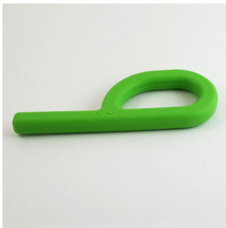
Obrázek 5: Zelený Grabber

Aktivita pro rty jsou zaměřeny na podporu stabilního a pevného retního uzávěru. Pro kvalitní výsledky je důležité, aby klient používal správný nasální způsob dýchání. V terapii je například uváděna aktivita s drobkou, špátlí, knoflíkem na provázku, pití z kelímku, dávání pusy a brumendo. Další možností je diadochokineze s fonací nebo aktivita s cereálním kroužkem Cheerios (Rosenfeld-Johnson, 2009).