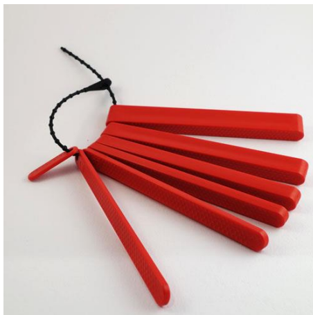
Obrázek 3: Kousací bloky

Johnson, 2009). Izometrická cvičení uvádí ve své myofunkční terapii i Kittel (1999), kdy využívá práci se špátlí.