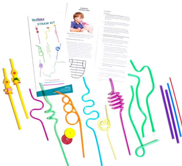
Obrázek 6: Terapeutický set brček

problémy s polykáním. Také pozorujeme jakým způsobem a jak velkou část brčka si klient vkládá do úst. Pro upravení vkládané velikosti lze použít náustek na brčko nebo jej sestříhnout do požadované velikosti nůžkami (Rosenfeld-Johnson, 2009). Cvičení sání je důležité pro správnou artikulaci sykavek. Kittel místo brček používá cviky jako přísátí jazyka na patro nejdříve jen s jazykem samotným a poté v dalších fázích s gumovými kroužky (Kittel, 1999).