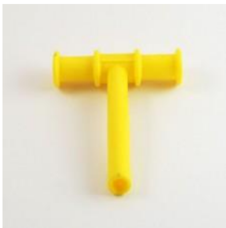
Obrázek 4: Žlutá žvýkací trubička