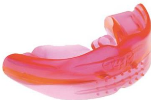
Obrázek 8: Trainer

letadlo č. 10, u které se jí ale nedaří pevný stisk koutků rtů. Logopedka ji instruuje a dívka si zkouší postavení mluvidel pro dýchání i s pomocí logopedických špátlí. S píšťalkou č. 9 je již pevnost retního uzávěru lepší a podaří se foukání až do počtu 25. Na závěr této oblasti dostane dívka novou pomůcku, a to píšťalku č. 11, do které má zatím foukat jen na prázdno a pomalu. V oblasti žvýkání pracují s fialovým Grabbem, dívka žvýká postupně na levé a pravé polovině čelisti. Dívka má levou stranu čelisti silnější, dosahuje zde počtu 30 opakování. Pravá strana je slabší, a proto je zde počet opakování nižší. Oblast sání je ukončena. Následuje práce s pomůckou Facialflex a také s pomůckou Lip Trainer.