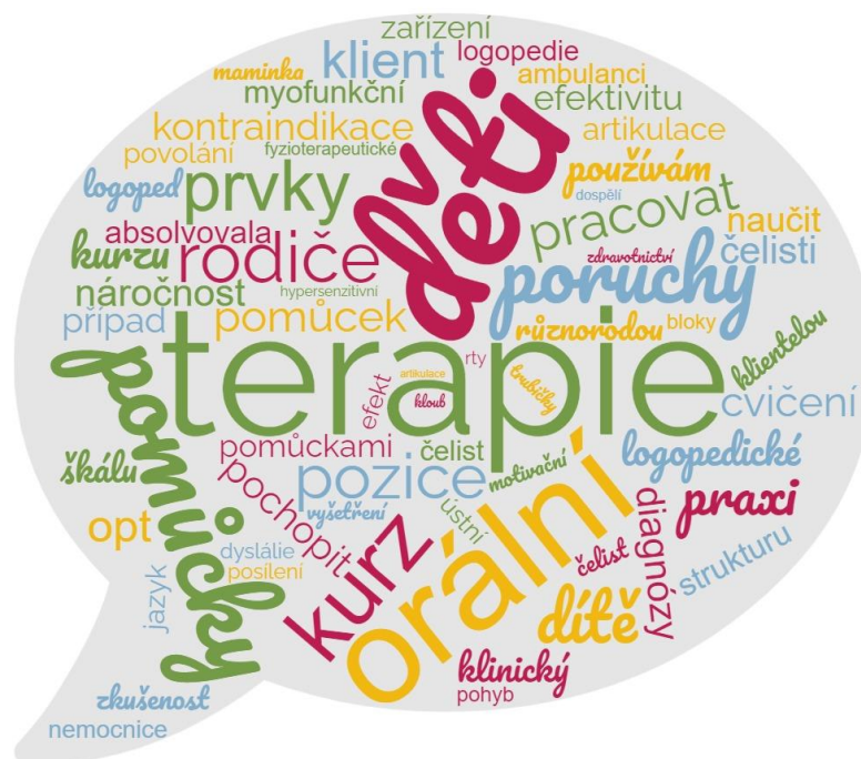
Obrázek 10: Slova s nejvyšším počtem výskytu v rozhovorech

Během analýzy byly data rozdělena do šesti jednotlivých okruhů témat, které se poté dělí na dvě až tři kategorie témat (viz Tabulka 3). V následující podkapitole jsou jednotlivé data okruhů rozpracovány a popsány společně s konkrétními výpověďmi respondentů.