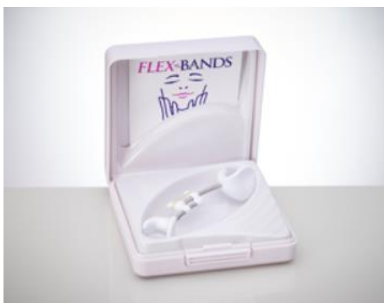
Obrázek 9: Facialflex

Ke konci logopedické terapie se zaměřují na fonograforytmiku, kterou do terapie zařadily z důvodu občasných projevů dysfluence u dívky. Dysfluence jsou dle logopedky u dívky způsobeny svalovou dysorganizací jako sekundární jev. Pracují s pracovním listem, kde je nakreslený rybníček, který prstem dívka obkresluje a u toho provádí fonaci hlásky M v prodloužení a dále ve slabikách se samohláskami. Následuje stejná práce s hláskami Z, Ž