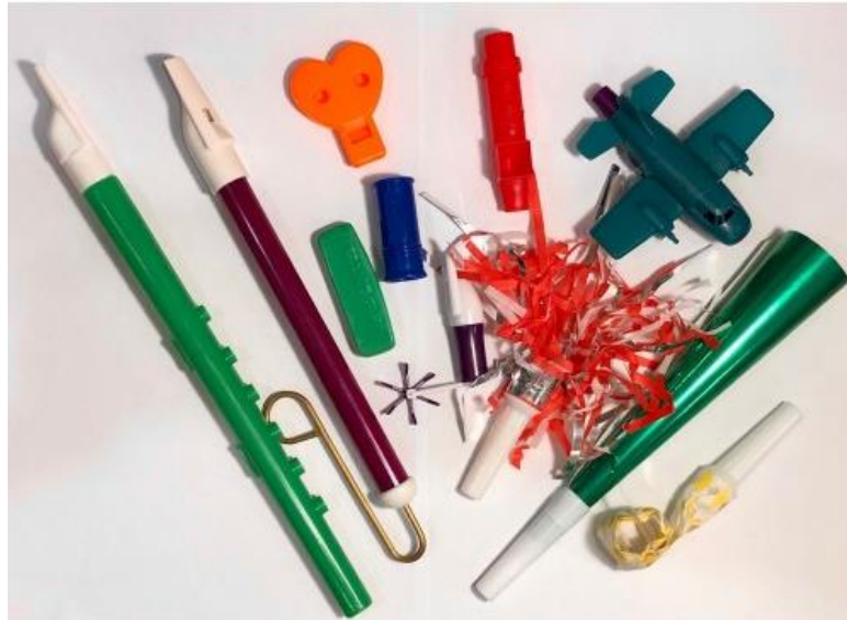
Obrázek 2: Terapeutický set píšťalek