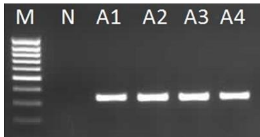
Obrázek 1. Detekce BChV metodou RT-PCR. Elektroforeogram RT-PCR produktů po separaci na agarózovém gelu. Použité primery: A: MpxBC+/MpxBC- (Hauser et al. , 2000), velikost produktu 350 bp. M: hmotnostní standard Mass ruler low range (Fermentas); N: ddH 2 O; A1-A4: vzorky z listů řepy pozitivní na přítomnost BChV.

Dále byla u 18 vzorků provedena detekce pomocí metody RT-PCR. Cílem bylo ověření výsledků z ELISA testování a dále konkrétní druhová determinace zástupců rodu Polevirus , která u sérologické metody není v rámci rodu možná.