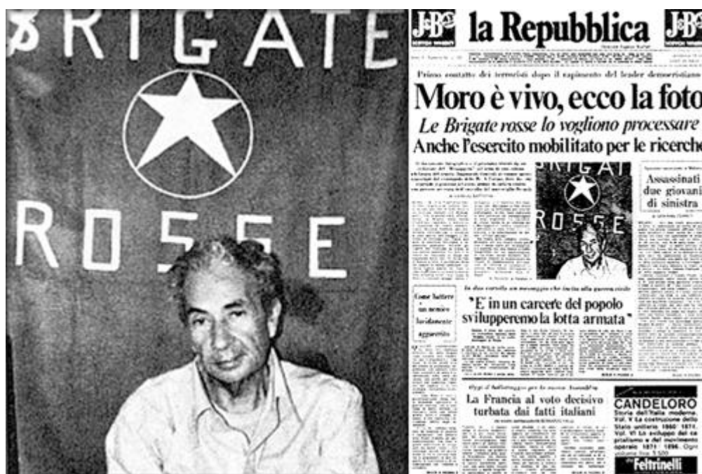
Unesený Aldo Moro a reakce italského tisku