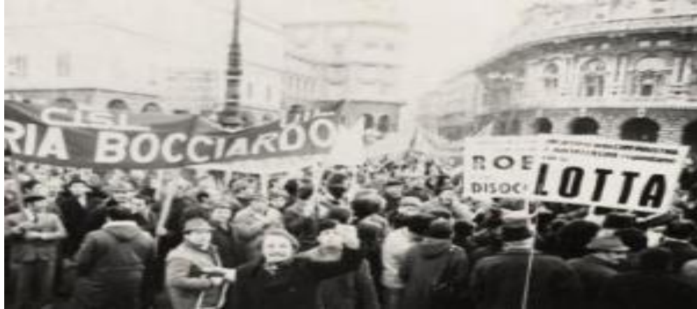
Dělnické a studentské nepokoje

zejména zvýší platové ohodnocení. Když ale zjistili, že se kýžených reforem nedočkají, a když je navíc i odborové organizace nechaly na holičkách, rozhodli se vše vzít do svých rukou. 6