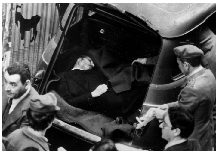
Zavražděný Aldo Moro

Po nálezu těla dne 9. května začala policejní vyšetřování, která přinesla první výsledky už po několika měsících. Během dalších čtyř let nashromáždila magistratura tolik materiálů, že dne 14. dubna 1982 mohl začít první proces s Morovými únosci. Velký podíl na tom také měla komise založená parlamentem několik měsíců předtím, 23. listopadu 1981, jejímž jediným úkolem bylo vyšetřování případu Alda Mora. 59