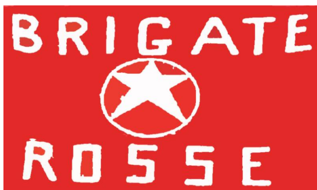
Vlajka Rudých brigád