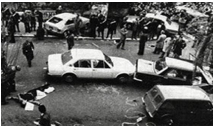
Výsledek přestřelky při únosu Alda Mora

naložen do automobilu a odvezen do bytu v ulici Montalcini, kde byl vězněn po následujících 55 dní. Ihned po únosu brigadisté zavolali do tiskové agentury ANSA, která okamžitě přerušila vysílání a oznámila zprávu o únosu. V ten samý den byla naprostou většinou vyslovena důvěra Andreottiho vládě. 56