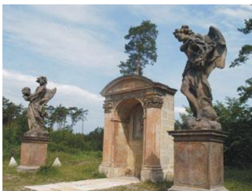
obrázek č. 7, Poustevna (eremitáž) svatého Václava

Západní cestou z Byšiček kolem Hrbáčkových trůnů, za tratí Lysá nad Labem Praha se nachází Poustevna svatého Václava. Hrabě Sporck schválně a nápadně, okrášlil okolí Pražské silnice. To proto, aby poutník sotva překročí hranice brandýských lesů musel podle té nádhery poznat, že stojí na půdě Velkomožného mecenáše. Když poutník přešel toušeňský most a vycházel z káranského lesa, spatřil skupinu budov a tři zahrady, krásné sochy u poustevny sv. Václava. Napravo se táhla k Labi zahrada se vzácnými stromy, keři a květinami. V dobách hraběte F. A. Sporcka panovala mezi evropskou šlechtou velká móda - zakládat na odlehlých místech, obzvláště v lesích, poustevny a udržovat v nich poustevníky. Tehdy se našlo dosti mužů ochotných žít jako poustevník. Hrabě Sporck určil při jejich vybírání přísný řád a povinnosti, které museli dodržovat po dobu nejméně 3 let. Do povinností patřily: úklid obydlí, kostelnická služba a starost o zahrádku okolo pousteven a poskytování občerstvení a pomoc pocestným v nouzi. Poustevna u sv. Václava stávala na pravém břehu Labe při Pražské silnici. Byla i s oltářem postavena z kamene. Měla silné zdi se skleněnými tabulemi s chodbami. Vedle ní stáli dva obrovští kamenní andělé. Levý z nich držel s lehkým úsměvem nad lucernou lebku ověšenou květy, kdežto ten druhý třímal s výrazem smutku lebku s trnovou korunou. První vyjadřoval smrt blaženou a druhý smrt žalostnou. Za kaplí k severu byla poustevníková světnice s kuchyňkou a venku se