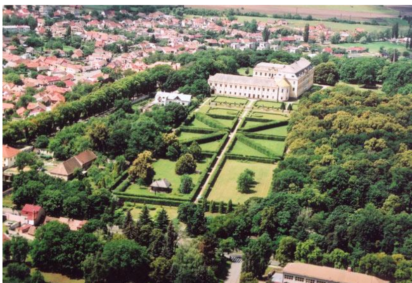
obrázek č. 5, Zámek Lysá nad Labem a zámecký park

Bývalý hrad snad z 11. století byl ve druhé polovině 16. století přestavěn na renesanční zámek. Po třicetileté válce připadl darem Janu Sporckovi. František Antonín hrabě Sporck uskutečnil jeho barokní přestavbu v letech 1684 – 1722.