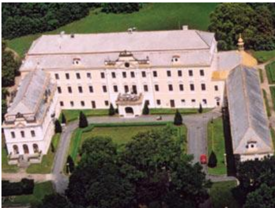
obrázek č. 6, Zámek Lysá nad Labem

přírodních živlů a světadílů nemá ve světovém sochařství obdoby (Versailles je vyzdobeno pouze alegoriemi 12 měsíců). Sochy měsíců jsou umístěny ve dvou řadách proti sobě v hlavní osově habrové aleji, na podstavcích, jejichž čtyři zrcadla nesou dnes již nezřetelný německy text. Autorství soch se přisuzuje Františku Adámkovi staršímu z Benátek. K jeho prokazatelným pracím pro lyský park patří