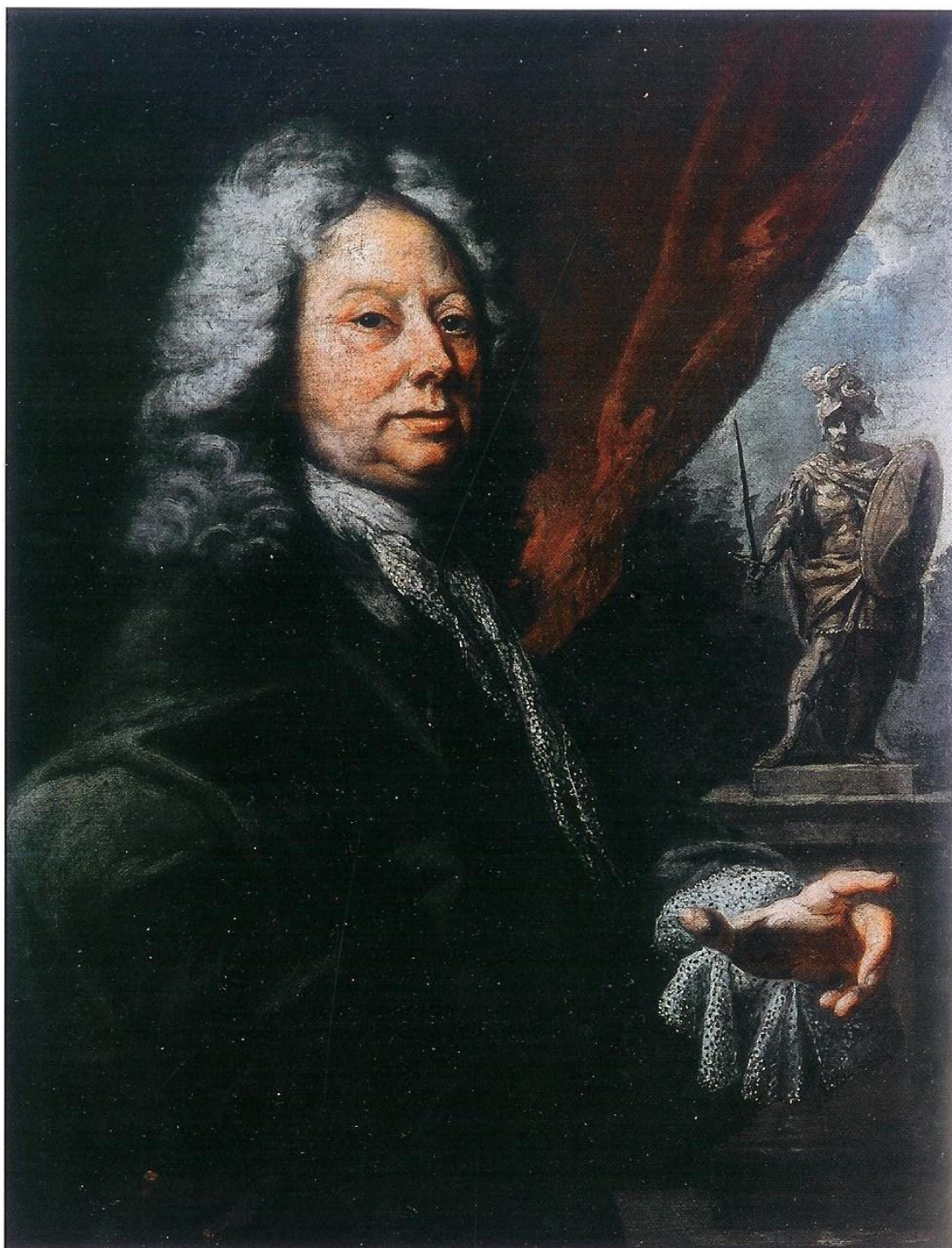
Petr Brandl: František Antonín Špork