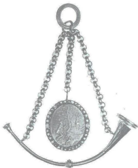
obrázek č. 15, insignie Řádu sv. Huberta, Bezděk a Kovařík 1998

V době Sporckově dělo se přijímání nových členů zvláštním způsobem zpravidla dne 3. listopadu na svátek svatého Huberta, patrona myslivců. Přítomní členové řádu vytvořili kruh kolem Velmistra, který postoupil do popředí, kdežto volenec se postavil v pozadí. Poté řádový tajemník mu z řádové knihy přečetl slib tohoto znění: