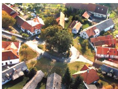
obrázek č. 4, obec Byšičky archiv J. Řehounka

Je to zcela ojedinělá zachovalá okrouhlice, jediná ve střední Evropě. Původně zde stávala tvrz Byšice s malou osadou vybudovaná ve 13. století jako stráž na zemské stezce. Postavená byla na místě pravěkého sídliště z doby laténské mezi 5. – 1. století p.n.l. Ta však byla roku 1421 vypálena vojskem Jana Žižky, když tudy směřoval ke Kolínu. Ves dále chátrala a po třicetileté válce 1618 – 1648 zanikla úplně. Tam, kde stával dvůr, založil v roce 1717 hrabě Sporck novou vesnici Byšičky. Ta měla původně osm domků postavených do kruhu. Vznikl tak ojedinělý typ vesnice - okrouhlice se dvěma přístupovými cestami. Barokní doba dovedla slohové modelovat i tak prostý stavební útvar, jakým byla mala česká vesnička. Běžný typ vesnice v Polabí je lineární zástavba po obou stranách cesty bez návsi. K původním osmi chalupám byly později do kruhu přistavěny další čtyři a nová stavení se pak stavěla ve dvou rovnoběžných řadách podél cesty od východu. Takže mely Byšičky potom tvar vařečky. Uprostřed návsi stojí kaplička. Původně tam bývala zvonice a u ní studna. V roce 1888 ale zvonici roztříštil blesk a tak vesničané zasypali i studnu a na jejím místě nechali postavit kapličku. K vesnici Byšičky patřil od roku 1780 i statek Karlov a dva mlýny. (anonym, archiv J. Řehounka)