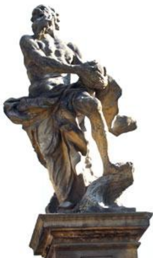
obrázek č. 13, sv. Jeroným

Zámek Le Maison de Bon Repos, což z francouzštiny znamená Místo příjemného odpočinku, se nachází nedaleko obce Čihadla mezi Lysou nad Labem a Benátkami nad