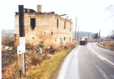
obrázek č. 11, Budova bažantnice Semotánová E.a kol. 2008

Oplocenou bažantnici s hájovnou zřídil Špork pod vinicí západně od zámku v Lysé. Přesné datum založení není známé. V bažantnici stála stodola a jednopatrová stavba bažantnice, která byla postavena již v době kdy Lysou vlastnili Habsburkové. Na západním štítě se nacházel znak a letopočet 1565 nebo 1568. Stodola byla zbořena v sedmdesátých letech 20. stol. a budova bažantnice v srpnu 2000. (Semotánová kol. 2008) Na jejím místě dnes stojí čerpací stanice PHM. Z bažantnice se údajně prodávalo až 200 bažantů ročně, jak uvádí Otruba (1997)