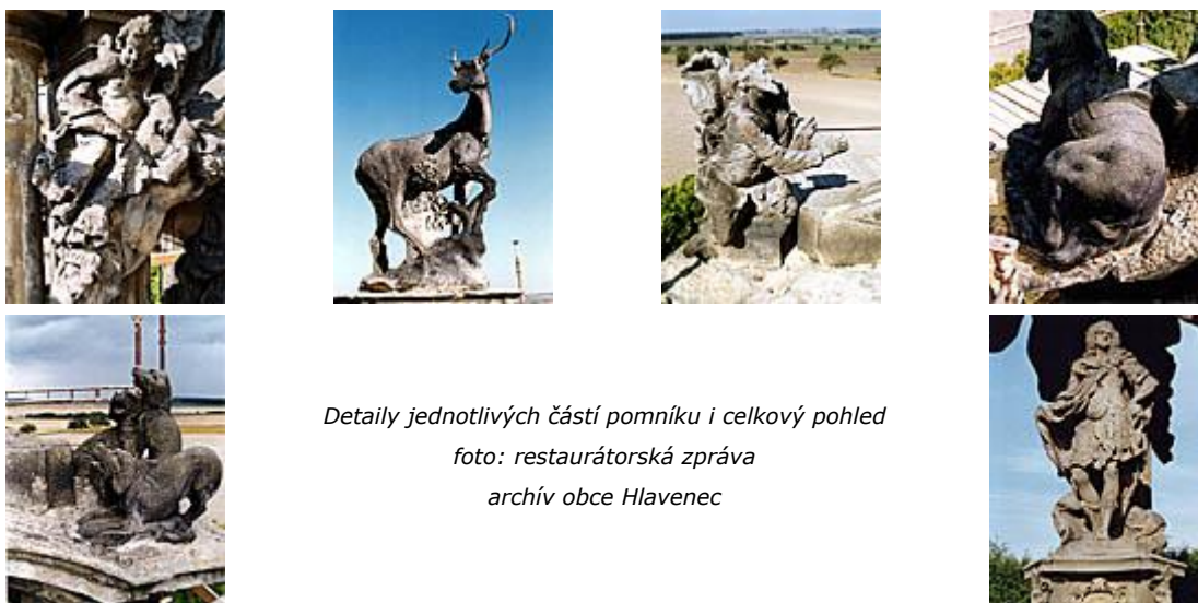
Detaily jednotlivých částí pomníku i celkový pohled

nazdvihují dva andílci (putti). Další putti v zastřešení nesl šporkovský erb a pod ním byla v reliéfu zobrazena zavěšená lovecká trubka. Na trojbokém zastřešení stál jelen s křížem mezi parožím, dívající se na níže klečícího sv. Huberta. V protilehlém rohu zastřešení sledují jelena dva lovečtí psi. Pomník měl být také oslavou lovu a jeho světských radostí, na které upomínaly tři reliéfy v podstavci pomníku (štvanice divočáka, halali parforsního honu, pohoštění účastníků lovu), a oslavou svatohubertského Řádu a jeho zakladatele. (Rýdl 2000)