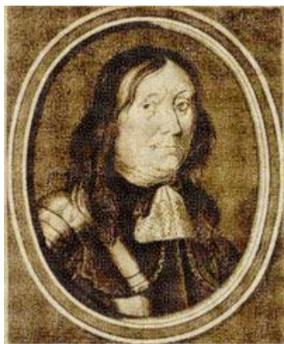
obrázek č. 3 Johan Sporck