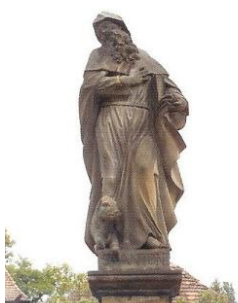
obrázek č. 8, svatý Antonín Poustevník

Poustevna sv. Františka Serafinského (kaple, patrový domek s malbami, v přízemí s prostorami pro služebnictvo, v patře pro panstvo) stála již v roce 1692. Nacházela se v polesí Bor, západně od Lysé, v místě zvaném U altánu. Vstup k poustevně zajišťovaly dva lesní průseky, z jihu od Zemské cesty, kde byla umístěna socha sv. Antonína Poustevníka a od východu. Zde dnes leží ves Dvorce založená 1760. Poustevna dnes již neexistuje, socha sv. Antonína Poustevníka je umístěna na zdi kostela sv. Jana Křtitele v Lysé. Jejím autorem je pravděpodobně Jan Brokof. (Semotánová a kol. 2008)