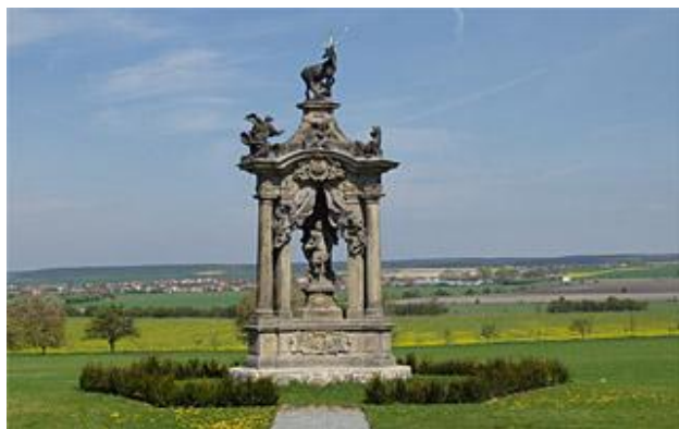
obrázek č. 9, Pomník císaře Karla VI. u Hlavence

Na počest přijetí Řádu sv. Huberta dne 3. listopadu 1723 císařem Karlem VI. byl dne 3. listopadu 1724 položen základní kámen ke stavbě pomníku císaře Karla VI. u Hlavence (na místě, kde císař přijal Řád), který byl rok po té, za přítomnosti prince Evžena Savojského, slavnostně odhalen. Impozantní pomník byl vytvořen společnou prací sochaře Matyáše Bernarda Brauna a architekta Ferdinanda Maxmiliána Kaňky. V trojbokém, sloupovém ohraničeném prostoru byl zpodobněn stojící císař Karel VI. v podobě římského imperátora, který je shora chráněn orlem a draperií, jejíž konce