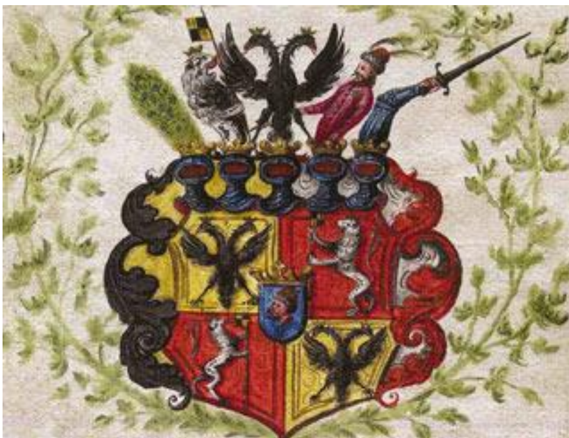
Obrázek č. 1: znak Františka Antonína hraběte Šporka