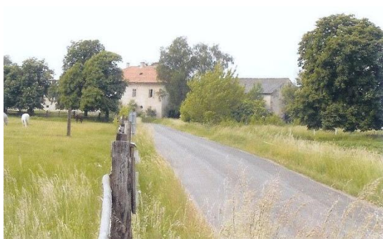
obrázek č. 12, Dvůr Karlov

Na křižovatce cest z Litole do Byšiček a z Lysé na Nové Stavení nechal Špork roku 1715 postavit špitál s kapacitou asi 40 osob. Ve špitálním kostele Povýšení svatého Kříže se konaly před zahájením lovu slavnostní svatohubertské mše Špitál začal být asi od poloviny 18. století proměňován na hospodářský dvůr Karlov a počátkem 19. století byl zrušen. (Preiss 1981) Tato informace je zavádějící, Otruba uvádí, že v padesátých letech (18.stol) bylo 24 chudých přestěhováno do špitálu ve staré radnici v Lysé a roku 1800 byl špitál zrušen docela, protože se nedochovala nadační listina zajišťující jeho vydržování. (Otruba 1997)