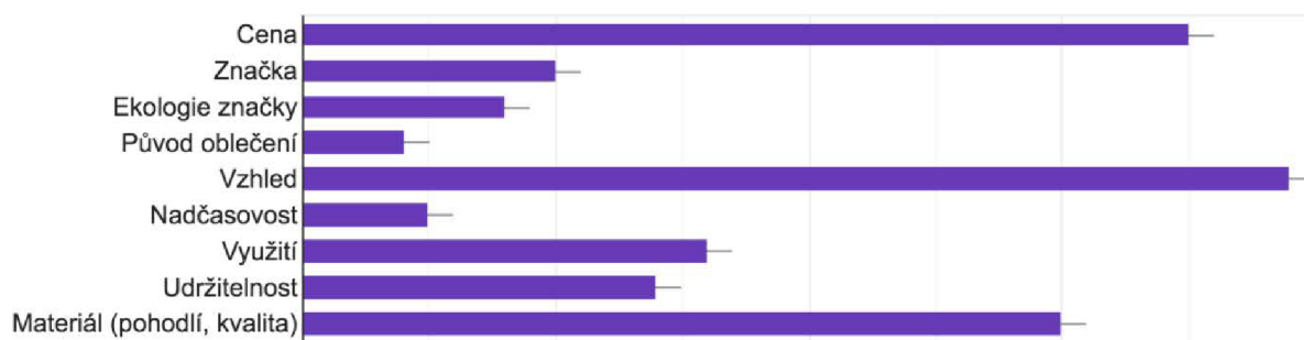
graf 2 - faktory ovlivňující výběr oblečení. 95

Jelikož je Patagonia jedna z předních značek v oblasti udržitelnosti, dotazník zjišťoval, zdali mají respondenti ponětí o existenci této značky. Ze sta respondentů jich sedmnáct uvedlo, že značku Patagonia znají, pět z nich dokonce uvedlo, že je Patagonia jedna z jejich oblíbených značek. Zbylí respondenti tedy o značce nikdy předtím neslyšeli.