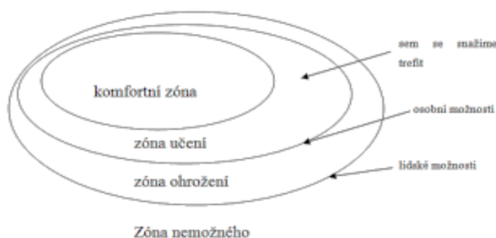
Obrázek 3: Komfortní zóny (Pelánek, 2008, s. 23)

Každý člověk má svoji individuální zónu, která mu umožňuje přijímat a překonávat výzvy, jež ho v životě potkávají. Jsou v ní zahrnuty činnosti, které v člověku nevyvolávají stres. Když se člověk setká s výzvou, kdy musí vystoupit ze své oblasti komfortu, a úspěšně ji zvládne, díky pozitivní zkušenosti se tato komfortní zóna rozšíří. Problematické může být vkročení jedince do oblasti ohrožení, což může způsobit selhání účastníka programu a následný pokles důvěry ve vlastní schopnosti. (Činčera, 2007)