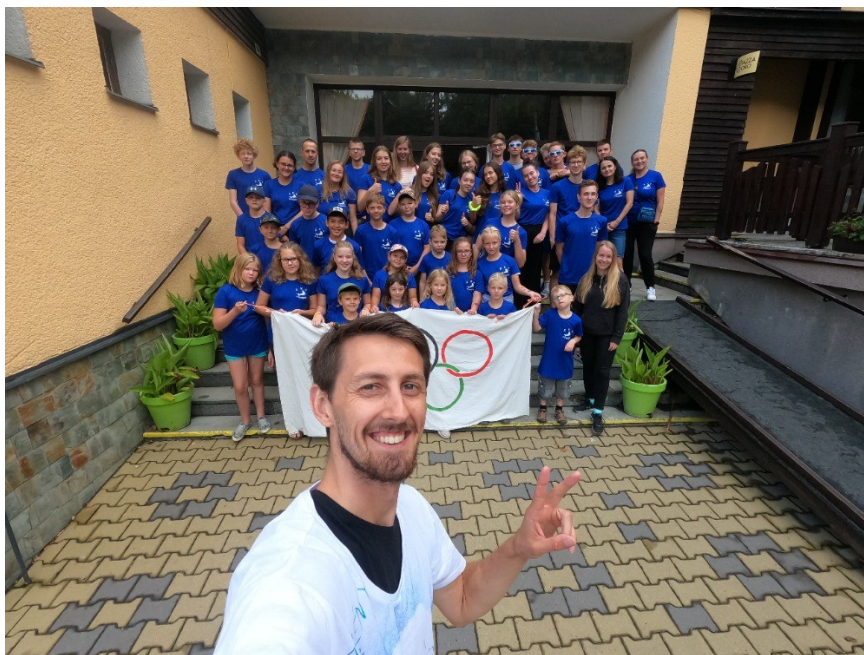
Příloha č. 3 – Tvoření triček a vlajky