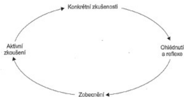
Obrázek 1: Kolbův cyklus zkušenostního učení (Hanuš a Chytilová, 2009, s. 43)

Takovýto model učení má i své nedostatky, které popsal ve své knize Jan Činčera. Upozorňuje na velmi zjednodušený proces učení, který nebere v potaz, že empiristická zkušenost může vést ke špatným závěrům. Může tedy docházet k mylným zobecněním, či chybným transferům. Proto je při tomto cyklu velmi důležitá role vedoucího, který by se měl snažit eliminovat tyto nedostatky a kontrolovat, zdali nedochází k chybným závěrům celého učení se prožitkem. (Činčera, 2007)