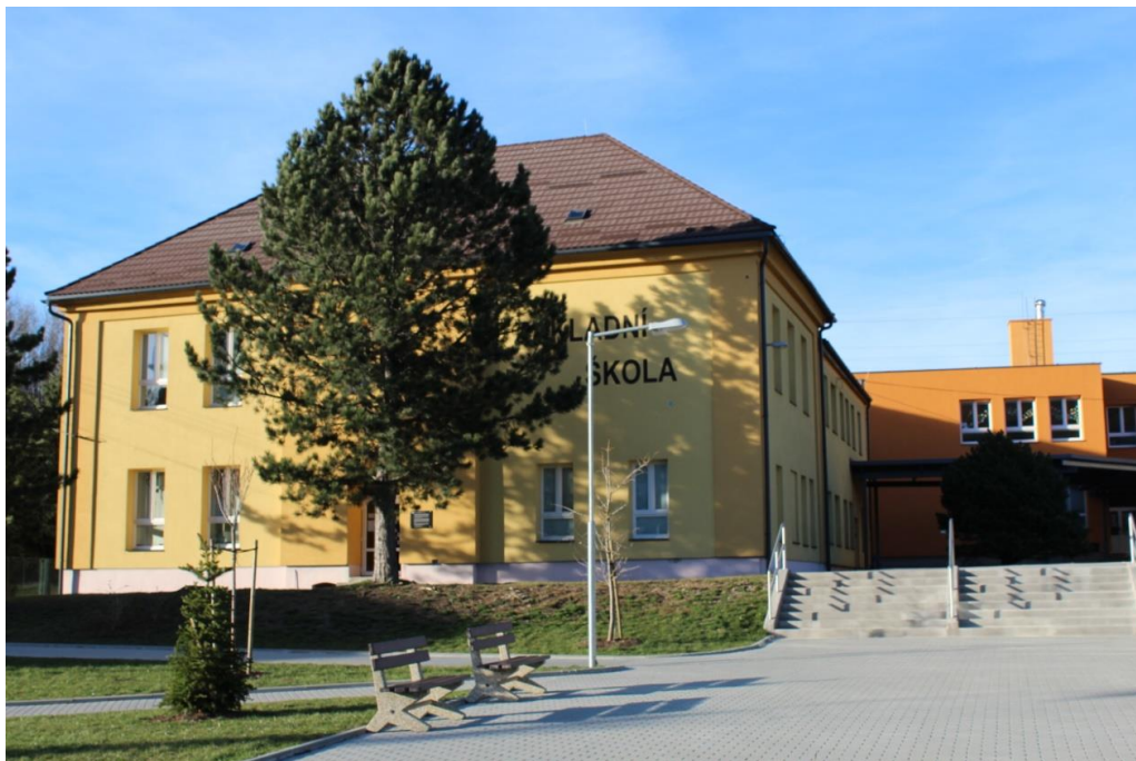
Příloha č. 2: Budova školy dnes