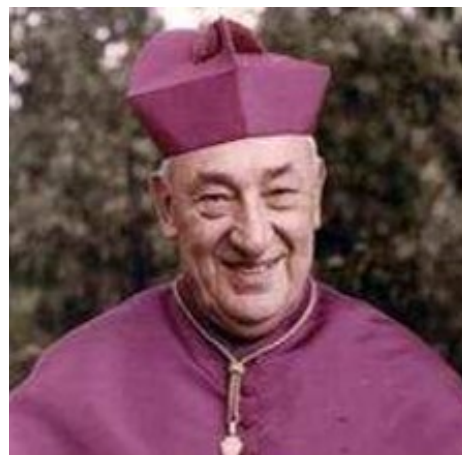
Obr. 7: Štěpán kardinál Trochta

V roce 1923 odcestoval do Itálie do města Perosa Argentina, kde se připravovali slovenští chlapci ke vstupu k salesiánům. A tam se také začal plnit jeho sen – stát se knězem a věnovat se mládeži. V Perose absolvoval noviciát a časem začal realizovat svou myšlenku založit českou provincii salesiánů. Seznámil se s P. Stuchlým a 28. září 1927 přišli první salesiáni na Moravu do Fryštáku, kde byl následně založen první chlapecký ústav. 16