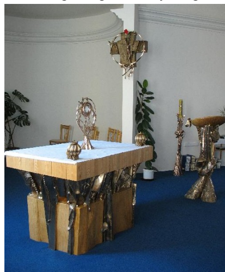
Obr. 4: Kaple z roku 1931

Hlavní část budovy DISu (zkr. Domu Ignáce Stuchlého) postavily v roce 1902 sestry Neposkvrněného početí jako přístavbu k původní takzvané Staré škole z roku 1860. Celý tento komplex potom koupili salesiáni a 28. 9. 1927 zde, pod vedením P. Ignáce Stuchlého, zahájilo činnost první české salesiánské dílo. Zde šlo o chlapeckou střední školu s internátem, jenž připravovala budoucí salesiány. V roce 1931 byl dům rozšířen o kapli, divadelní sál a tělocvičnu. 8