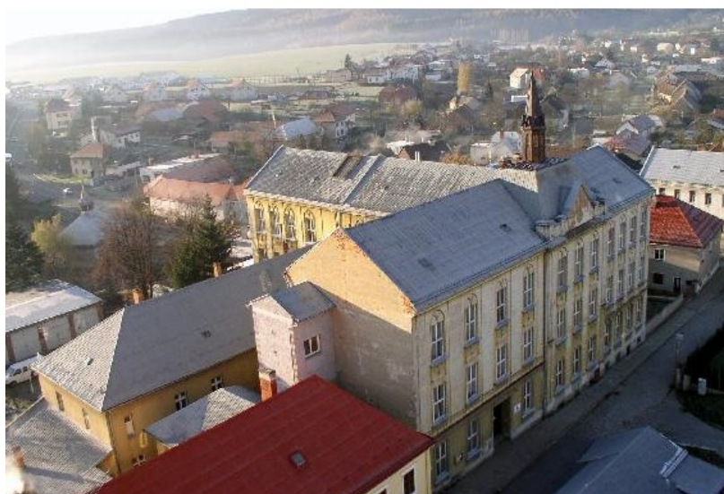
Obr. 2: Dům Ignáce Stuchlého v současnosti