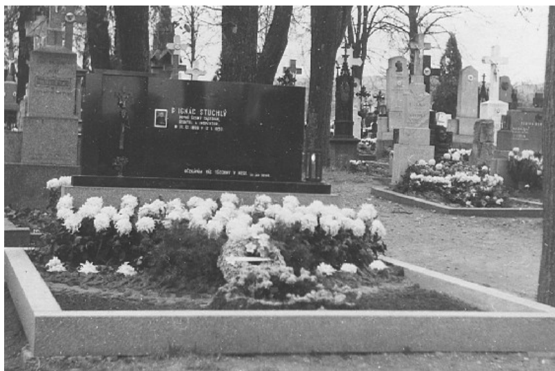
Obr. 6: Hrob Ignáce Stuchlého (zdroj: Dům Ignáce Stuchlého )

Po pádu komunistického režimu pokračovala řada salesiánů ve svém dosavadním působení. Chaloupky, formace laiků a salesiánských spolupracovníků a obdobné aktivity