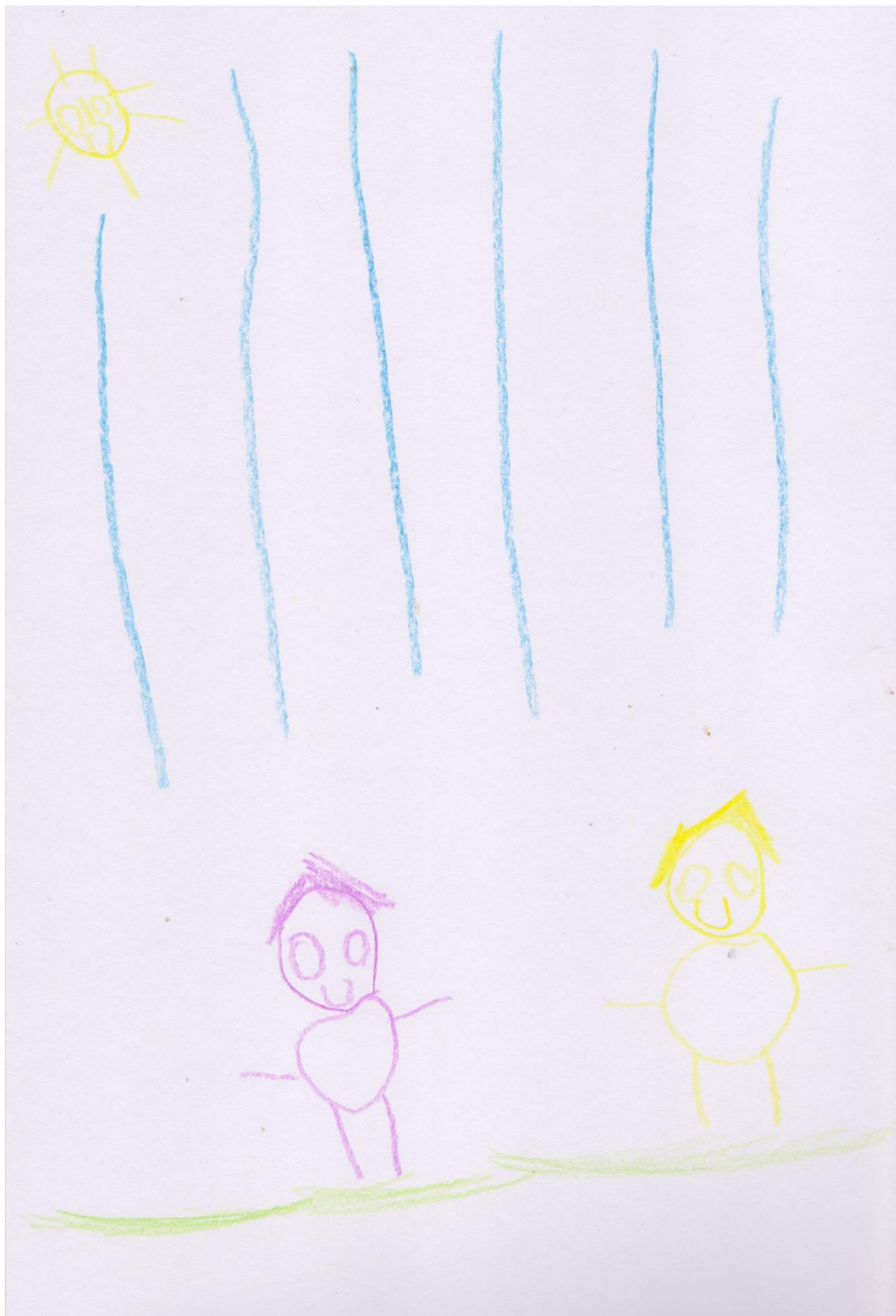
Příloha č. 1