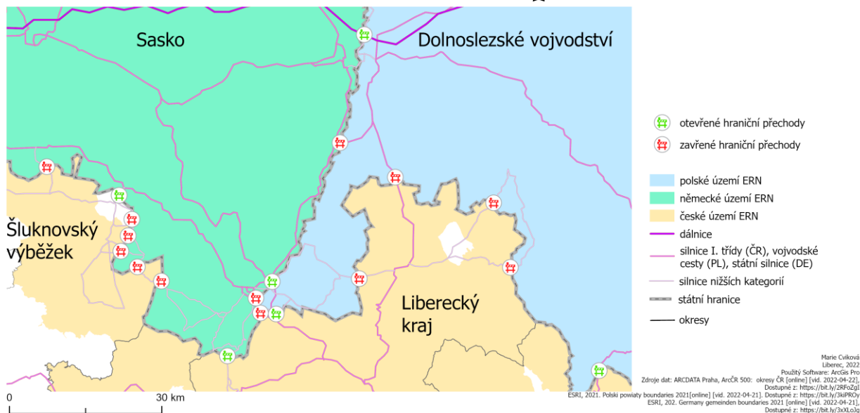
Obrázek 2 Otevřené a uzavřené hraniční přechody v ERN