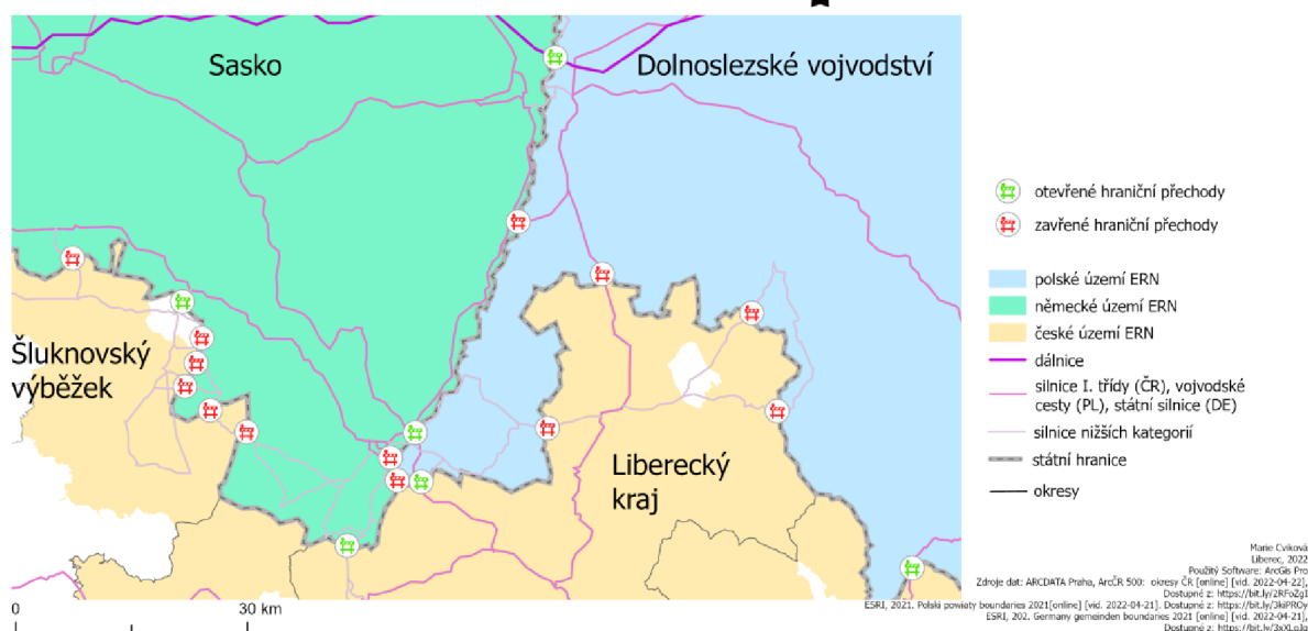
Obrázek 2 Otevřené a uzavřené hraniční přechody v ERN