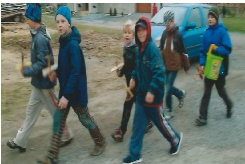
Obr. č. 14: Odpolední obchůzka klapačů za nepříznivého počasí