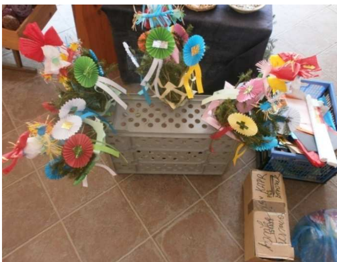
Obr. č. 7: Vyrobené Jedličky