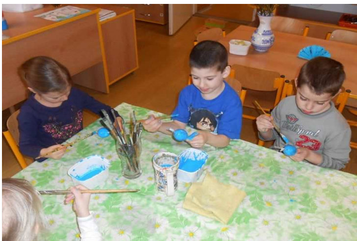
Obr. č. 16: Malování vajíček