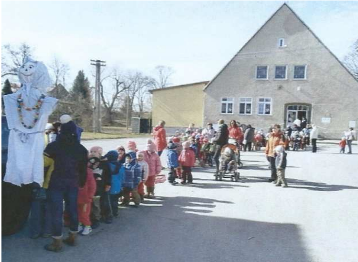
Obr. č. 3: Průvod od mateřské školy