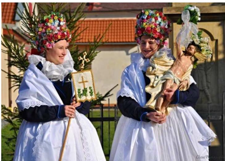
Obr. č. 13: Matičky z Bělkovic se sochou Krista