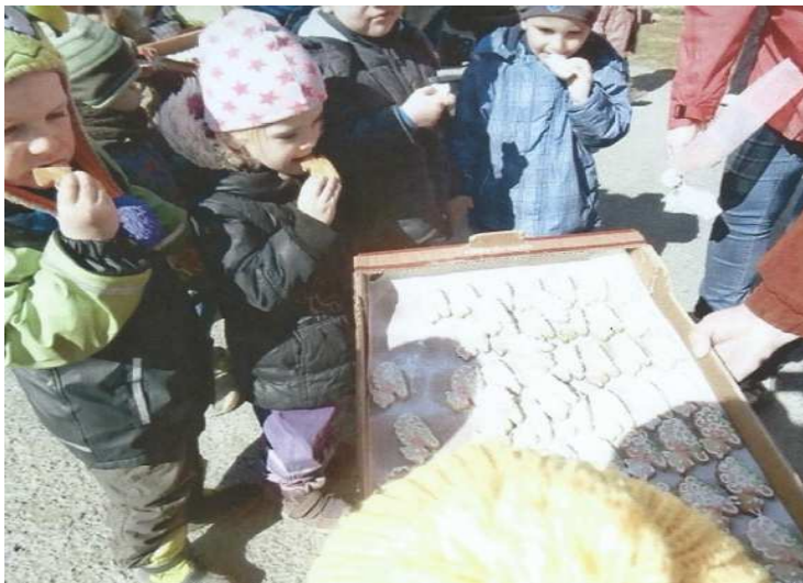
Obr. č 4: Občerstvení u sousedů