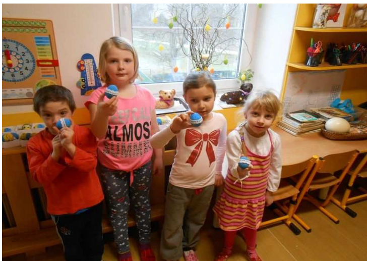
Obr. č. 17. Hotová vajíčka s krajkou