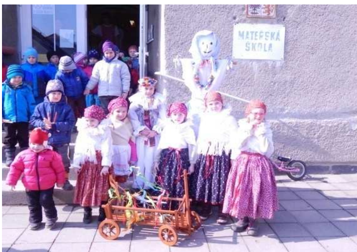
Obr. č. 2: Vycházející průvod v krojích