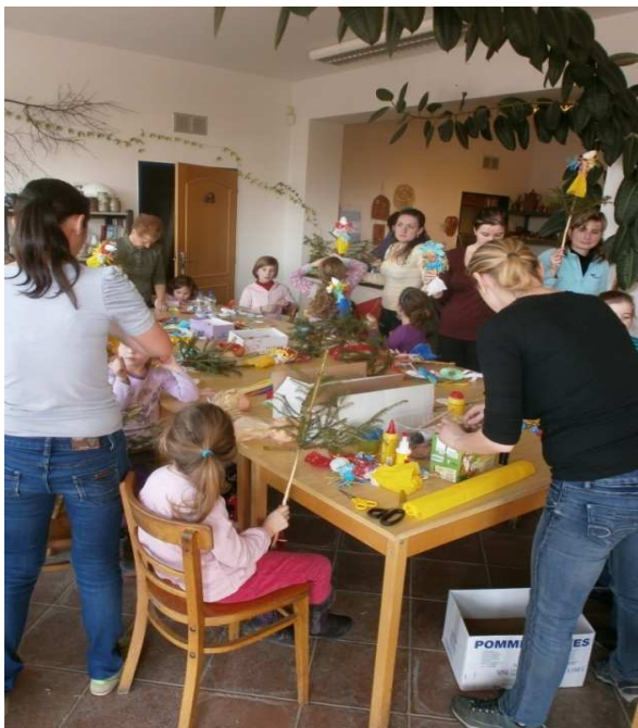
Obr. č. 6: Vyrábění Jedliček