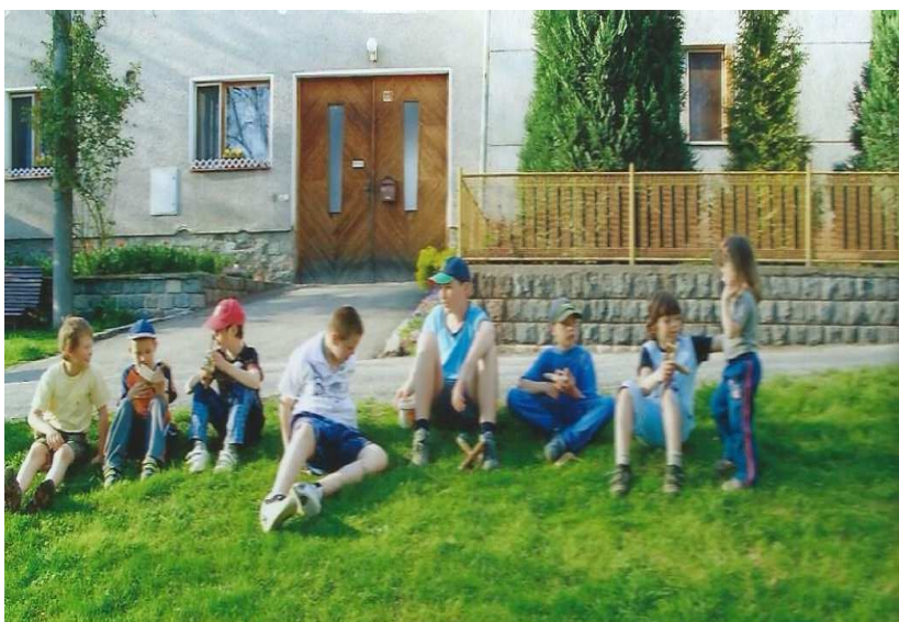
Obr. č. 15: Scházení klapačů za příznivého počasí