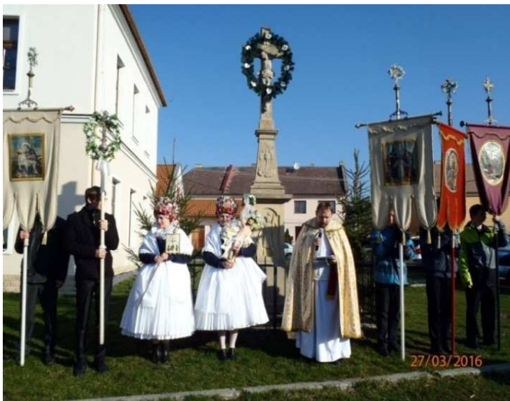
Obr. č. 12: Průvod Matiček z Bělkovic