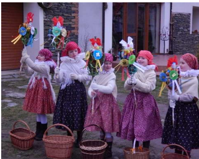
Obr. č. 9: Koledování děvčat v krojích