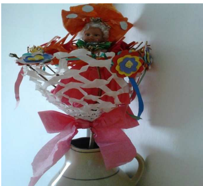
Obr. č. 8: Jedlička s hlavičkou od panenky