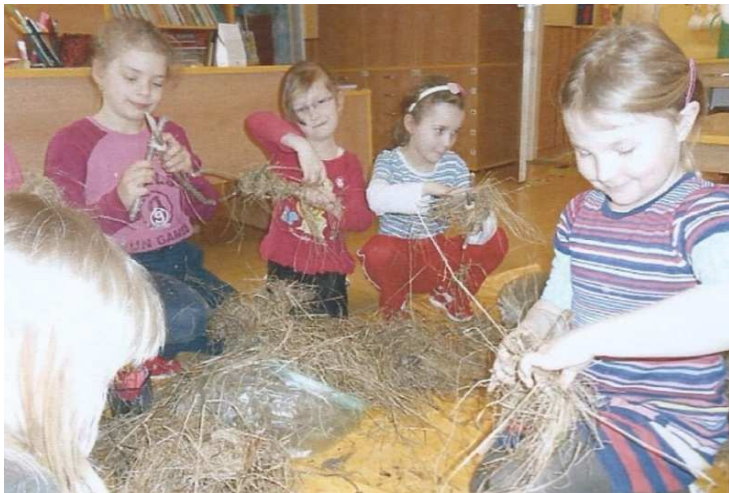
Obr. č. 1: Výroba Morenky ze sena