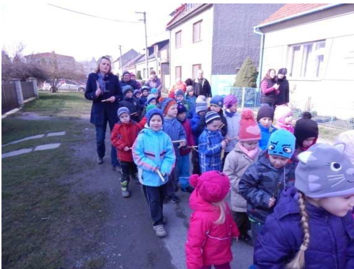
Obr. č. 6: Průvod za doprovodu říkadel