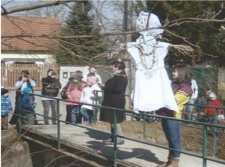
Obr. č 5: Zastavení na mostě