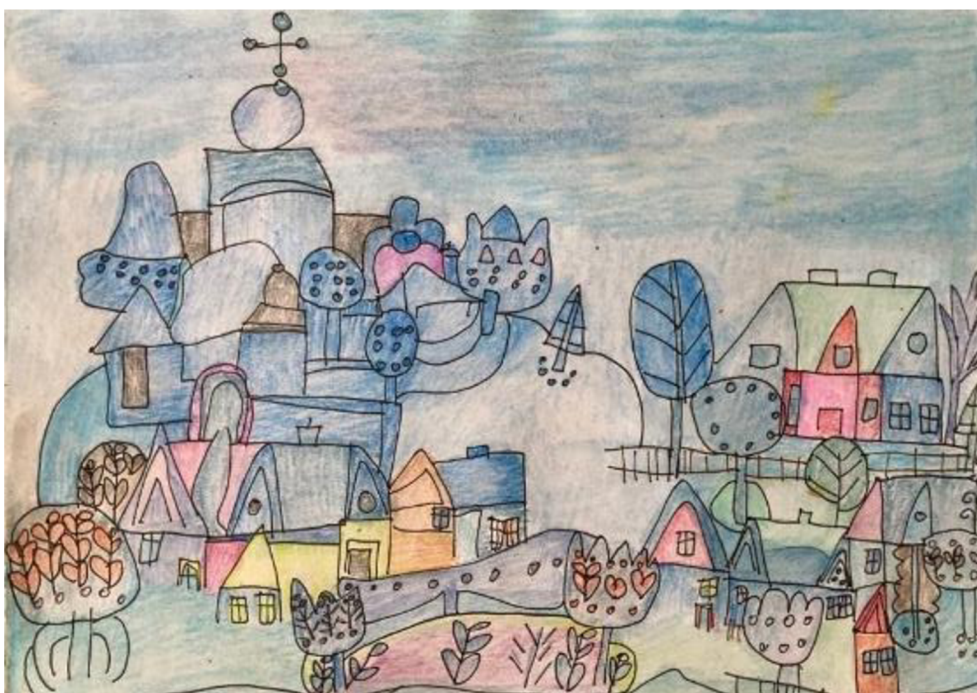
Obrázek 2: Kresba smutku od ženy č. 1