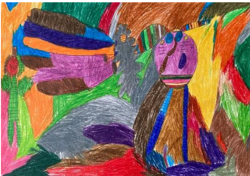
Obrázek 6: Kresba vzteku či zlosti od ženy č. 2