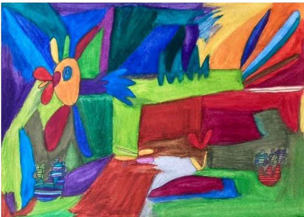
Obrázek 4: Kresba radosti od ženy č. 2