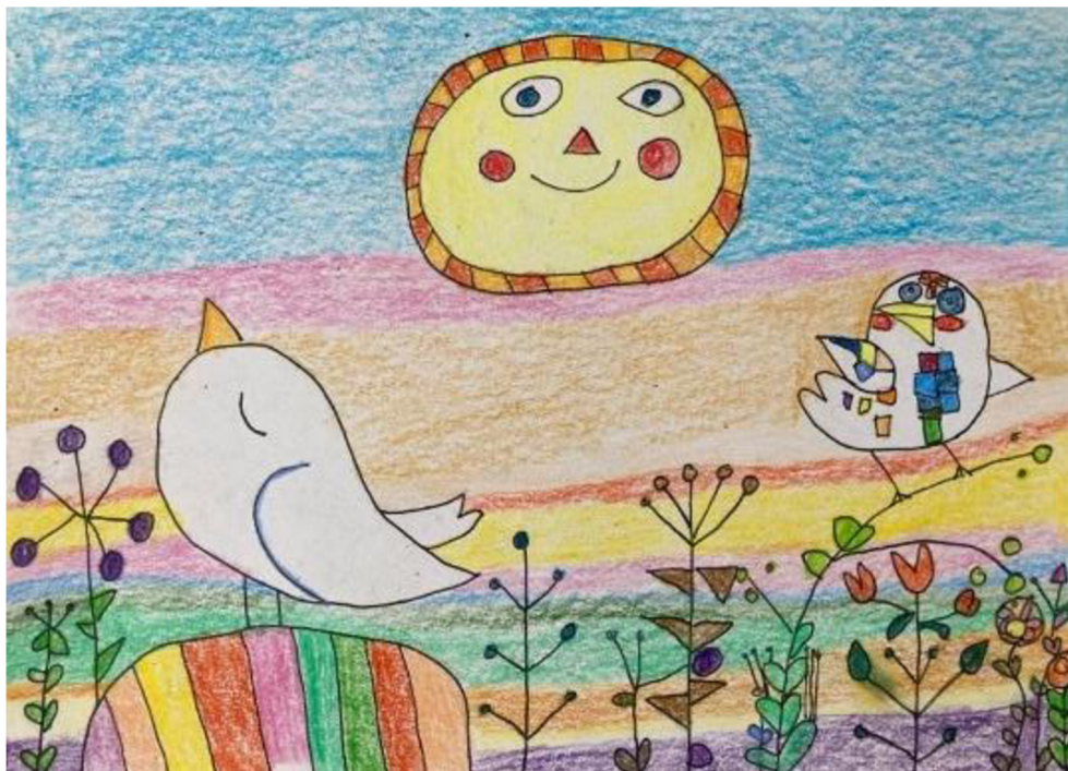
Obrázek 3: Kresba vzteku či zlosti od ženy č. 1