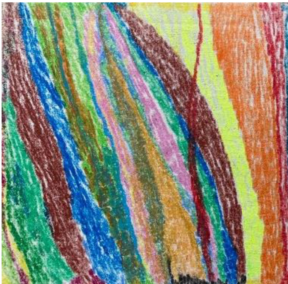
Obrázek 8: Kresba smutku od ženy č. 3