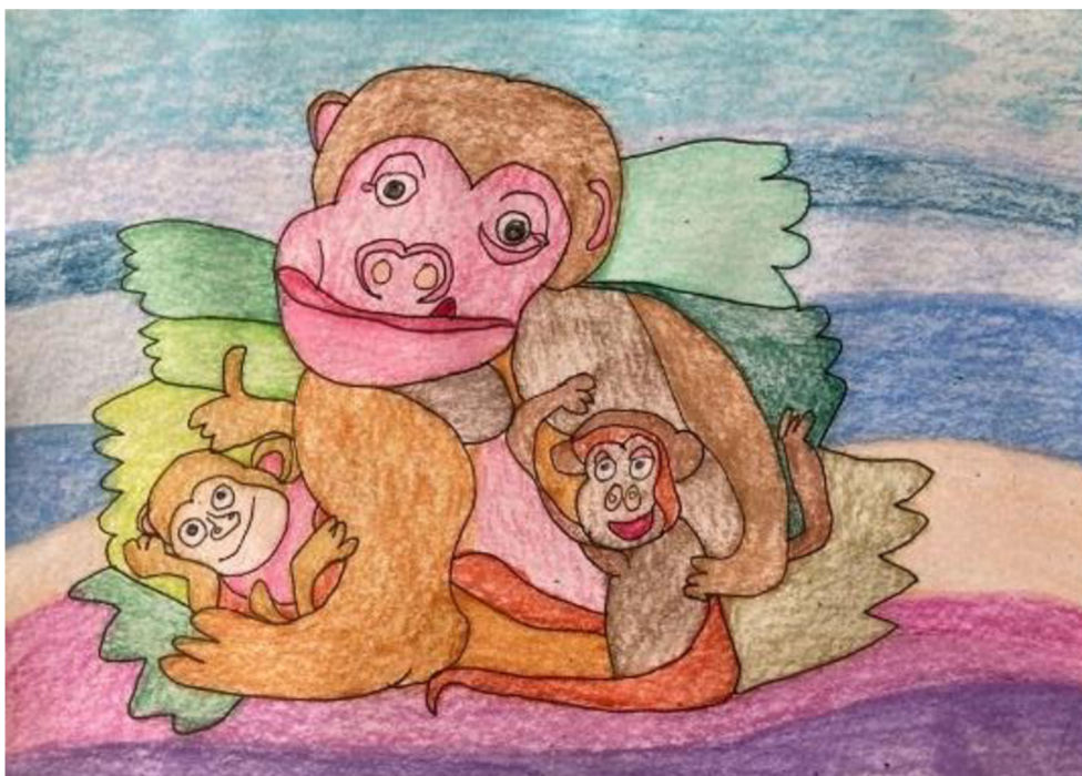
Obrázek 1: Kresba radosti od ženy č. 1