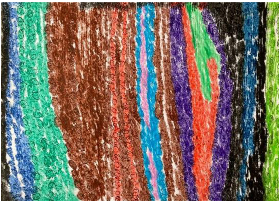
Obrázek 9: Kresba vzteku či zlosti od ženy č. 3