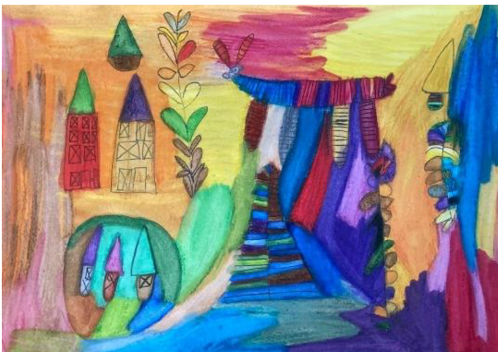
Obrázek 5: Kresba smutku od ženy č. 2