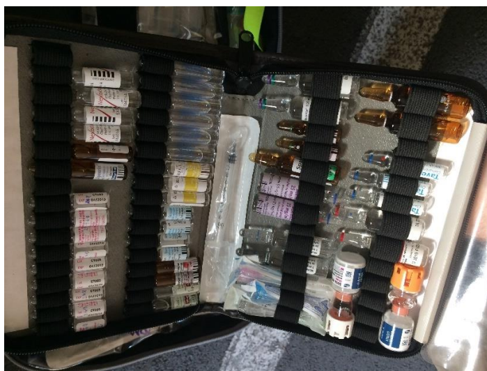
Obrázek 3 Ampulárium motocyklu (Dudich, 2018)

Přepravované vybavení je to, co byste očekávali od jakéhokoli záchranáře, i když v menších velikostech nebo množstvích. Jedním z aspektů péče, která byla před formováním omezena, bylo monitorování pacienta, zejména čidlo CO 2 snímající množství oxidu uhličitého na konci výdechu a 12svodové EKG. Vzhledem k velkému omezení hmotnosti a rozměrů bylo prověřeno několik produktů a společnost Motorcycle Riders University navrhla tašku na míru a začala nosit Schiller's Defiguard Touch 7. To znamenalo splnit nejnovější doporučení v poskytování klinické péče, aby bylo možné bezpečně reagovat a zvládat i ty nejvážněji nemocné pacienty (Hunt, 2013).