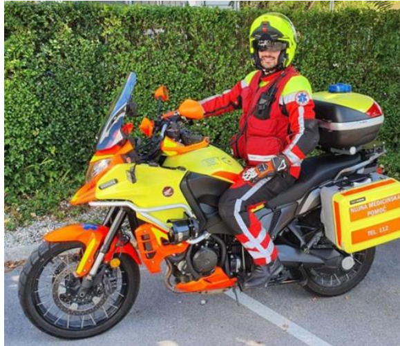
Obrázek 5 Motorcycle paramedic in Ljubljana (Sterle, 2023)