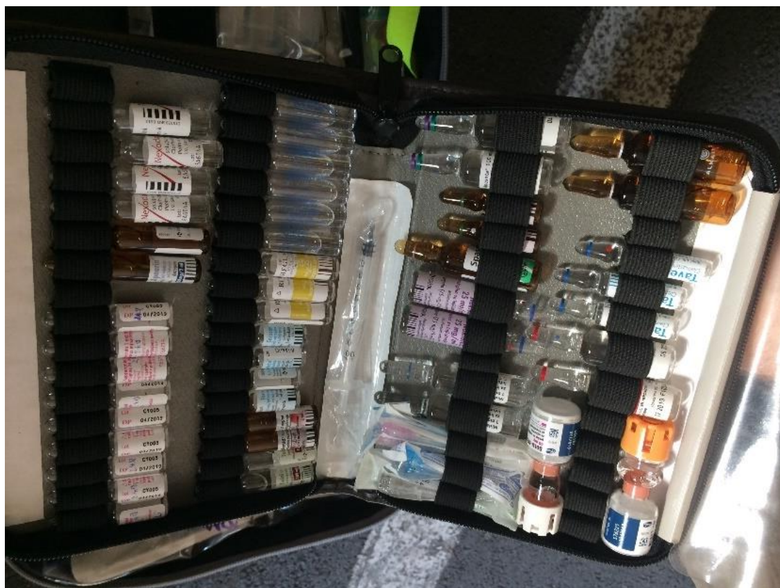
DUDICH, Tomáš. 2023. Ampulárium motocyklu.