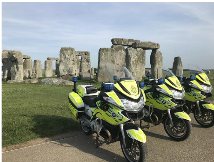
Obrázek 7 UK's first dedicated ambulance special operations motorcycle response unit (King, 2018)