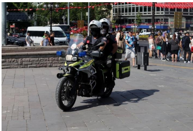
Obrázek 6 A motorcycle ambulance is driving on the street of Ankara (Akinci, 2023)

Součástí motocyklových sanitek je také téměř veškeré vybavení, které je dostupné v běžném sanitním vozu. Funkcí, která odlišuje motocyklové sanitky od běžných sanitek, je jejich schopnost dostat se k pacientovi rychleji, provést první zásah a stabilizovat pacienta, a zajistit transport pacienta v případě potřeby zavoláním čtyřkolové sanitky. Záchranáři na motocyklech poskytují lékařům život zachraňující informace a určují, zda by pacienty měla později vyzvednout čtyřkolová sanitka. To pomáhá nekritickým pacientům ušetřit čas a náklady na cestu do nemocnice. Pokud však poskytovatelé zdravotních služeb na místě případ uznají za závažný, je pacient převezen do nejbližší nemocnice sanitním vozem. Během letního období postihuje Turecko vlna veder a díky tomu jsou více v pohotovosti i záchranáři na motorkách. V tomto období dispečink obzvlášť přijímá telefonáty od pacientů, kteří trpí úpalem (Akinci, 2023).