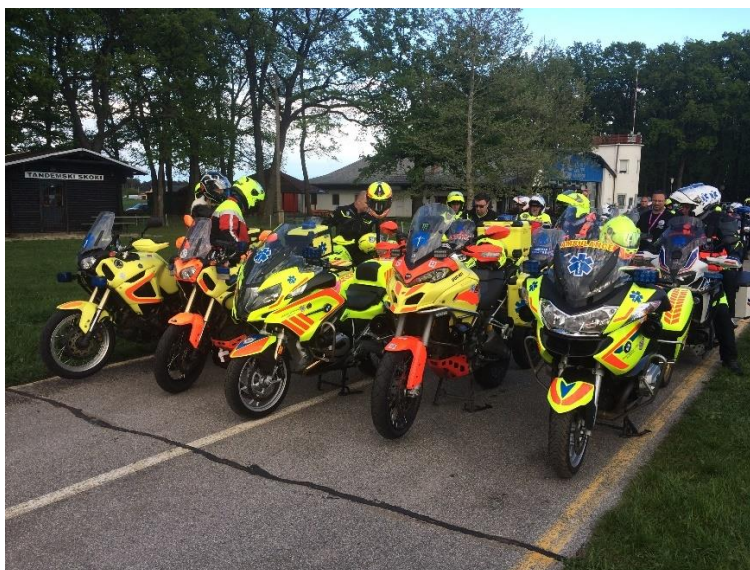
Obrázek 1 Motocyklová zdravotnická záchranná služba (Dudich, 2019)