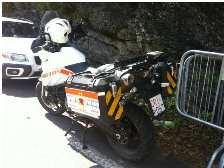
Obrázek 4 The KTM 990 for the medical response in the natural park of Punta Falcone, Piombino (Tesser, 2020)

Počáteční investice motocyklové ambulance činí v průměru 15 000 euro. Lékař nebo záchranář musí mít vlastní řidičský průkaz a absolvovat školení bezpečné jízdy. Tento systém se ukazuje jako nejlevnější při zachování vysoké kvality práce zdravotníka na místě zásahu. Po dosažení cíle v závislosti na závažnosti pacienta může zdravotník nastoupit do sanitky a pokračovat v terapii až do nemocnice. Limity tohoto řešení představuje nutnost vlastnit vyhrazený řidičský průkaz a specifické školení pro bezpečnou jízdu ze strany zdravotnického/ošetřujícího personálu. Dalším omezením je skutečnost, že jakmile nastoupí zdravotnický personál do sanitky, nechává motocykl bez dozoru (Tesser, 2020).