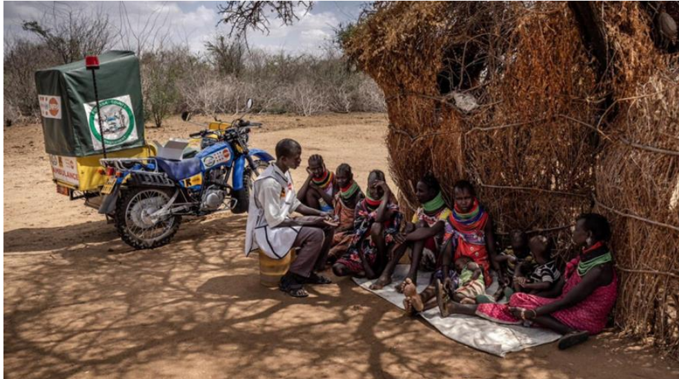
Obrázek 8 The motorcycle ambulance has significantly reduced the time required to deliver essential and urgent medical assistance to local communities (Epeyon, 2023)