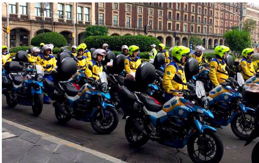
Obrázek 9 The new two-wheel ambulances (Koen, 2019)