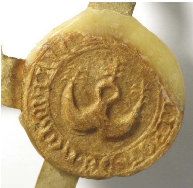
Obr. 5: Otisk pečeti Modliboha z Heřmanic z roku 1360. Národní archiv v Praze, fond Benediktini – klášter Břevnov, Praha (1174–1952), inv. č. 114.

Pečeť přivěšená k listině z roku 1360 ovšem není ani jediným, ani nejstarším otiskem tohoto pečetního typáře. Již z roku 1356 pochází stejný typ pečeti Modliboha z Heřmanic, který je narozdíl od mladšího otisku dochován v úplnosti a je velmi dobře čitelný. 209 A je zde ještě jeden rozdíl. Materiálem ke zhotovení této pečeti nebyl přírodní vosk jako v předchozím případě, ale vosk červený. Samotná listina, ke které je tato pečeť přivěšena, je pro poznání