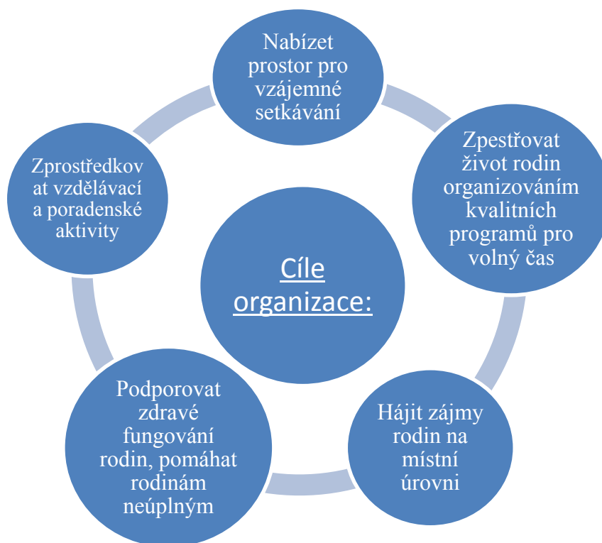
Graf č. 2 Cíle organizace