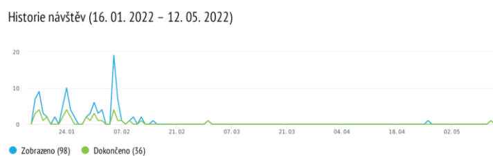
Obrázek 3 – Historie návštěv

Jak z této studie vyplynulo, zdá se, že je dost důležité načasování odeslání dotazníku. Jistým limitem či nevýhodou se zdá v tomto kontextu být skutečnost, že byl dotazník rozeslán v období po ukončení zimního semestru a několik měsíců před státními závěrečnými zkouškami. Podle počtu automatických zpráv o (ne)otevření mailu a počtu vyplněných dotazníků i reakcí tří studentek, které se ozvaly mailem (primárně s dotazem na škálování), se dá konstatovat, že studenti měli jen malý důvod být aktivní na školním mailu. Eventuálně se v rámci příprav na státní závěrečné zkoušky neměli moc zájem se zabývat jinou činností nesouvisející bezprostředně s jejich vlastním studiem. Proto byl původní čas zveřejnění online dotazníku pro vyplnění prodloužen ze 2 měsíců na 4 měsíce (konkrétně 117 dnů). Nicméně prodloužený čas přinesl jenom několik málo odpovědí. Dalším limitem se zdá být náročnost dotazníku. Od pěti studentů, kteří deklarovali, že dotazník vyplnili, dorazila zpětná vazba, že je dotazník dlouhý a náročný na porozumění. Limitující může být i fakt, že při anonymních šetřeních nevíme, kdo dotazník ve skutečnosti vyplnil a jestli samostatně. V případě jednoho respondenta se vrátila velmi negativní reakce doslova na neadekvátní obsah dotazníku.