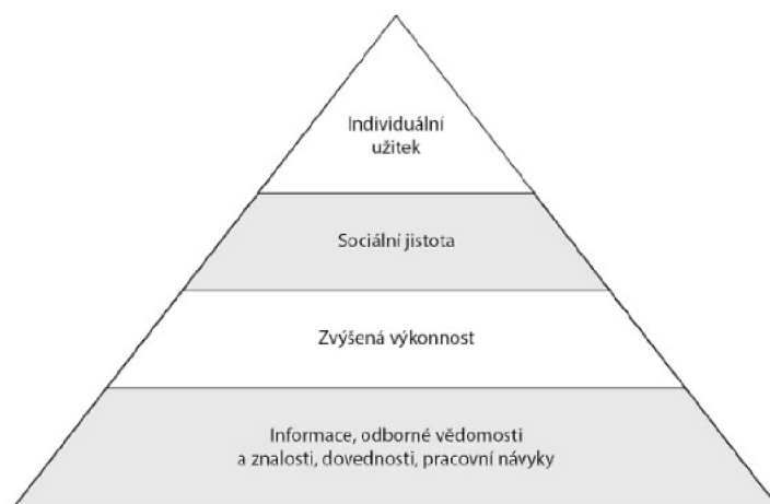
Obr. č. 1 Pyramida motivace učení

Mezi základní potřeby, které se v pyramidě nachází dole, řadíme informace, odborné vědomosti a znalosti, dovednosti, pracovní návyky. V následujícím patře je umístěna zvýšená výkonnost, poté sociální jistota a nejvyšší bod pyramidy patří individuálnímu užitku. 38