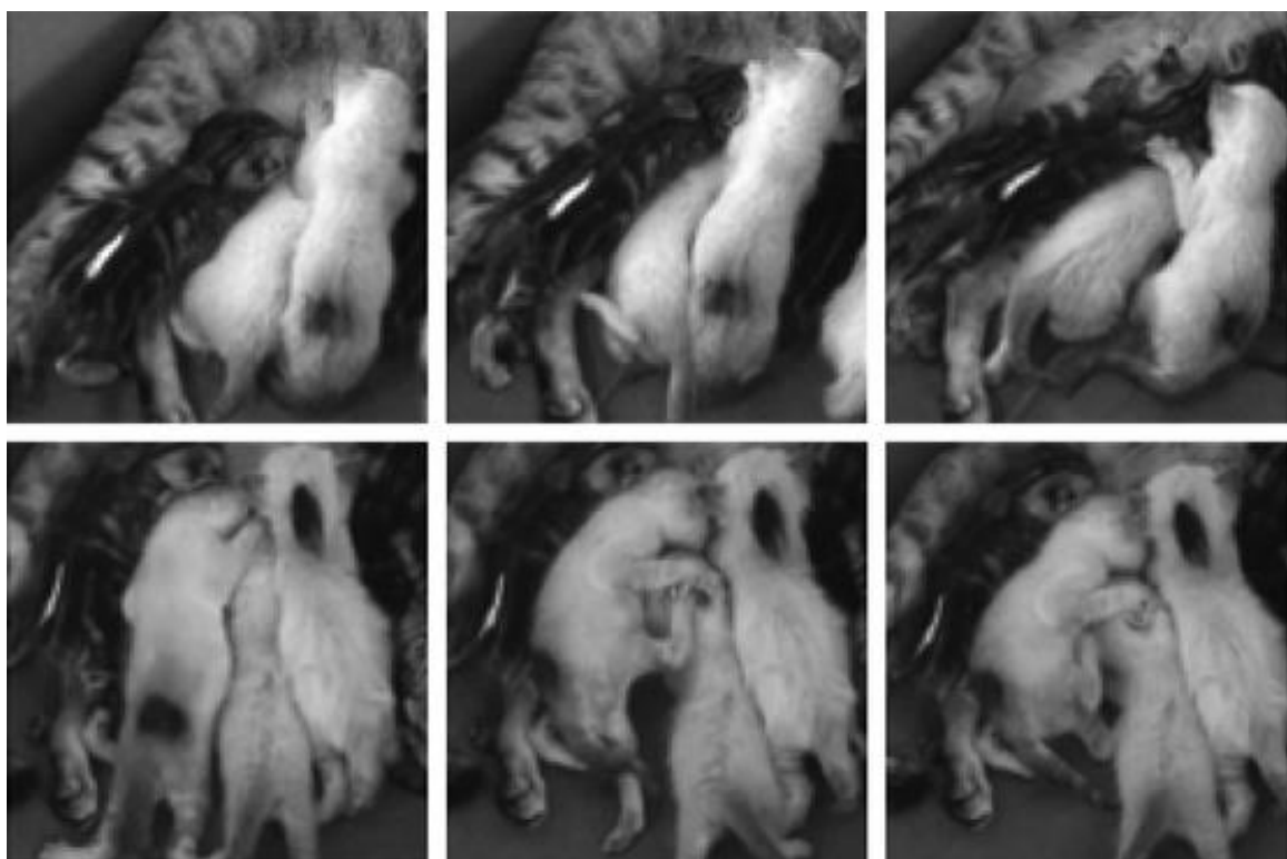
Obrázek 2: Vytlačování sourozence od struku u koťat (Hudson et al., 2013).