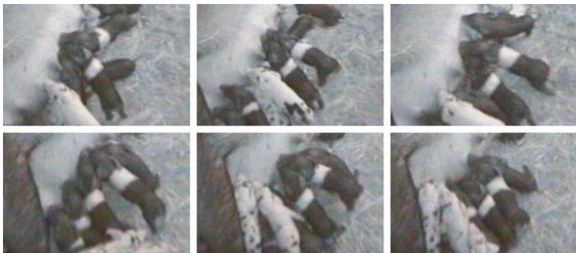
Obrázek 3: Selata silně tlačí na povrch vemene, když bojují o struky (Skok et al., 2014).