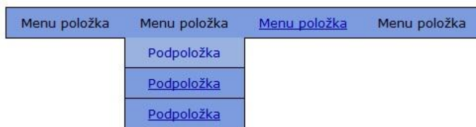
Obrázek 2 - Float:left (prohlížeč Opera)

Použito bylo pro jistotu float:none i clear:both . Avšak právě float:none způsobilo v Internet Exploreru problémy. Stačilo tuto vlastnost odstranit. Následným otestováním se ukázalo, že dědění float:left nevádí, protože clear:both obtékání přesto zakáže.