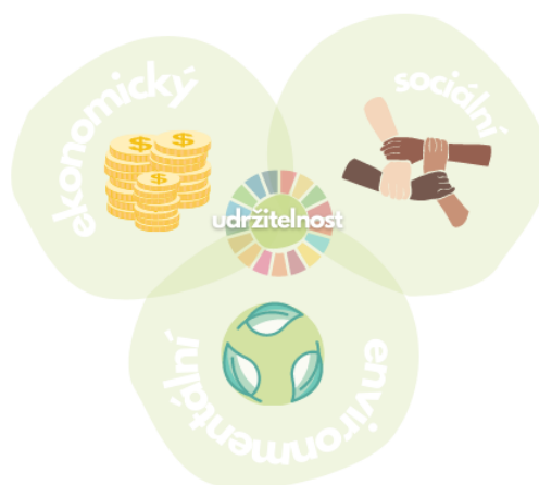
Obrázek 1 – Pilíře udržitelného rozvoje