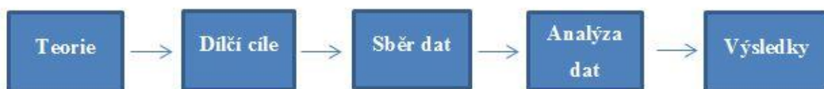
Schéma č. 1 postup výzkumu 92

Kvalitativní výzkum je nejčastěji používaný výzkum v sociálních vědách. A tam je interpretován jako výzkum, který se zaměřuje na to, jak lidé nahlízejí, chápou a interpretují svět. Můžeme říct, že tento typ zahrnuje popis a interpretaci lidských problémů a ve své podstatě se snaží vytvořit komplexní obraz zkoumaného. 90 Termínem kvalitativní výzkum rozumíme jakýkoliv výzkum, jehož výsledku se nedosahuje pomocí statistických procedur nebo jiných způsobů kvantifikace. 91 Metoda kvantifikace, či statistických výsledků je účinná u velkého vzorku respondentů a vhodně zvolené metody zkoumání. Z tohoto důvodu byl pro tuto práci vybrán výzkum kvalitativní. Postup výzkumu si nastíníme pouze na nákresu (Schéma č. 1 postupu výzkumu).