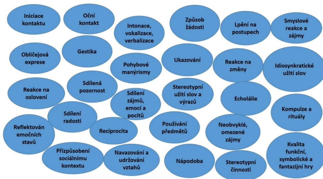
Obrázek 1: Spektrum projevů autismu

souhrnně nazývána poruchy autistického spektra. „ Jak už termín spektrum napovídá, projevy jsou za prvé velmi různorodé (představme si barvy spektra) a za druhé nesteréjně závažné (představme si odstíny od lehkého zbarvení po temné tóny). Existují lidé na spektru, kteří potřebují vysokou míru podpory při naplňování i těch nejzákladnějších potřeb. Mají těžkou poruchu komunikace, nemluví, negestikulují, nerozumí řeči. Potřebují asistenci při péči o vlastní osobu, mohou se na veřejnosti pohybovat pouze s doprovodem. Přitom všem mohou a nemusí mít poruchu intelektu. Často oni sami i jejich okolí trpí důsledky závažných odchylek v chování. Na autistickém spektru rovněž najdeme osoby, které fungují zcela nezávisle, studují, mají dobrou práci, děti, přátele a žijí spokojený život. “