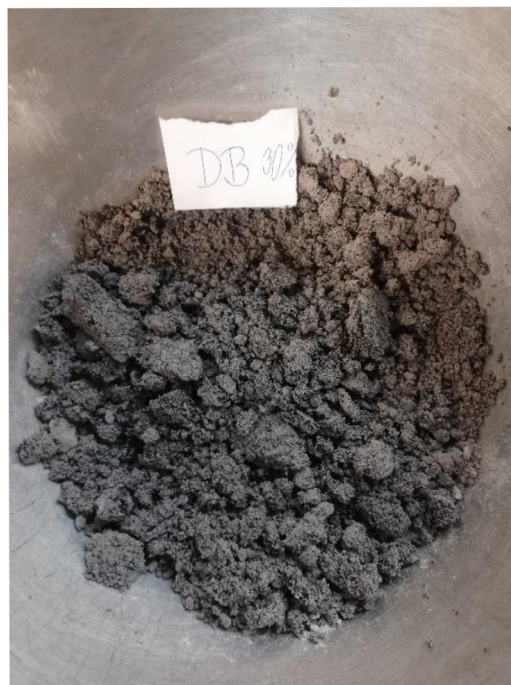
Obrázek 3: Kal se 30% dávkou aditiva DAS B během procesu homogenizace.