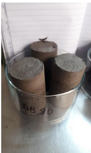
Obrázek 7: Vzorek DB 30 po vyjmutí z PVC formy po dvou dnech v digestoři.