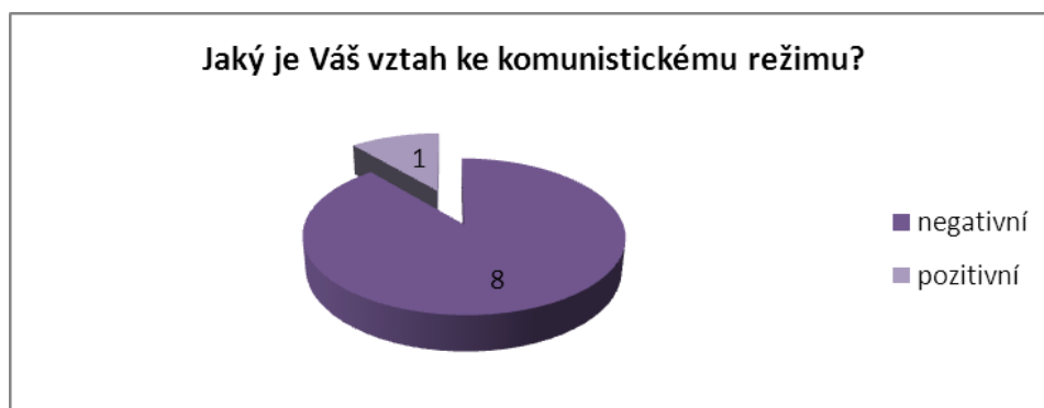
Graf 1 – Vztah ke komunistickému režimu (zdroj: vlastní zpracování)

Otázka „Jaký je Váš vztah ke komunistickému režimu?“ přinesla jednoznačné výsledky. Graf 1 znázorňuje početní vyjádření vztahu respondentů ke komunistickému režimu.