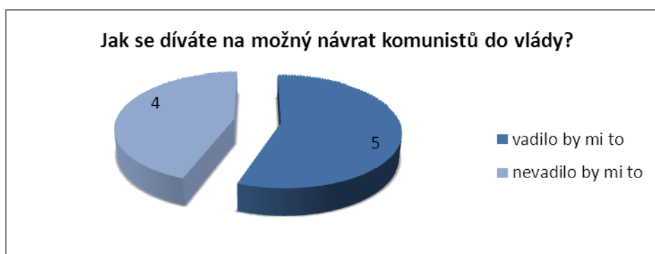
Graf 2 - Názor na možný návrat komunistů do vlády

Otázka „ Jak se díváte na možný návrat komunistů do vlády? “ rozdělila respondenty do dvou názorově opačných skupin. Možný návrat komunistů do vlády by vadil 5 respondentům, 4 respondentům by tento návrat nevadil. Graf 2 vyjadřuje tento názor v grafickém znázornění.