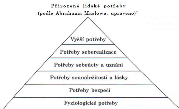
Obrázek č. 1: Pyramida potřeb dle P. Kopřivy, zdroj: Kopřiva, 2008, s. 189

Touto teorií se inspiroval i Kopřiva (2008), který ji vnímá jako praktický nástroj pro pochopení dětského chování. Někteří autoři (včetně Kopřivy) nad tyto potřeby do pyramidy ještě staví potřeby „vyšší“, do kterých spadají estetické, etické a duchovní potřeby.