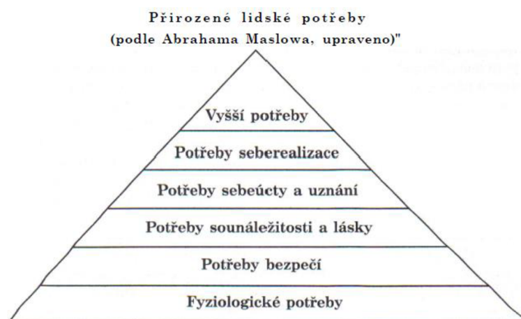
Obrázek č. 1: Pyramida potřeb dle P. Kopřivy, zdroj: Kopřiva, 2008, s. 189

Touto teorií se inspiroval i Kopřiva (2008), který ji vnímá jako praktický nástroj pro pochopení dětského chování. Někteří autoři (včetně Kopřivy) nad tyto potřeby do pyramidy ještě staví potřeby „vyšší“, do kterých spadají estetické, etické a duchovní potřeby.